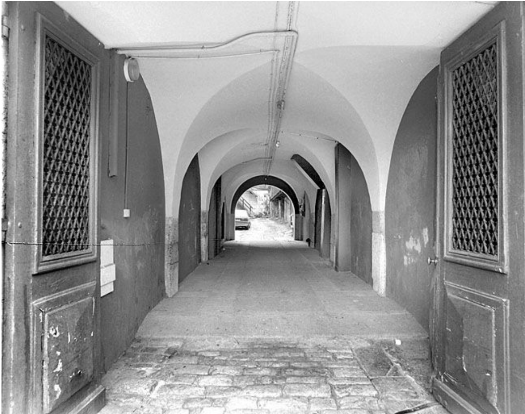
Passage couvert, depuis la rue.