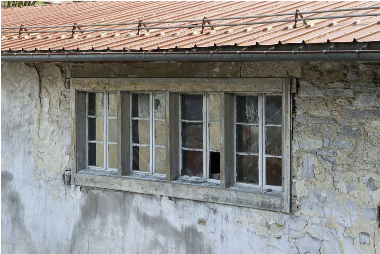
Fenêtres lunetières de l'aile sud.