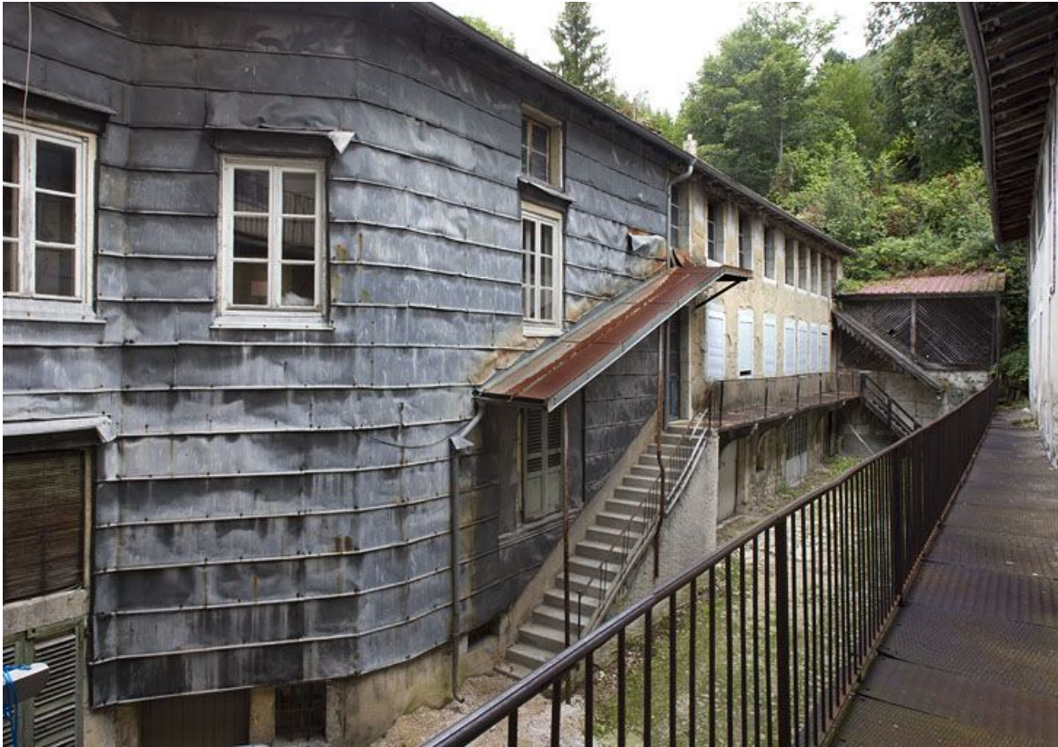
Aile nord, de trois quarts gauche.