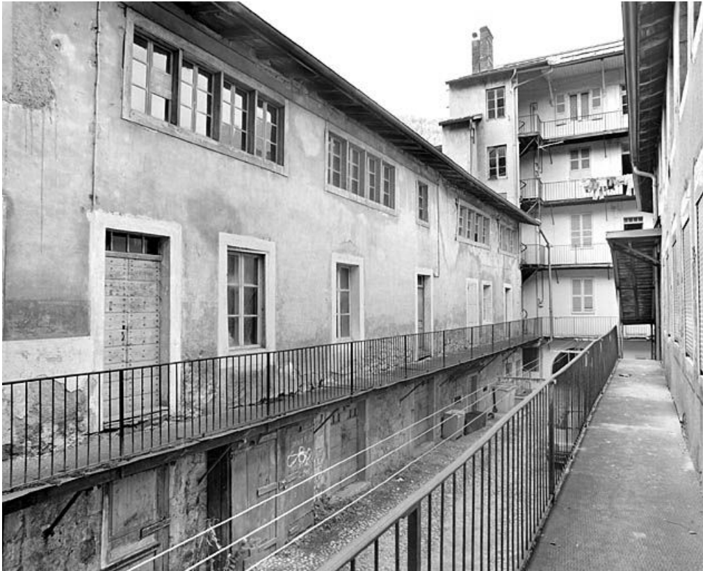
Aile sud, de trois quarts gauche.