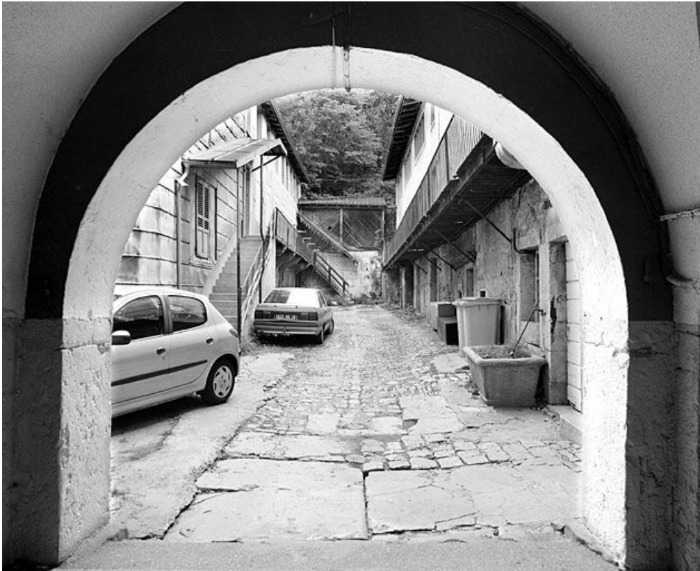
La cour depuis le passage couvert.