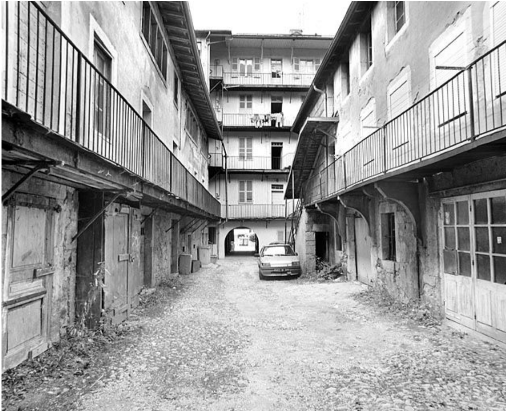
Cour et élévation postérieure.