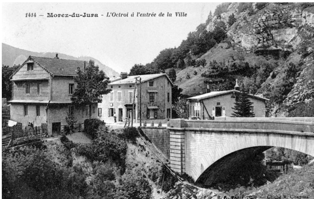
Morez-du-Jura - L'Octroi à l'entrée de la Ville, entre 1914 et 1921.