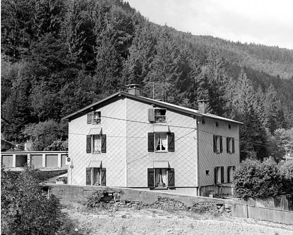
Elévations postérieure et latérale droite.