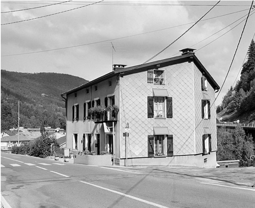
Elévations antérieure et latérale droite.