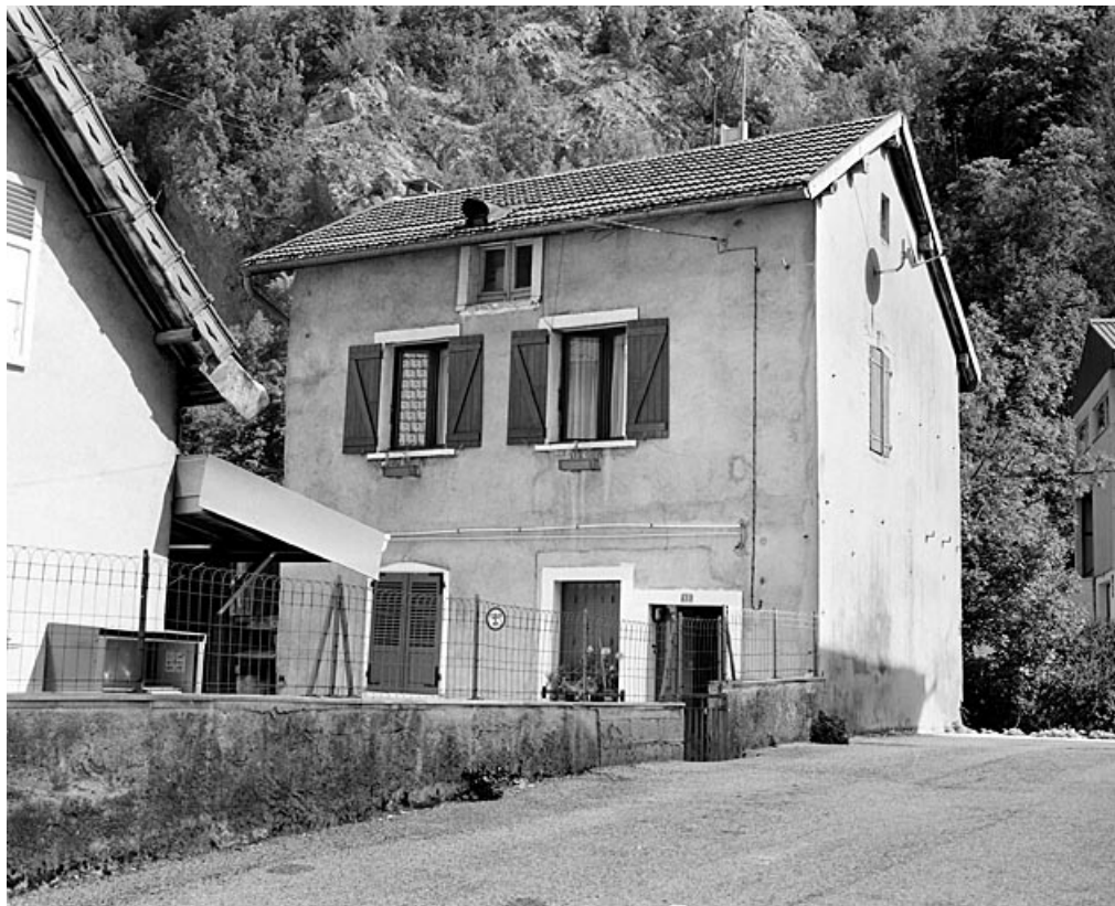
Maison au n° 13 : élévation antérieure, de trois quarts droite.