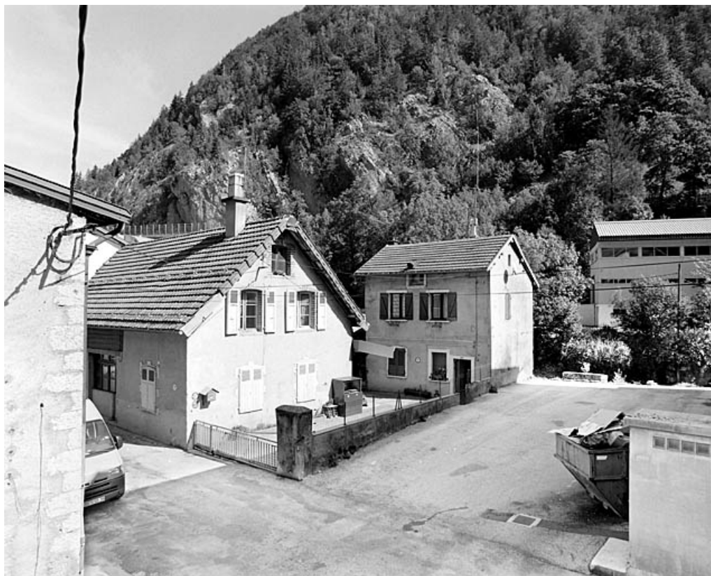
Vue d'ensemble, depuis le sud-ouest : élévations antérieures.