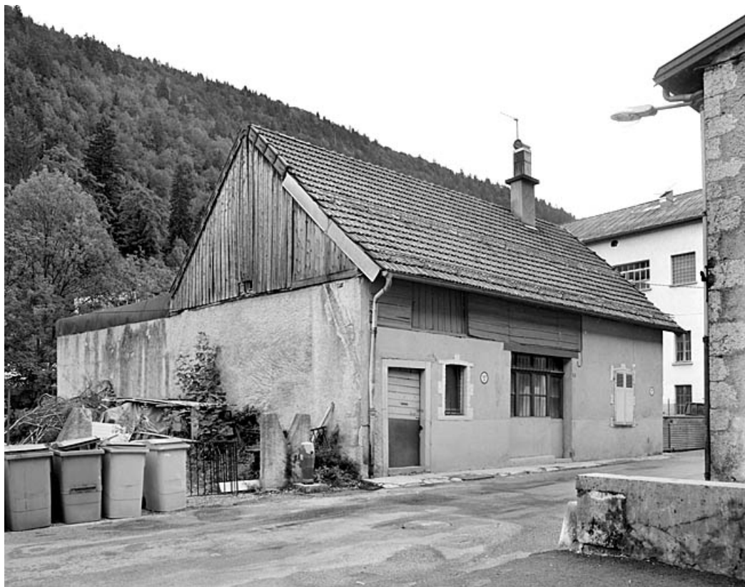
Maison au n° 11 : élévation antérieure, de trois quarts gauche.