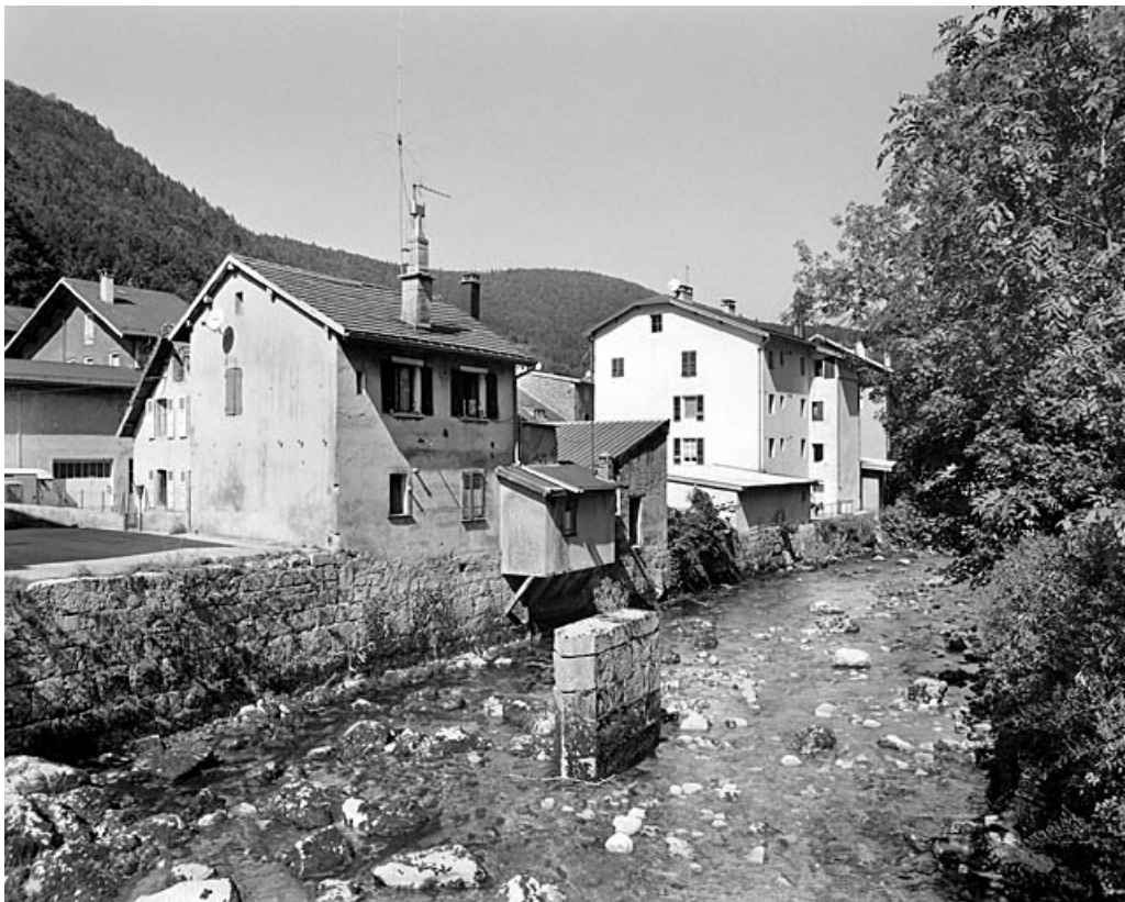
Vue d'ensemble, depuis le sud-est : élévations postérieures.