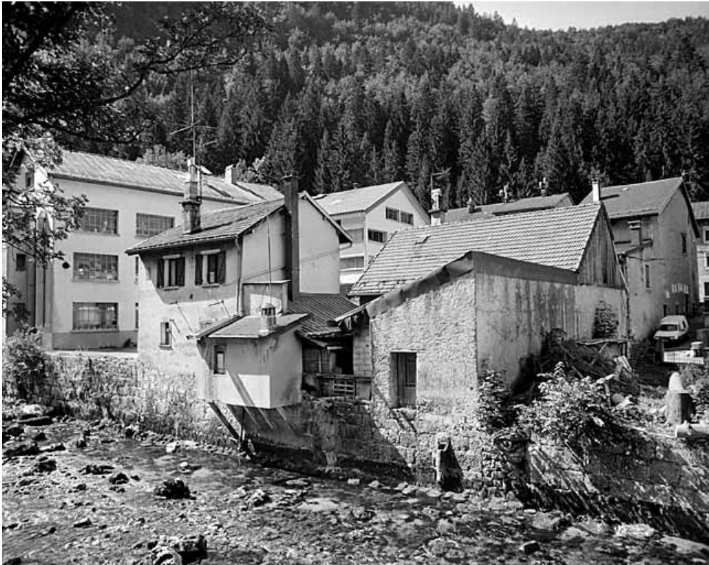
Vue d'ensemble, depuis le nord-est : élévations postérieures.