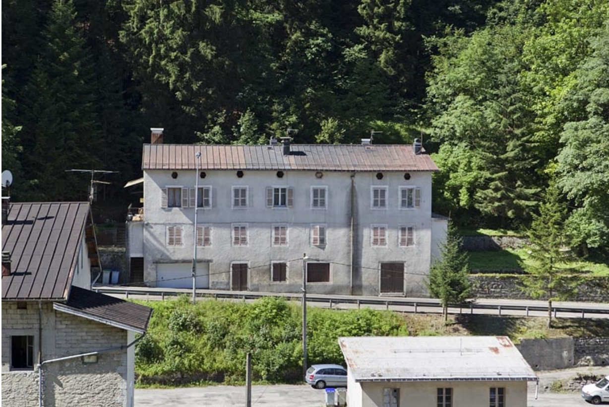
Vue d'ensemble plongeante, depuis le nord-est.