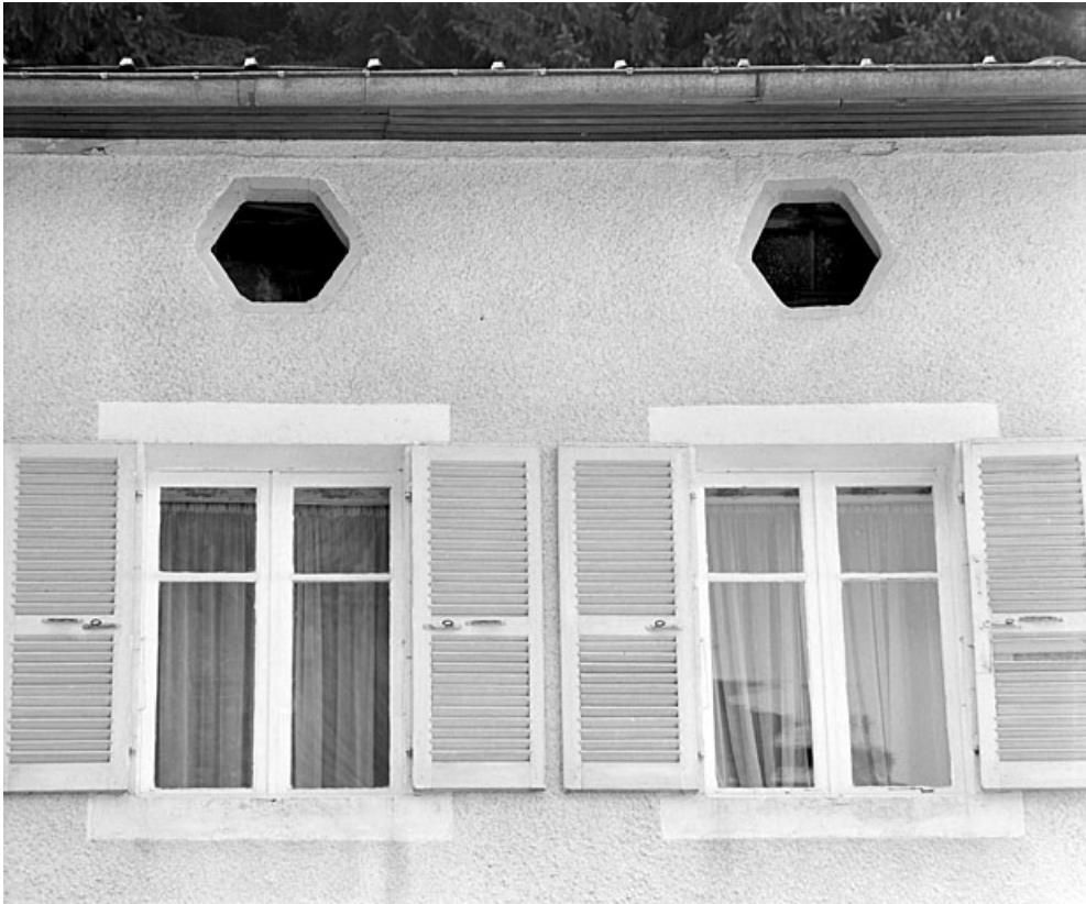
Baies de l'étage carré et du comble à surcroît.