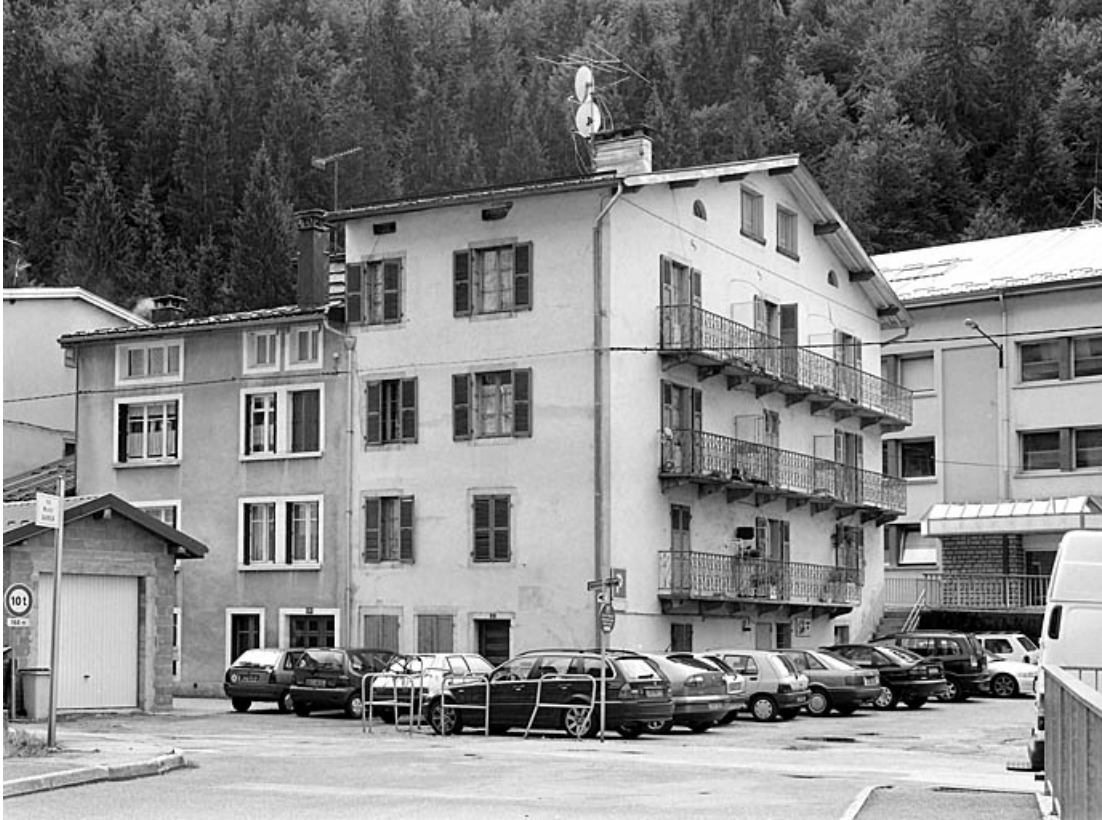
Vue d'ensemble, depuis le nord-est (rue Emile Zola).