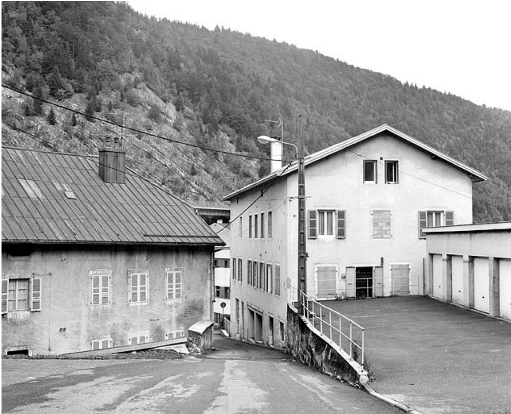
Immeuble : élévation occidentale.