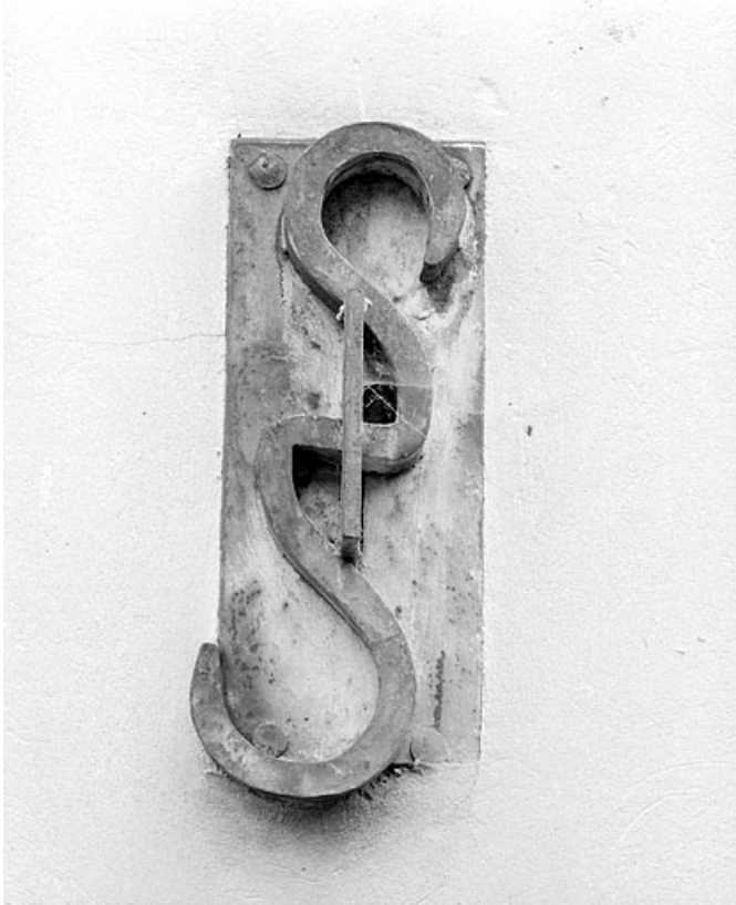
Immeuble : ancre en S sur le mur pignon occidental.