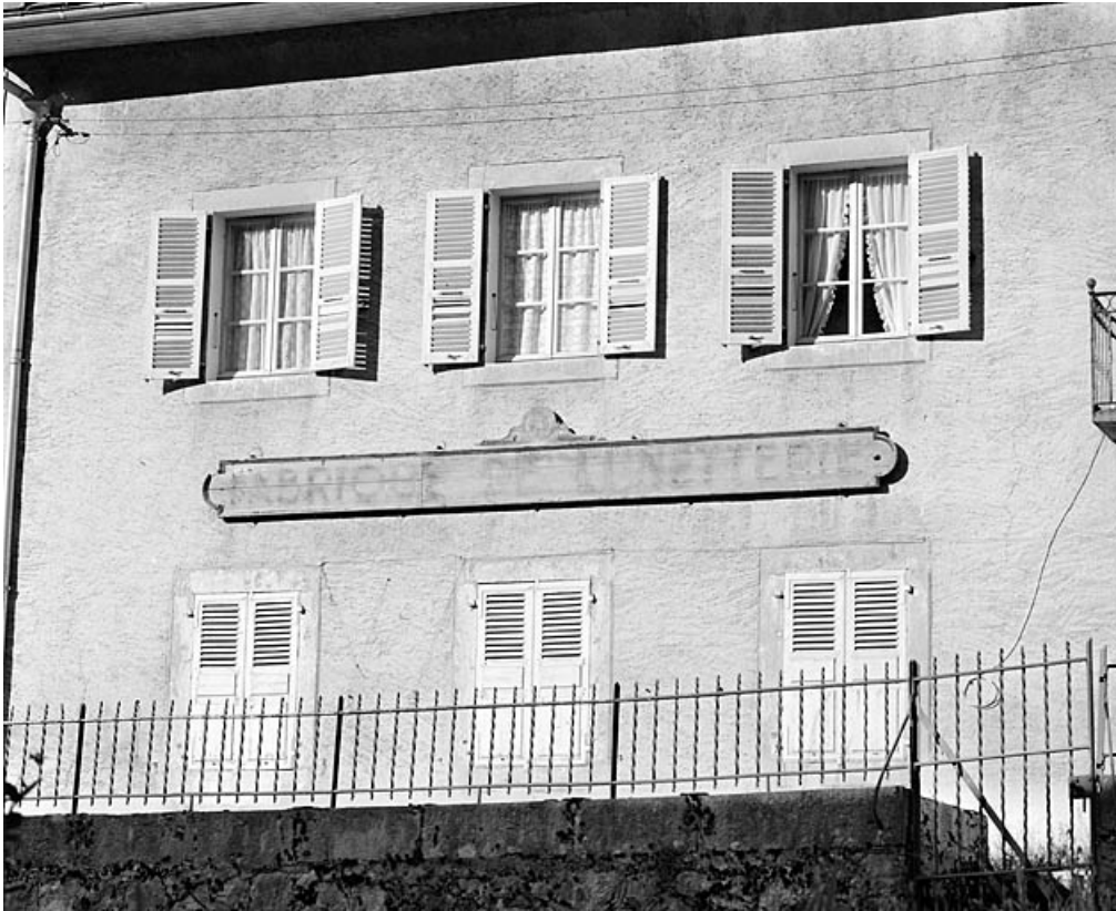
Maison : enseigne sur l'élévation latérale droite.