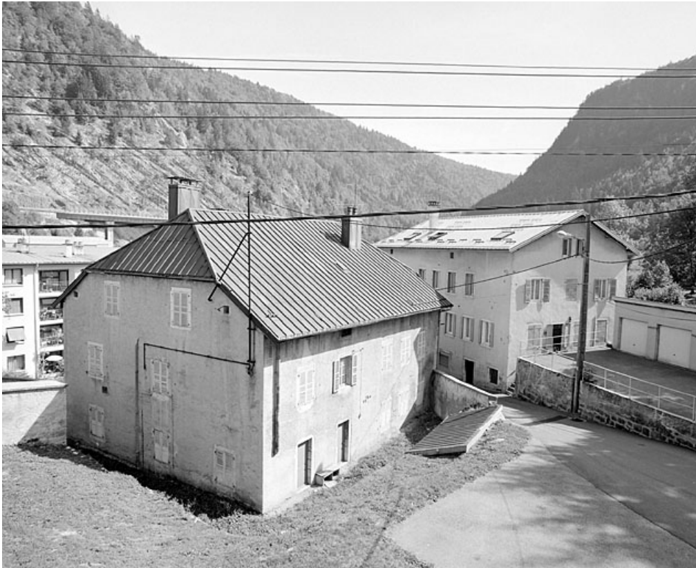
Vue d'ensemble, depuis le nord-ouest.