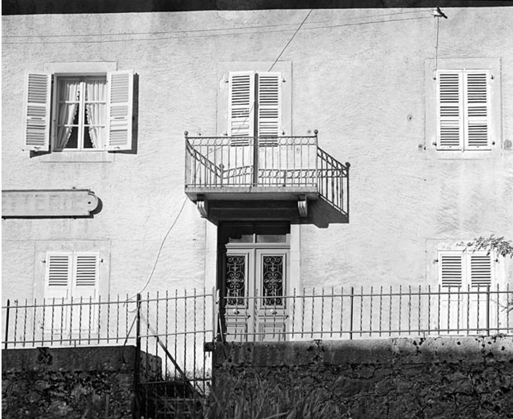
Maison : porte et porte-fenêtre de l'élévation latérale droite.