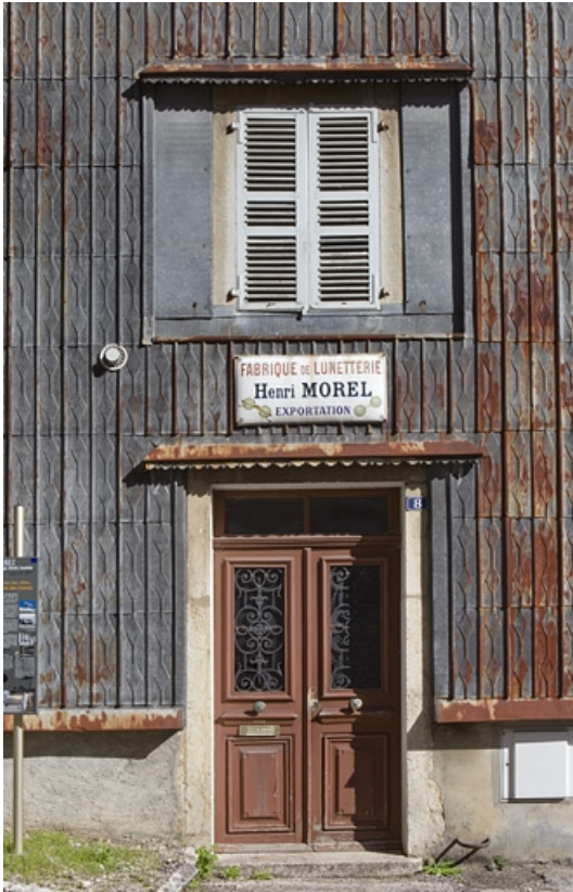
Maison : travée centrale de l'élévation antérieure. 39, Morez, 7, 8 rue de la Tannerie