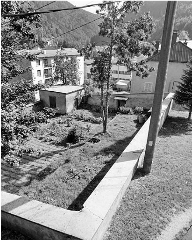
Maison : jardin potager nord.