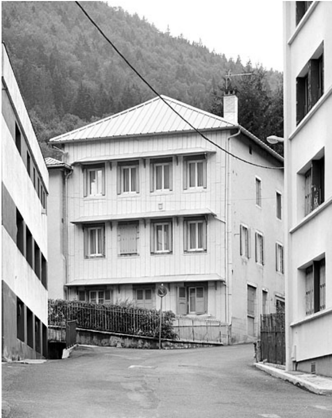
Immeuble : élévation orientale.