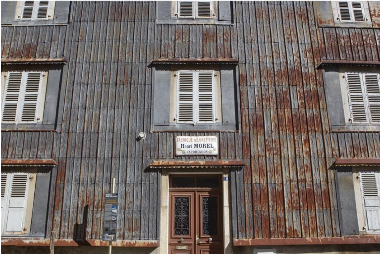
Maison : essentage de tôle sur l'élévation antérieure.