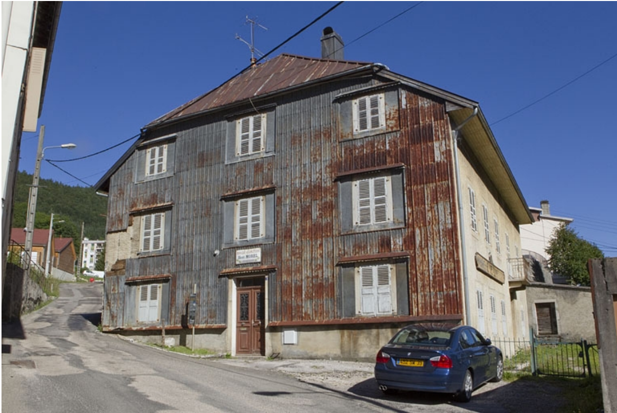
Maison : élévation antérieure, de trois quarts droite.