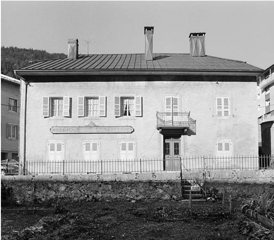
Maison : élévation latérale droite.