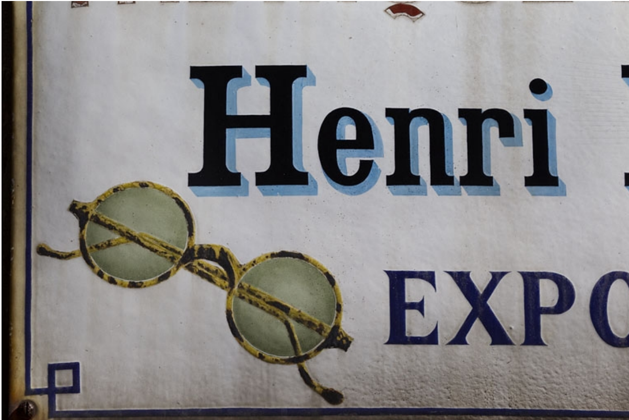
Maison : détail de la plaque émaillée (lunettes).