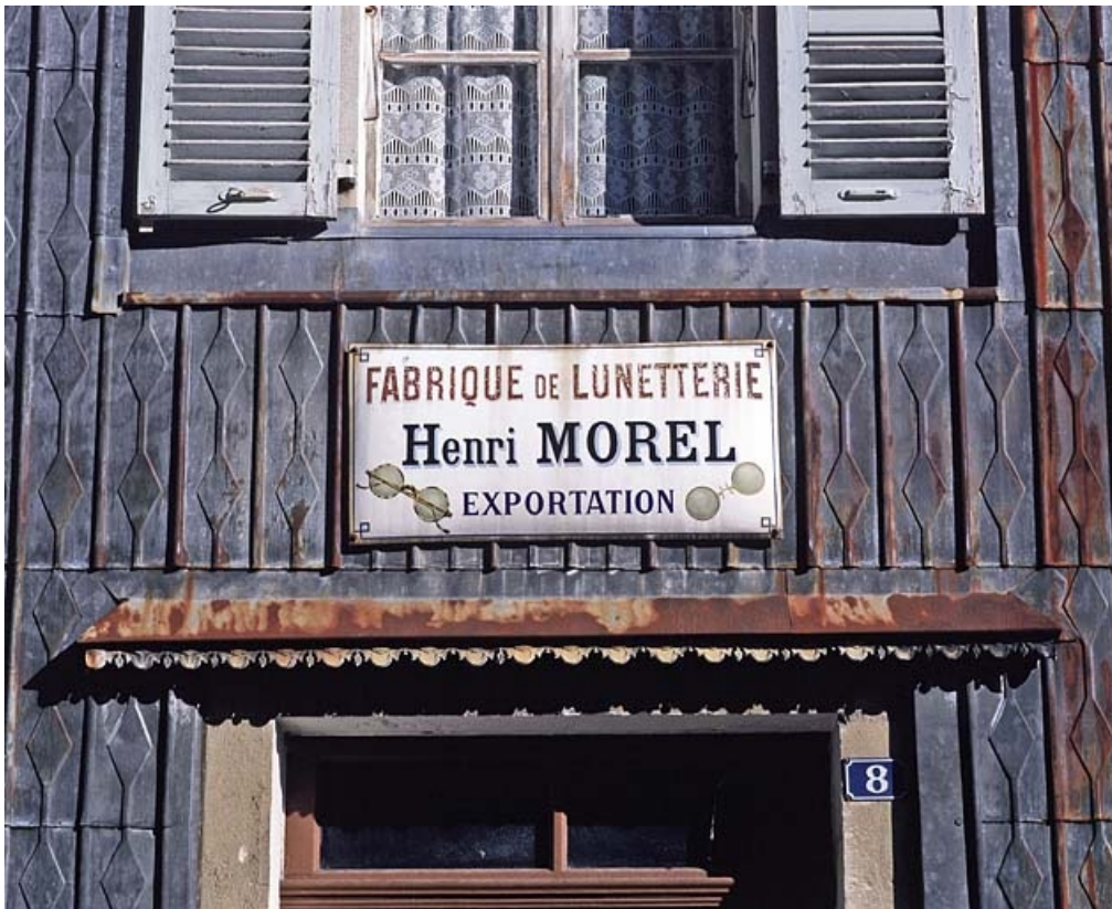
Maison : essentage de tôle et plaque émaillée.