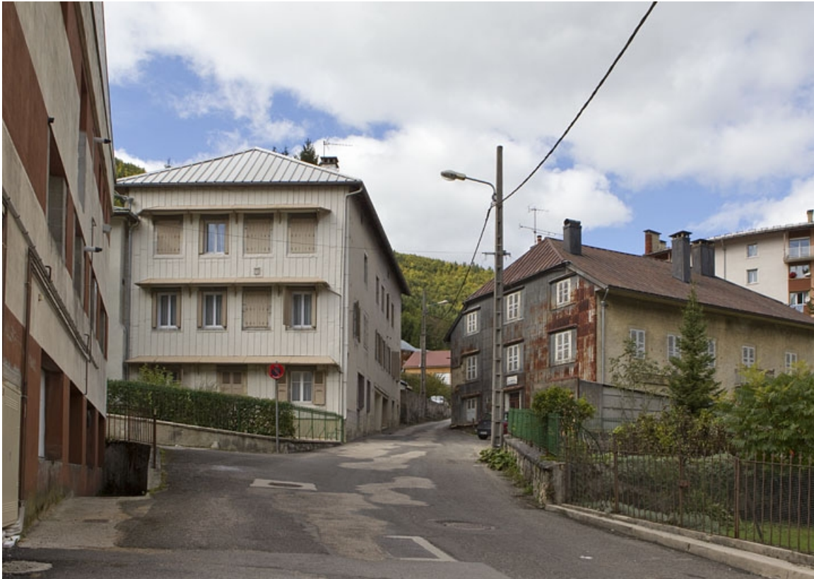
Vue d'ensemble, depuis l'est.