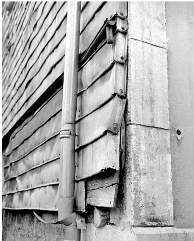
Essentage de tôle sur le mur sud.