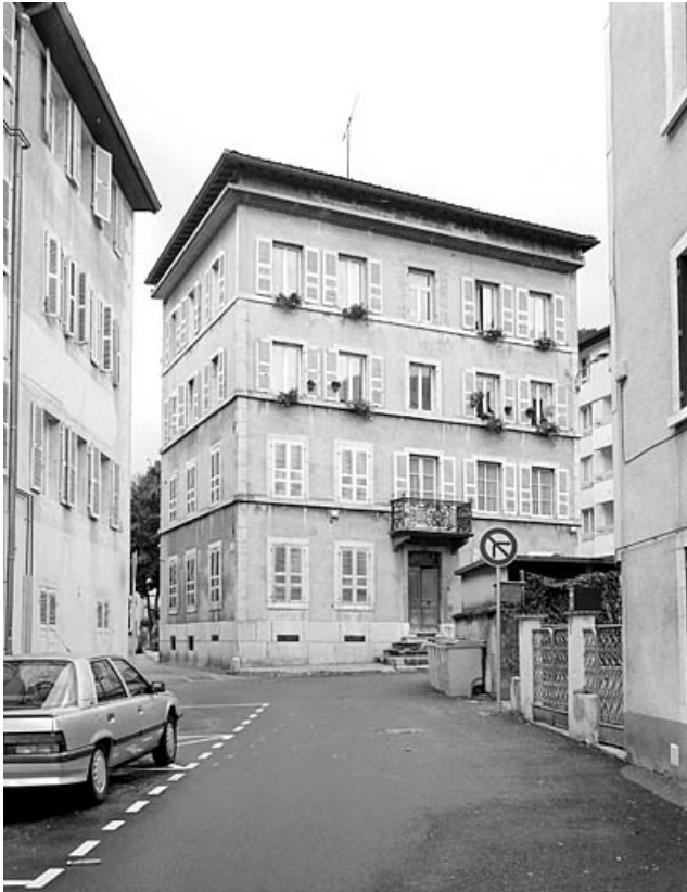
Elévation antérieure, de trois quarts gauche.