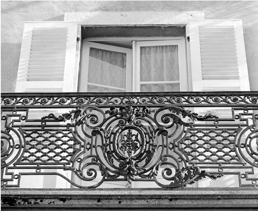
Balcon du premier étage : détail du garde-corps.