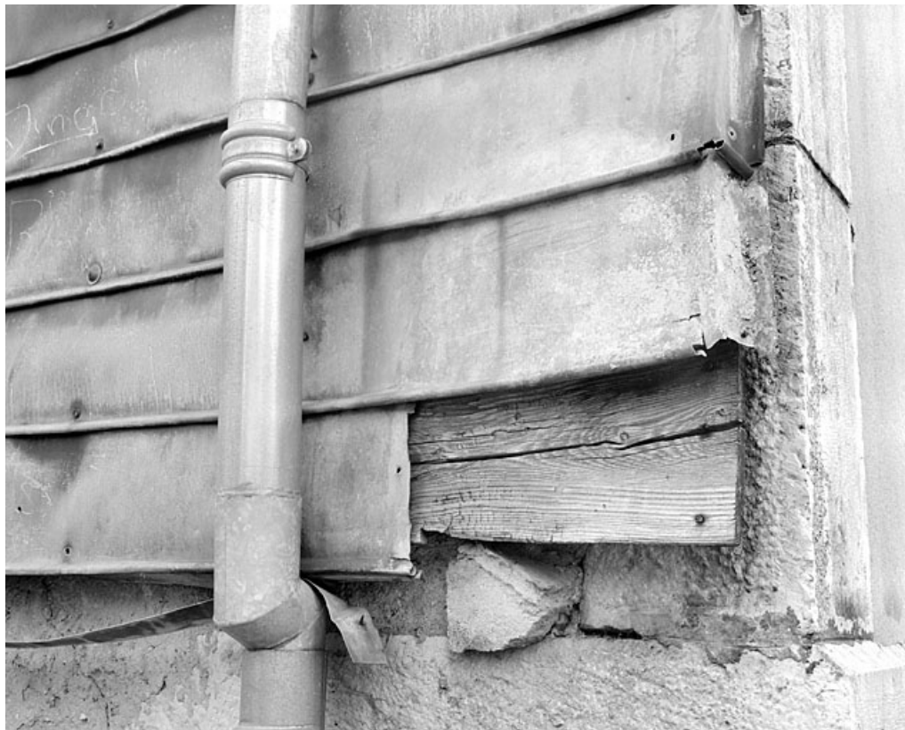
Essentage de tôle sur le mur sud : détail.