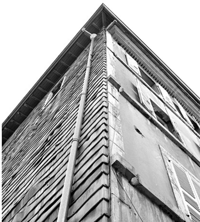
Angle des murs sud et est.