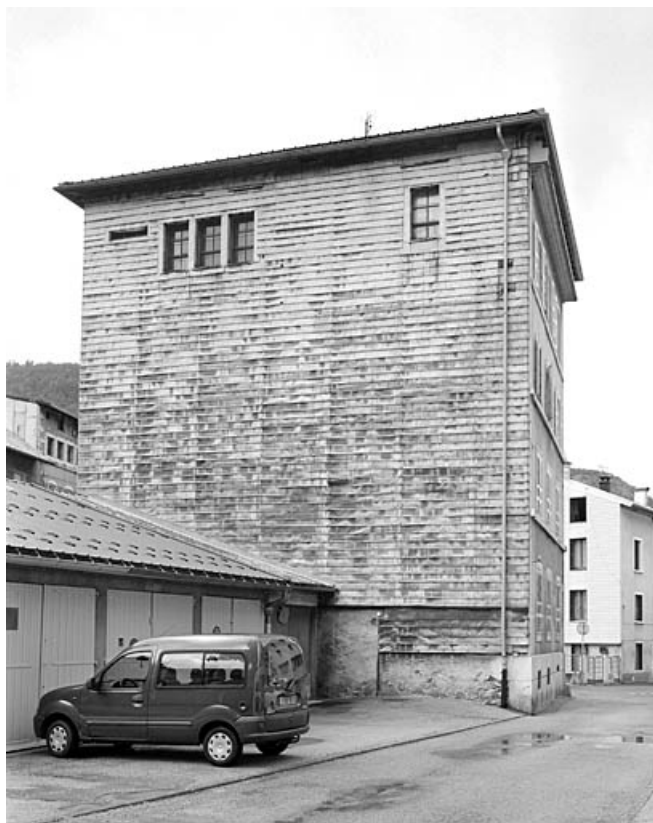
Elévation postérieure, de trois quarts droite.