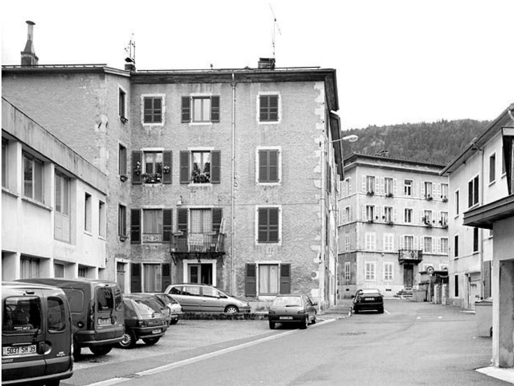
Bâtiment au n° 21, vu du nord.