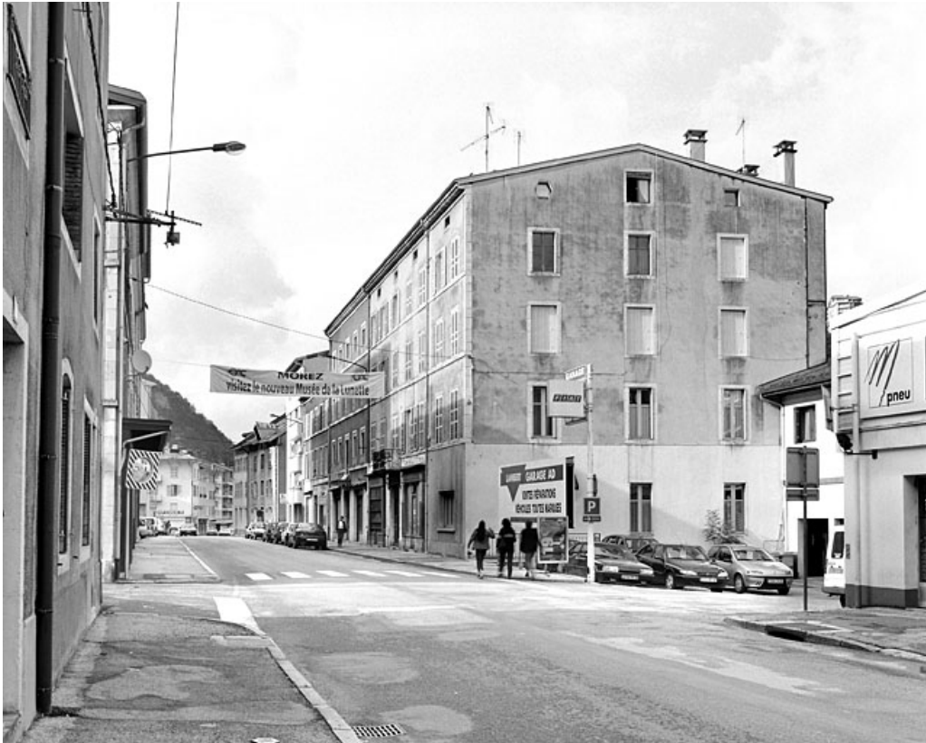
Vue d'ensemble, de trois quarts droite. 39, Morez, 187, 189 rue de la République