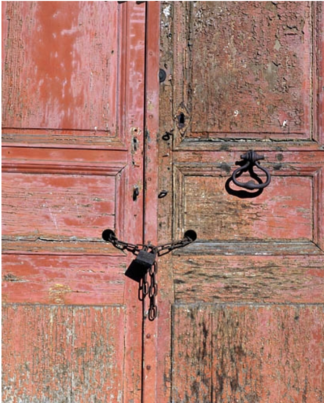
Entrée principale : détail des vantaux.