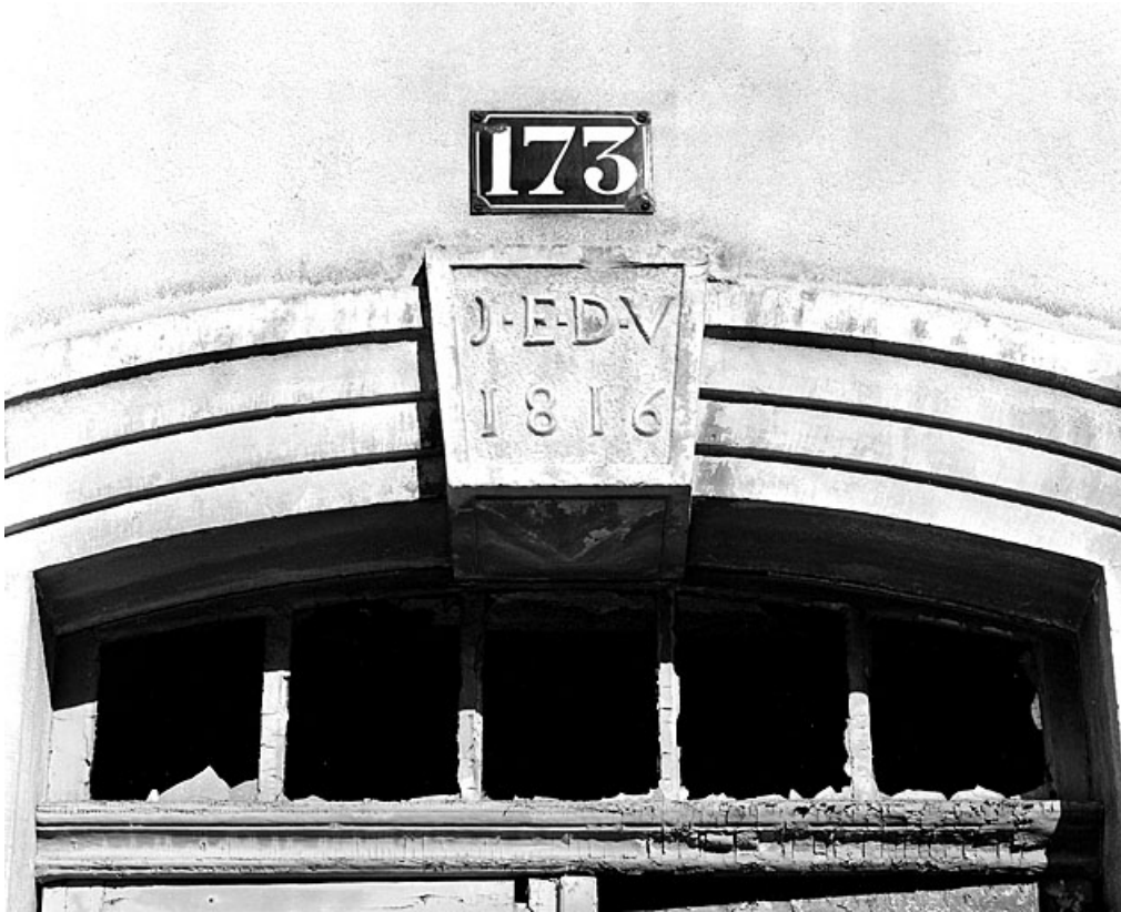
Entrée principale : date et initiales.