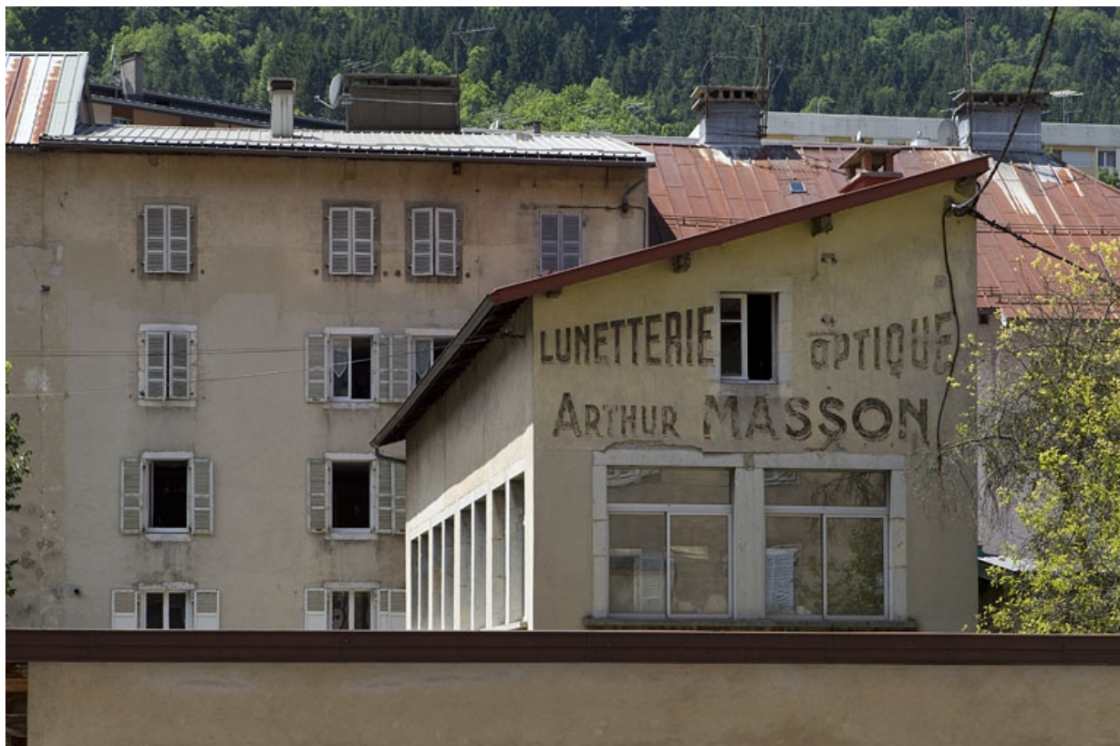
Ateliers : mur pignon oriental.