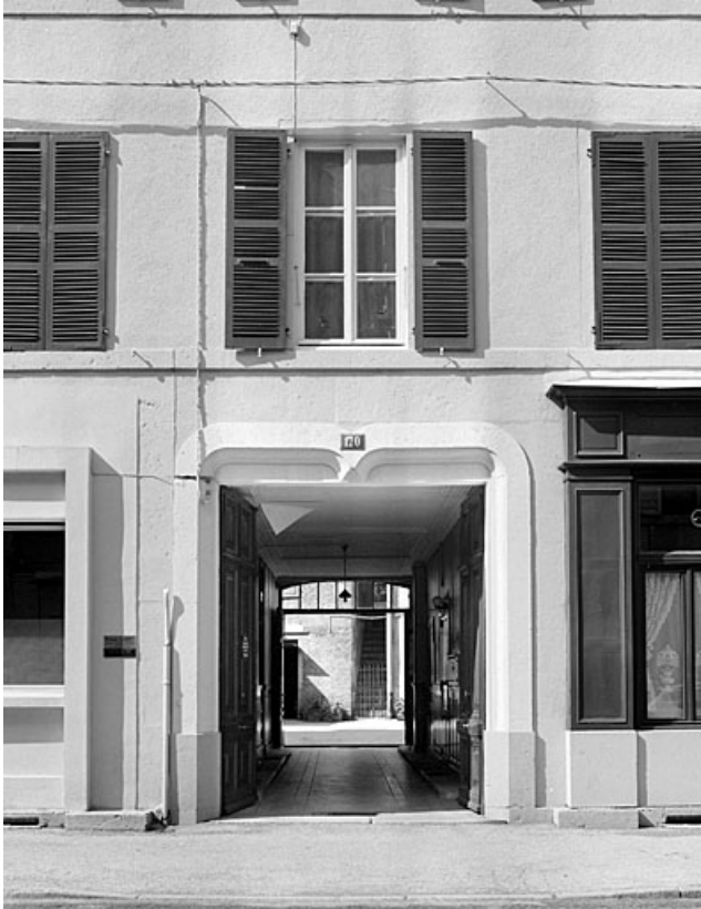
Entrée principale (passage couvert) et fenêtre du premier étage. 39, Morez, 170 rue de la République