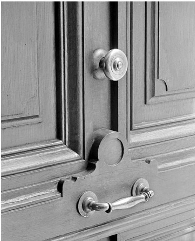
Poignées de la porte du passage couvert.