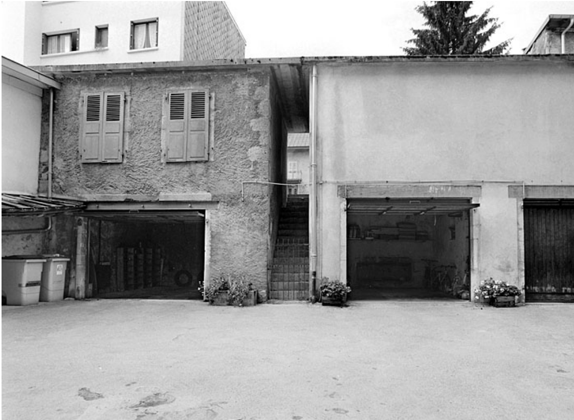
Elévation antérieure des garages.