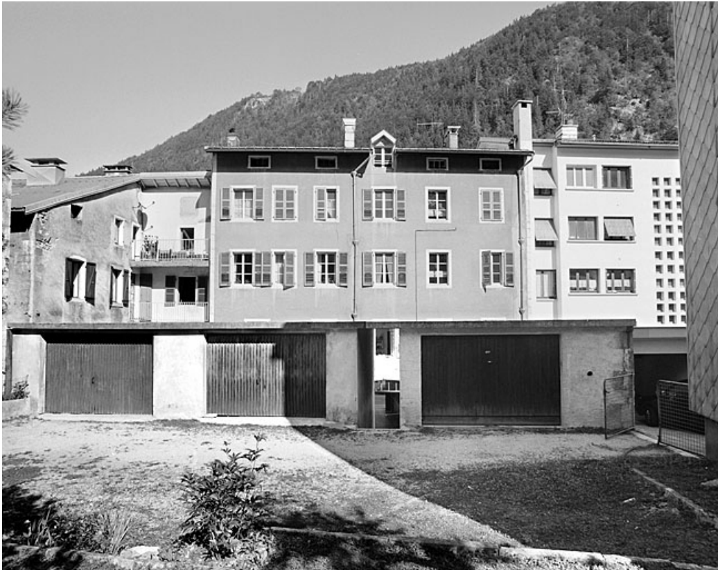
Elévation postérieure et garages.