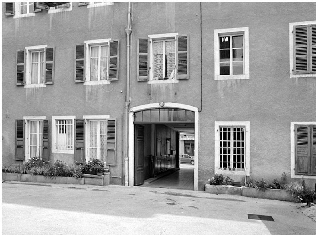
Rez-de-chaussée et premier étage de l'élévation postérieure.