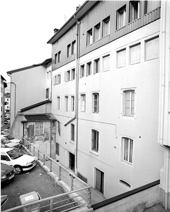
Elévation postérieure, de trois quarts droite.