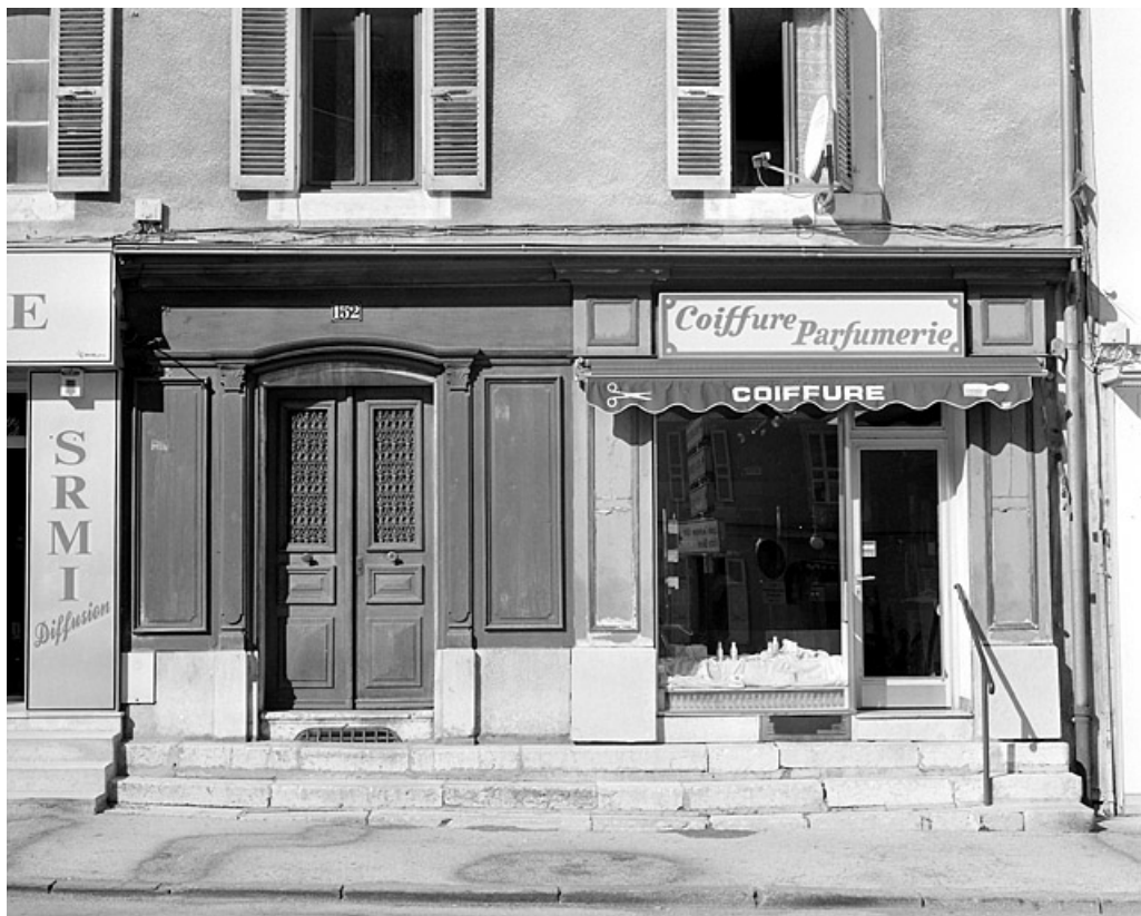
Elévation antérieure : porte principale et devanture du salon de coiffure.