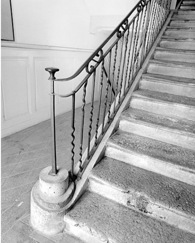
Rampe et départ d'escalier.