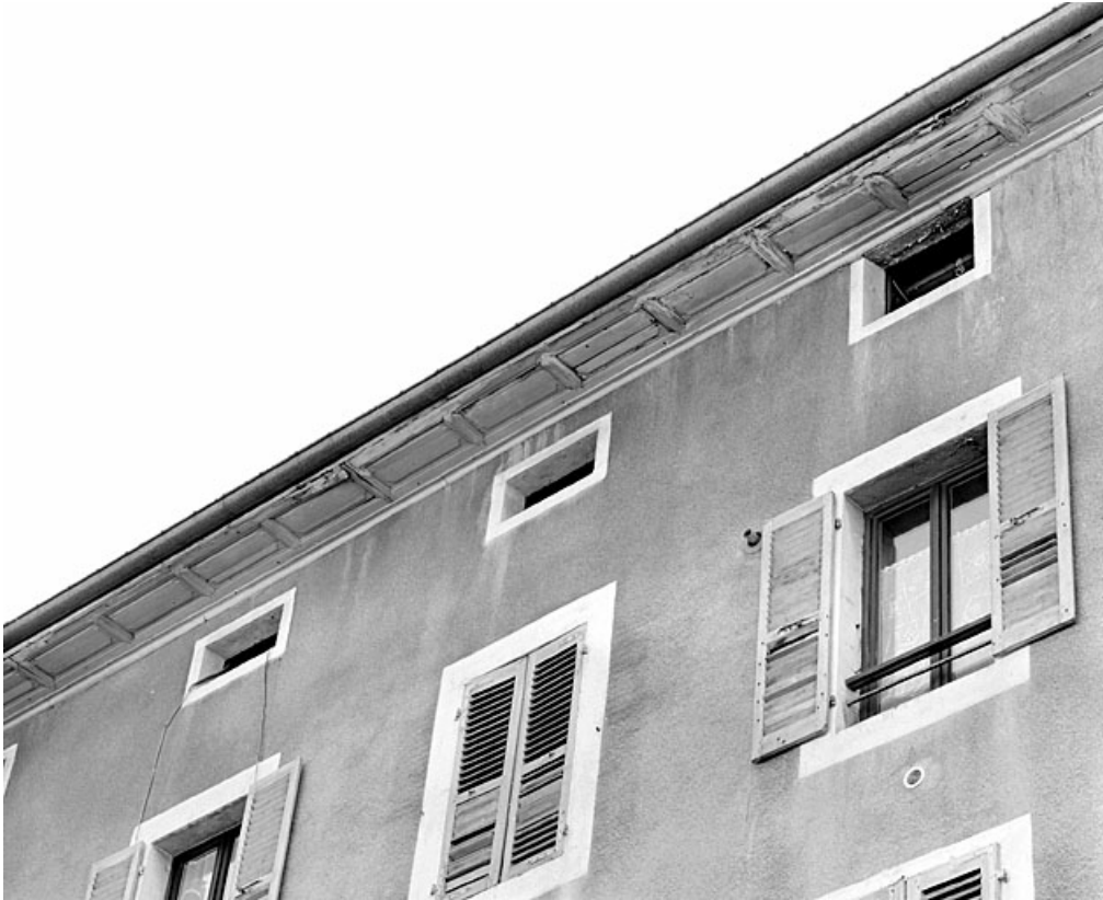
Elévation antérieure : corniche et fenêtres du comble à surcroît.