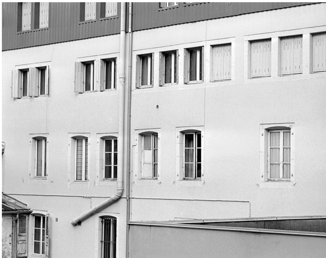
Elévation postérieure : fenêtres à linteau délardé en arc segmentaire du premier étage et fenêtres lunetières du deuxième. 39, Morez, 152 rue de la République