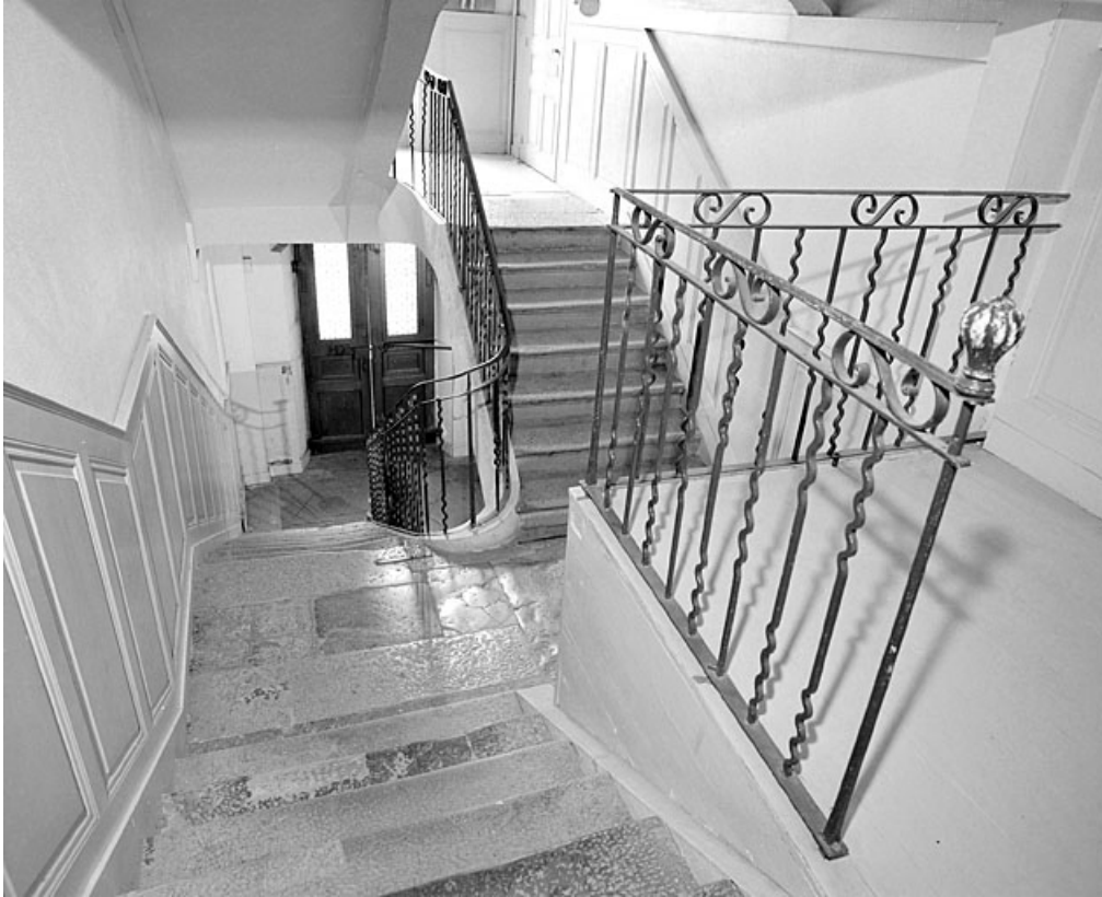
Escalier vu en plongée depuis le premier palier.