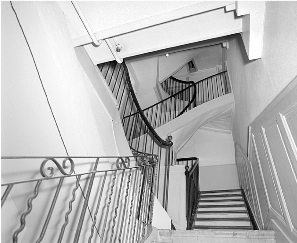
Escalier vu en contre-plongée vers le troisième étage.