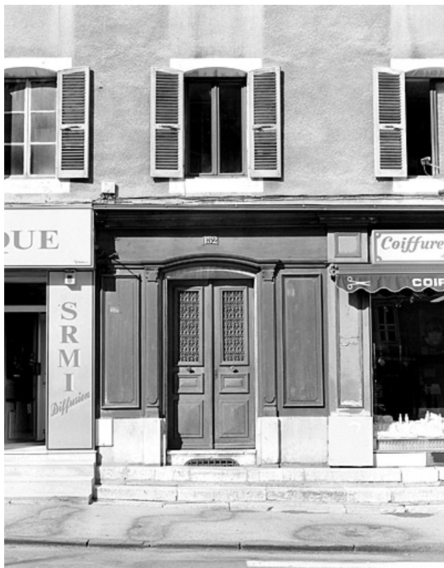
Elévation antérieure : porte principale et fenêtre du premier étage. Ces baies ont un linteau délardé en arc segmentaire. 39, Morez, 152 rue de la République