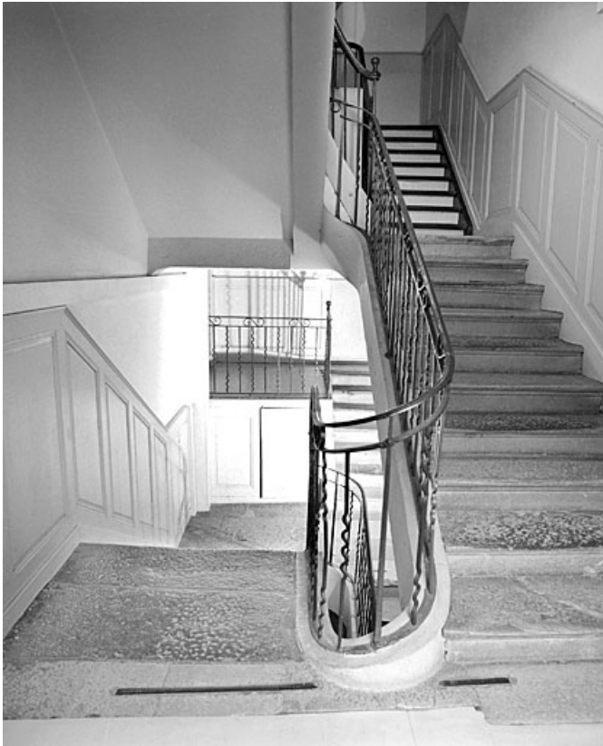
Escalier au deuxième étage.