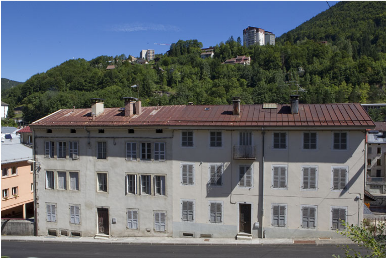
Façade antérieure. Le n° 5 rue Pasteur est à droite (et le n° 3 à gauche).