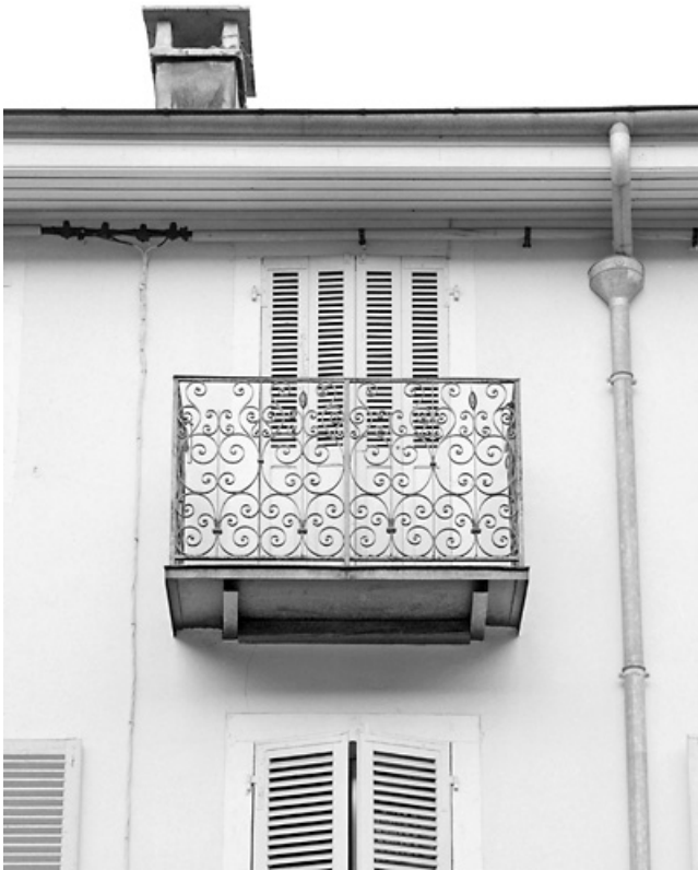
Façade antérieure : balcon du deuxième étage.