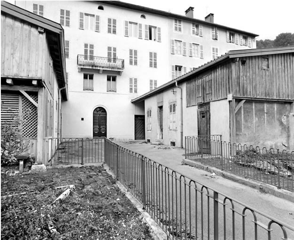
Jardin, cour et bâtiment nord.