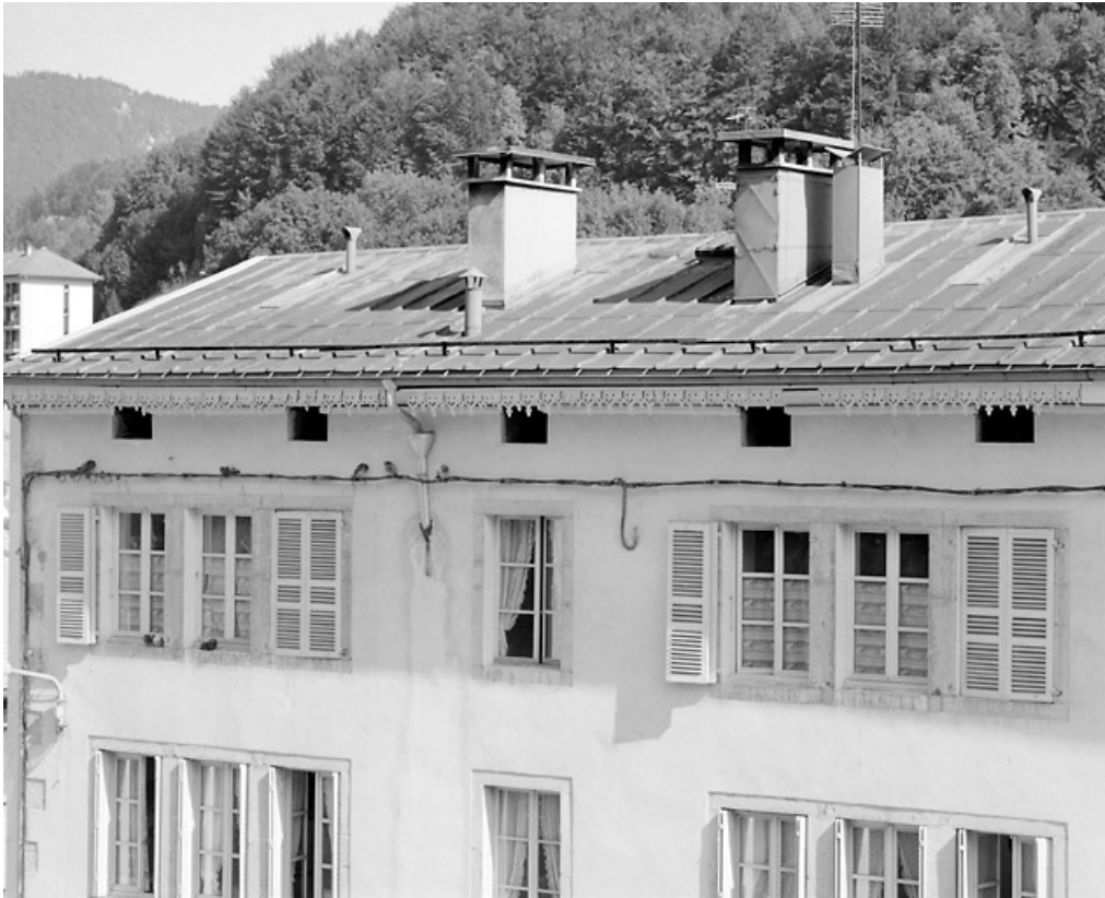
Façade antérieure : fenêtres jumelées aux étages.