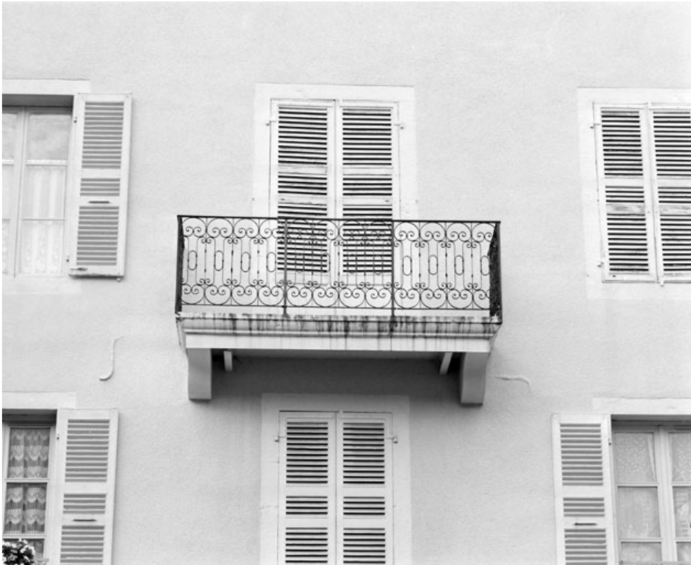
Façade postérieure : balcon. Correspond au rez-de-chaussée sur la rue Pasteur. 39, Morez, 3 rue Pasteur