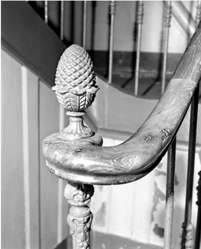
Rampe d'escalier : motif en forme de pomme de pin.