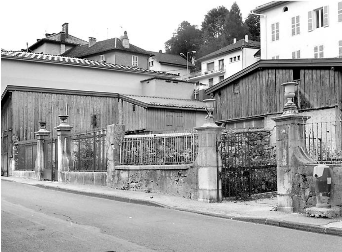
Clôture sur le quai Jobez.