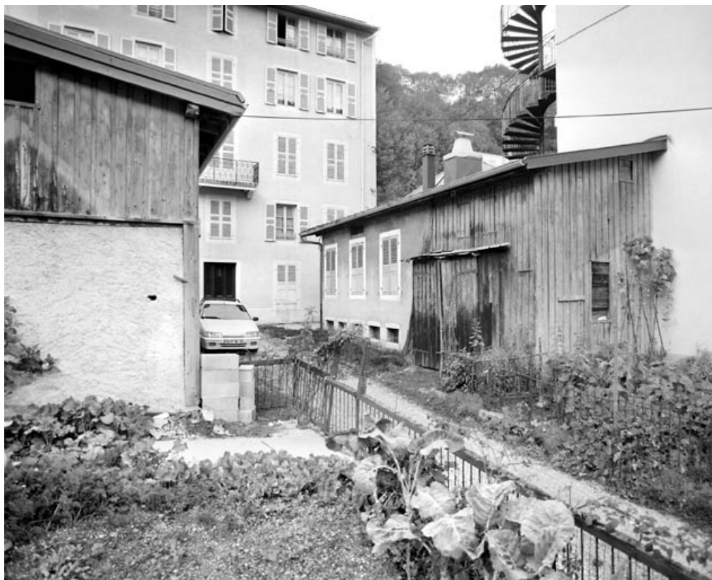
Bâtiment nord : logement.