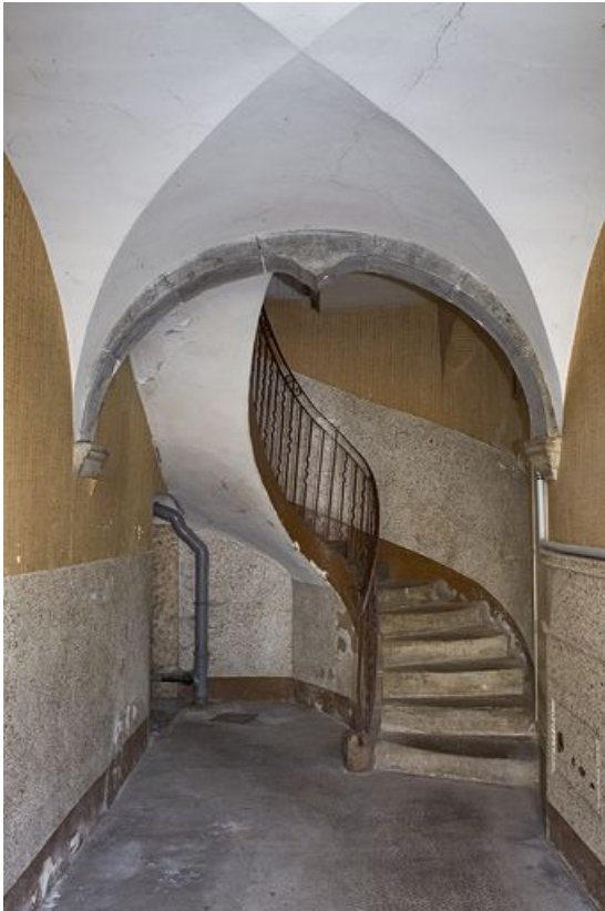
Couloir voûté et escalier.