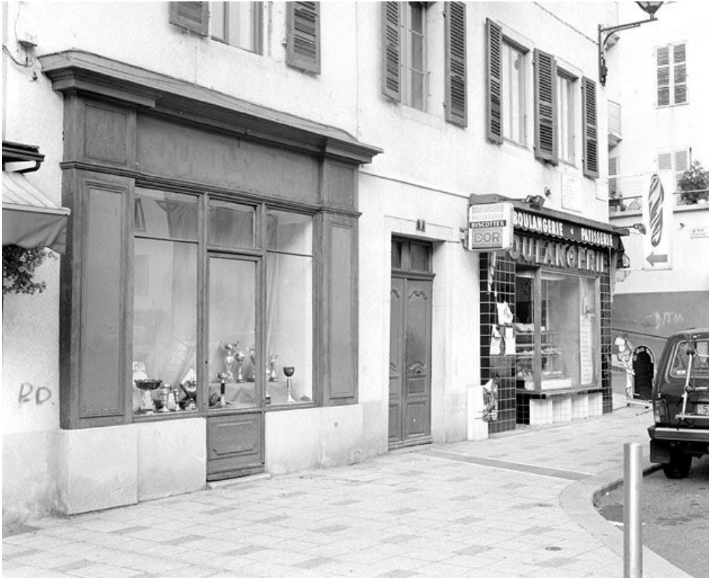
Rez-de-chaussée de l'élévation antérieure.