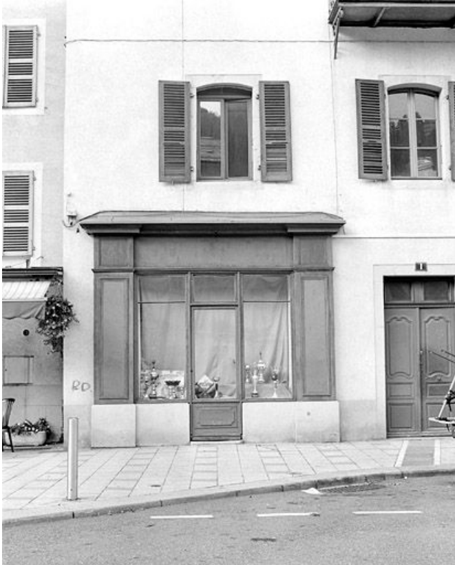
Devanture de boutique et fenêtre en arc segmentaire.