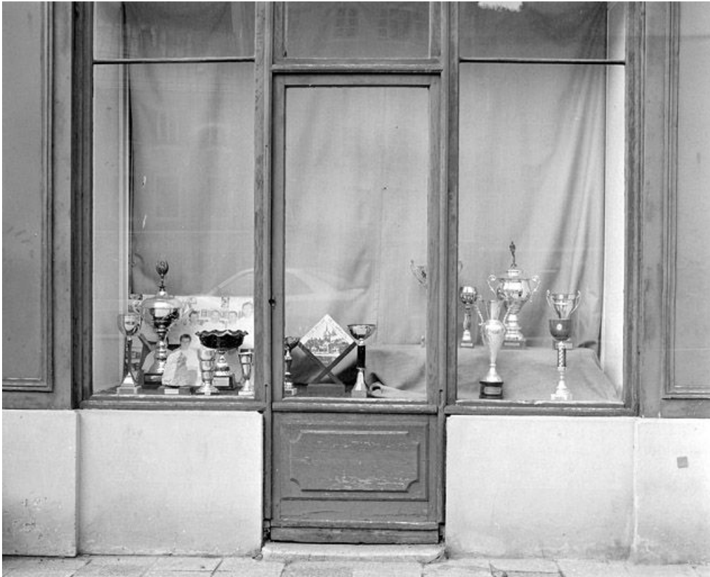
Devanture de boutique.