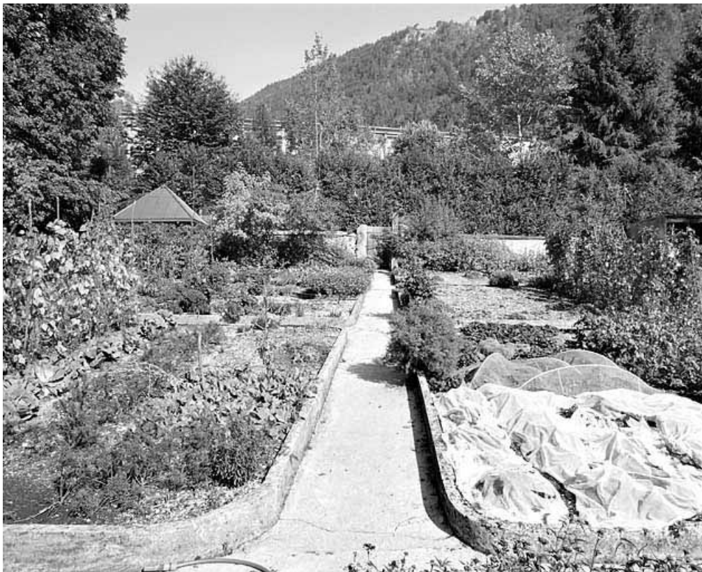
Vue d'ensemble du jardin, depuis l'ouest.