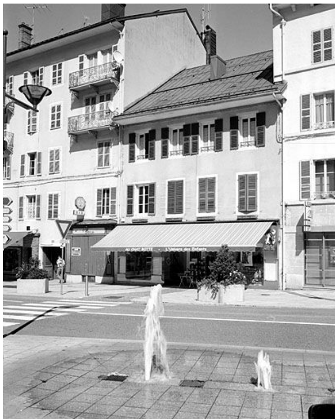
Vue d'ensemble, de trois quarts droite.