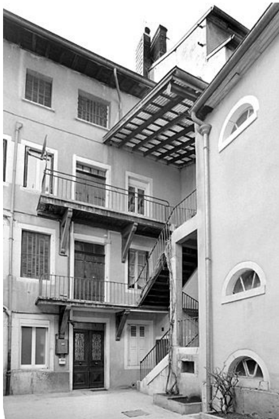
Façade postérieure et escalier.