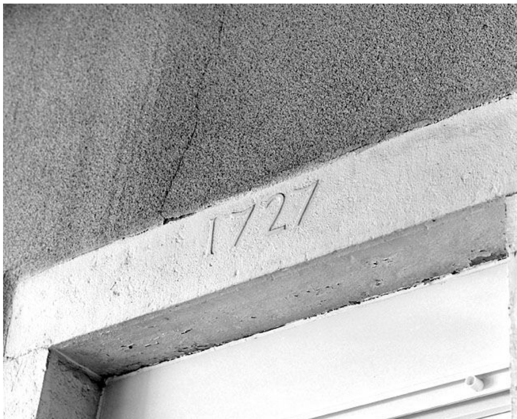
Date portée sur le linteau d'une fenêtre du second étage.