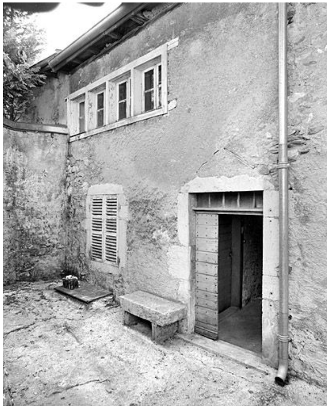
Façade postérieure du bâtiment oriental.