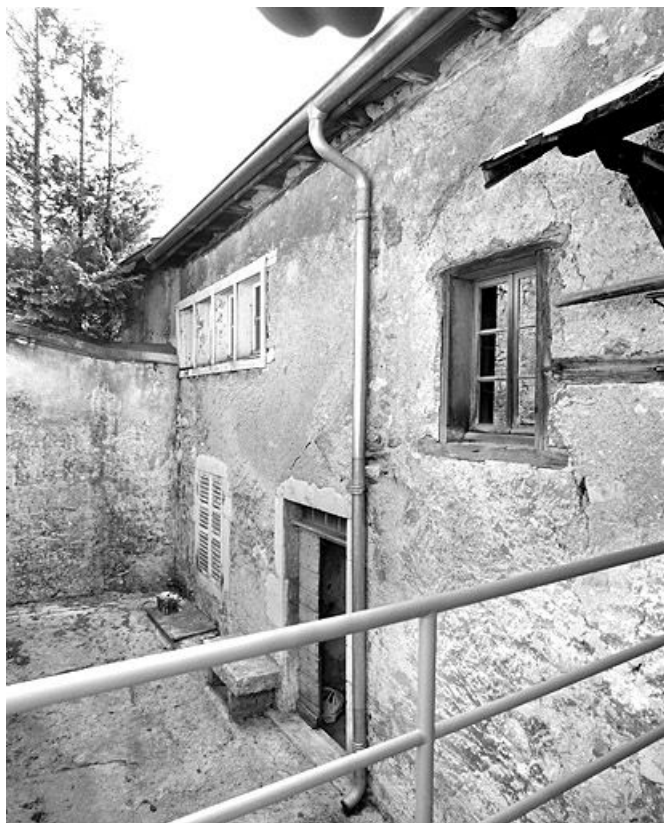
Façade postérieure du bâtiment oriental, vue en enfilade.