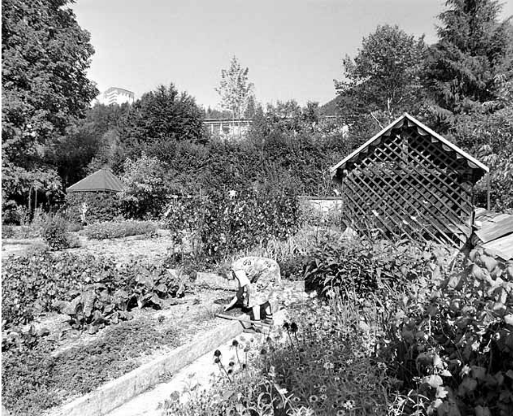
Jardin et fabrique de treillage.