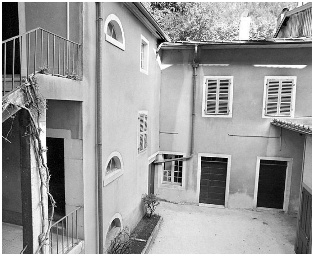
Aile nord et bâtiment oriental.