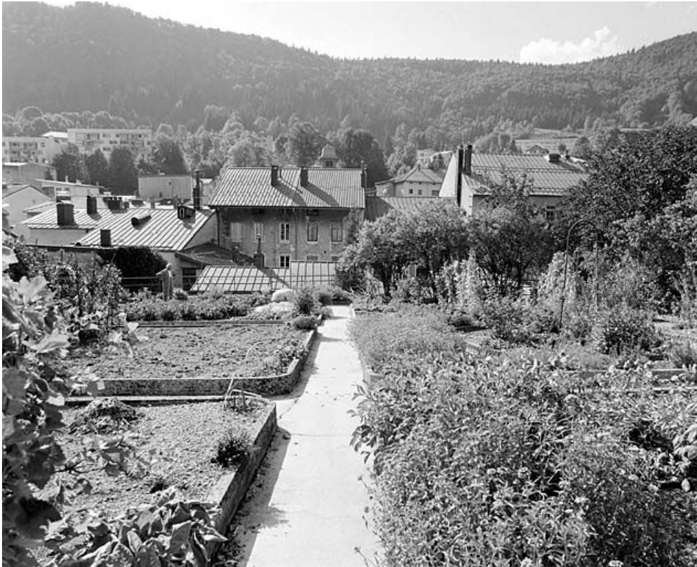
Vue d'ensemble du jardin, depuis l'est. La maison, au centre, est moins élevée que les deux bâtiments qui l'encadrent. 39, Morez, 163 rue de la République