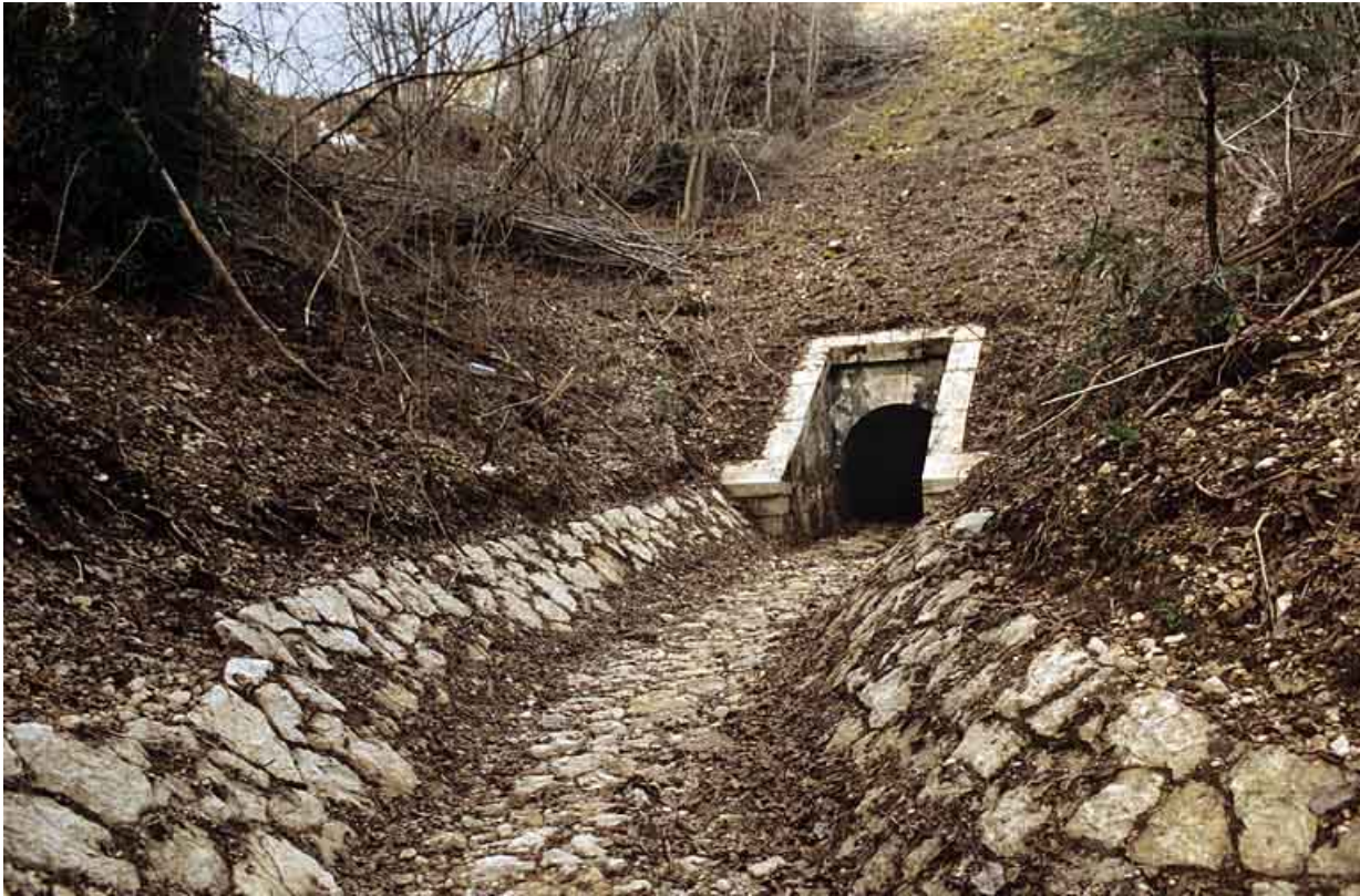
Aqueduc : tête aval et rigole (cadrage horizontal).

39, Lavancia-Epercy, lieudit : la Brasselette