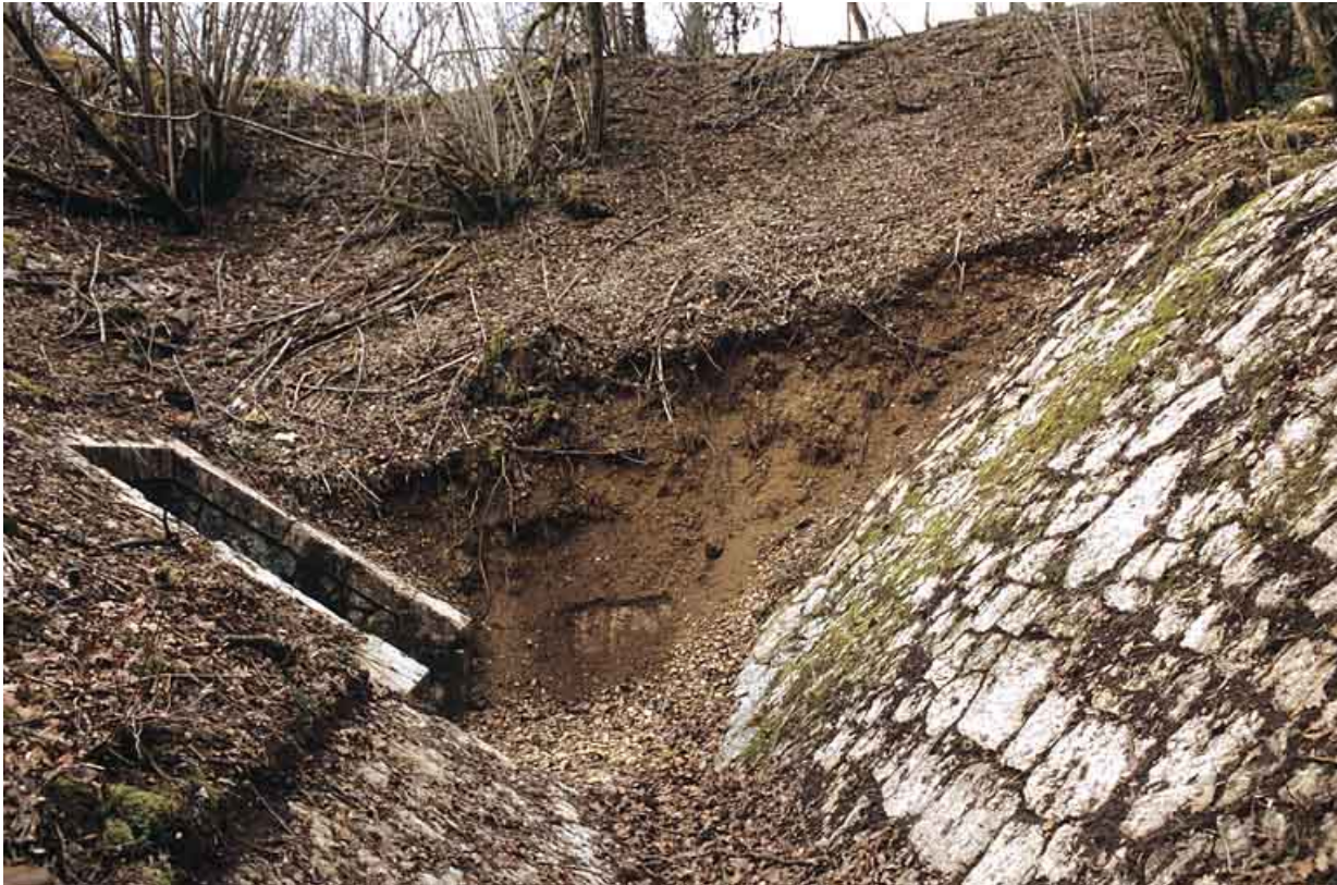
Aqueduc : " canal " et tête amont.

39, Lavancia-Epercy, lieudit : la Brasselette