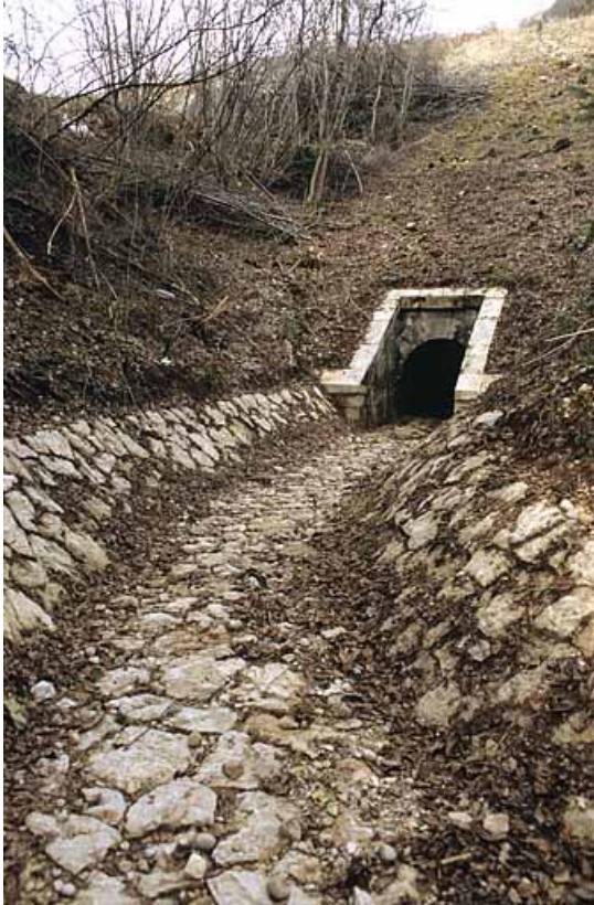
Aqueduc : tête aval (ouest) et rigole (cadrage vertical).

39, Lavancia-Epercy, lieudit : la Brasselette