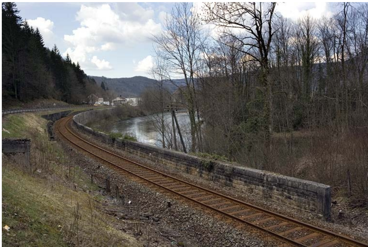
Vue d'ensemble, depuis le côté Andelot-en-Montagne.

39, Vaux-lès-Saint-Claude, lieudit : en Chambouille