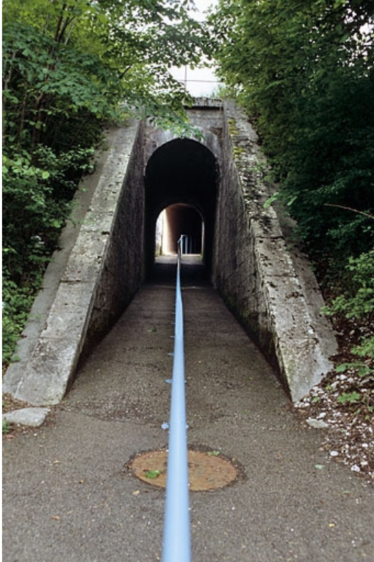
Tête aval (nord).