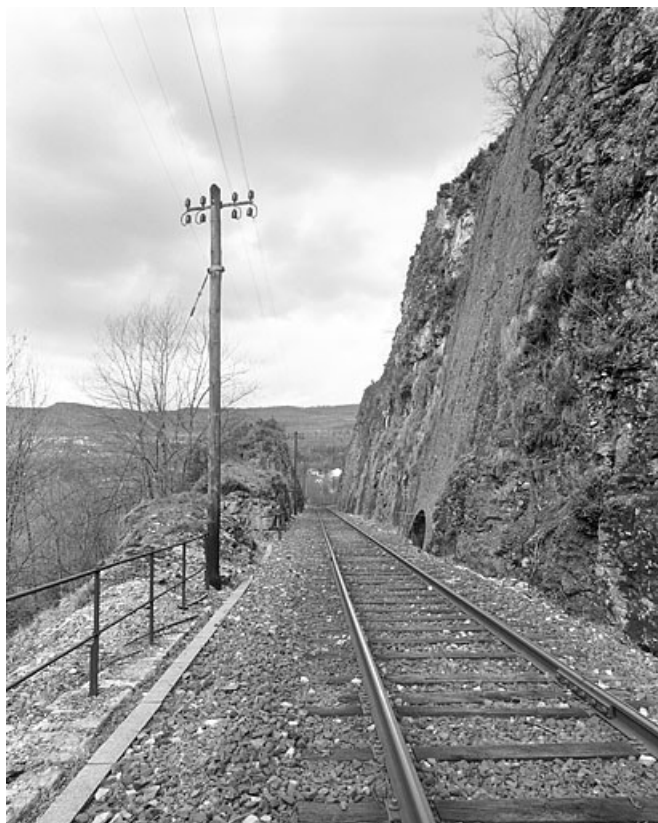
Descente d'eau du deuxième aqueduc, vue depuis le côté Andelot-en-Montagne (sud-est). 39, Saint-Claude, lieudit : vers le Moulin