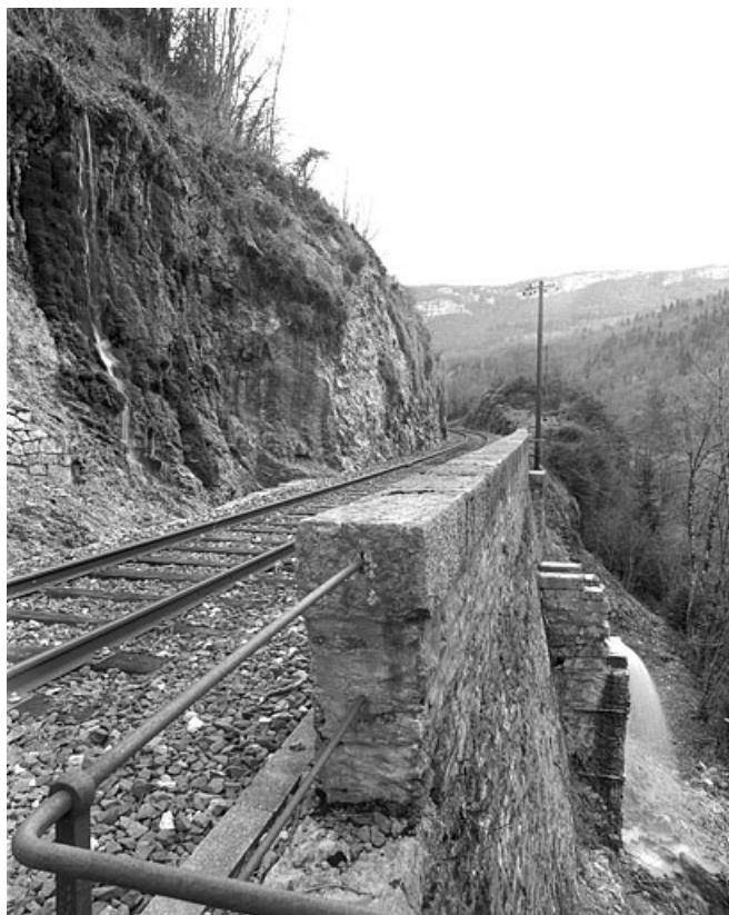
Mur et premier aqueduc, vus en enfilade depuis le côté La Cluse (ouest).

39, Saint-Claude, lieudit : vers le Moulin