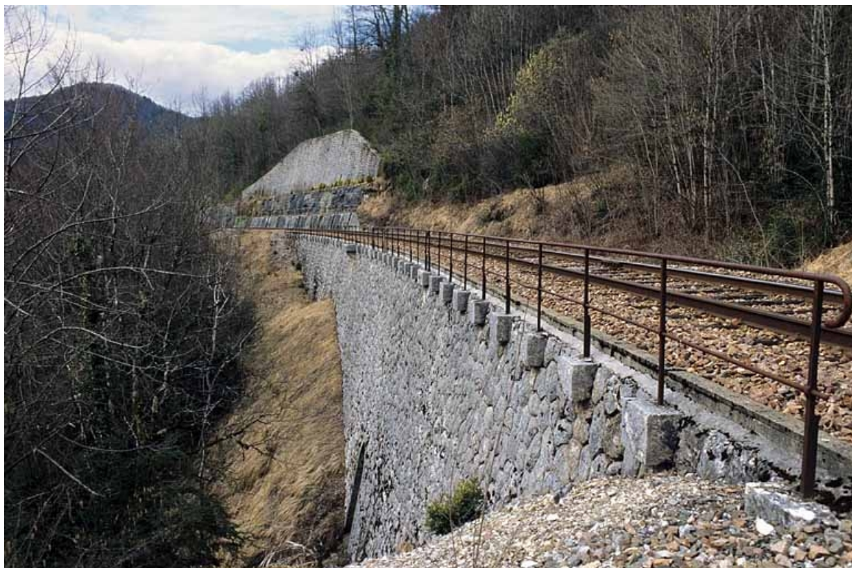
Vue d'ensemble, depuis le côté Andelot-en-Montagne (nord). Premier mur (avec aqueduc) au premier plan, deuxième mur à l'arrière-plan.