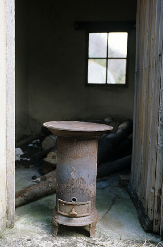
Abri ancien : intérieur et poêle de chauffage.

39, La Rixouse, lieudit : Bois Joura et Cotats