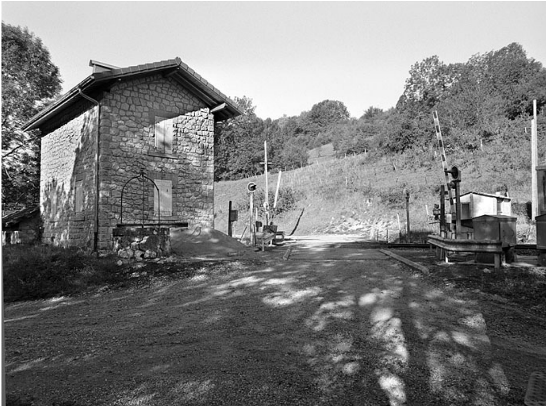
Façades postérieure et latérale gauche, puits et passage à niveau.

39, Villard-sur-Bienne chemin rural de Villard-sur-Bienne à Longchaumois, lieudit : Chavon