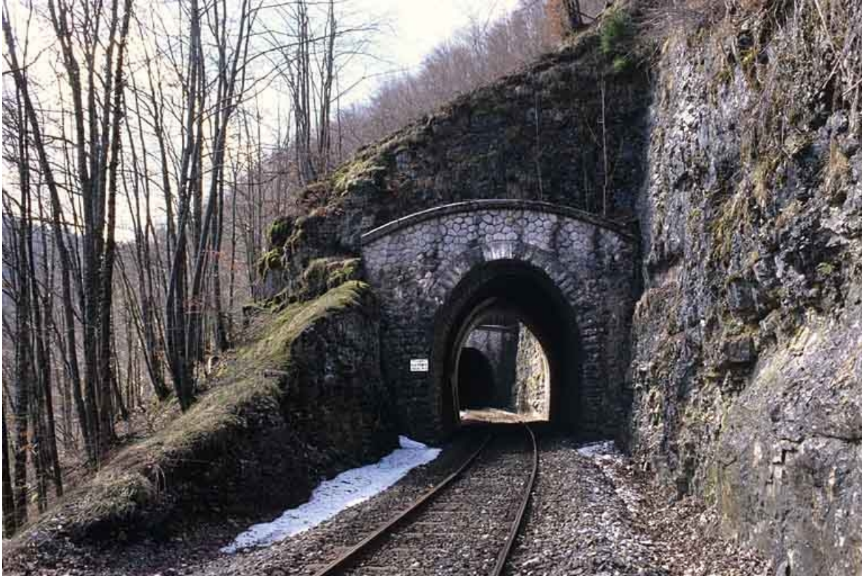
Vue d'ensemble, côté Andelot-en-Montagne (nord). Tunnel du Grépillon à l'arrière-plan.

39, Morbier, lieudit : la Doye de Bienne