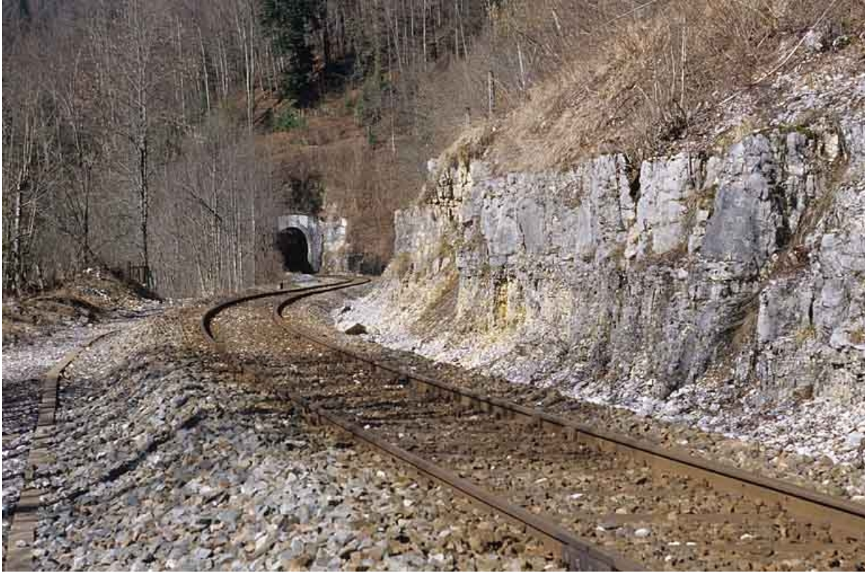
Tunnel des Bataillards : vue d'ensemble de la tête côté Andelot-en-Montagne (est).

39, Morbier, lieudit : la Doye de Bienne