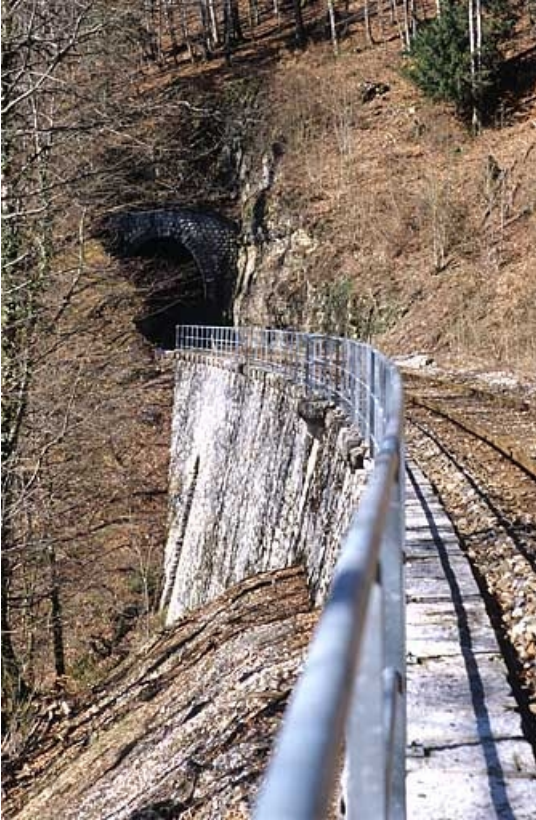
Tunnel de Lézair : tête côté Andelot-en-Montagne (nord-est). Cette tête est précédée par un mur de soutènement à gauche de la voie.

39, Morbier, lieudit : la Doye de Bienne