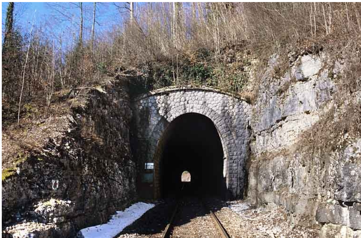
Tunnel des Bataillards : tête côté Andelot-en-Montagne (est). 39, Morbier, lieudit : la Doye de Bienne