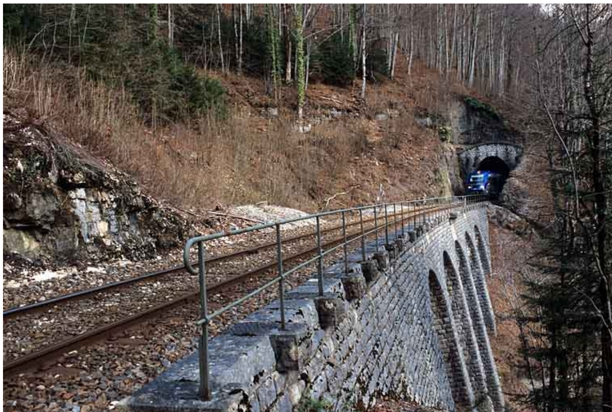
Tunnel de Lézair : tête côté La Cluse (sud-ouest), avec autorail X 73500. Cette tête est suivie d'un mur de soutènement à arcades à gauche de la voie.

39, Morbier, lieudit : la Doye de Bienne