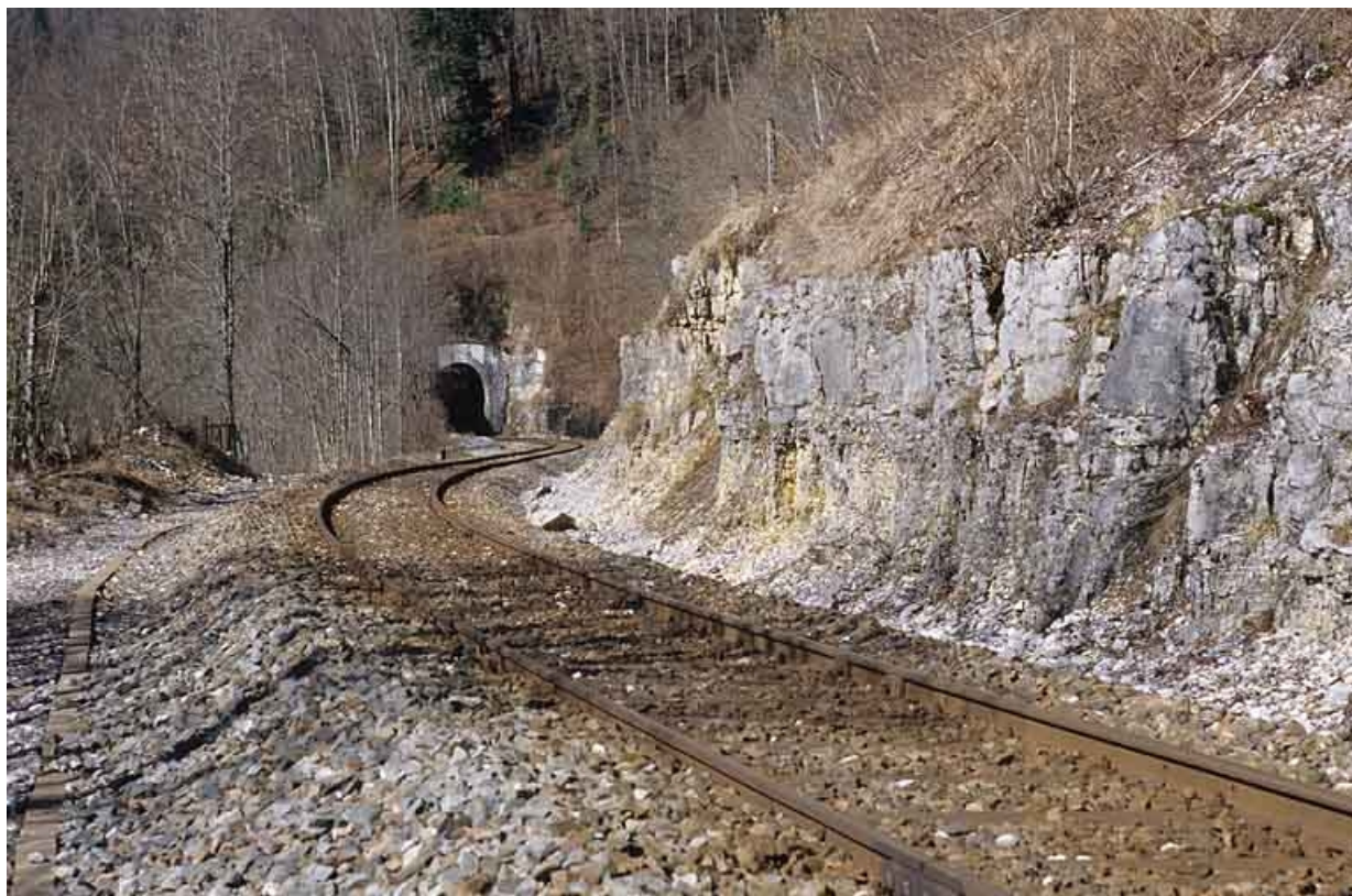
Tunnel des Bataillards : vue d'ensemble de la tête côté Andelot-en-Montagne (est).

39, Morbier, lieudit : la Doye de Bienne