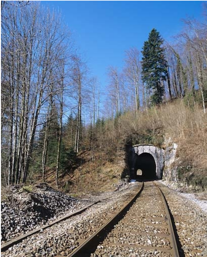
Tunnel des Bataillards : vue d'ensemble rapprochée de la tête côté Andelot-en-Montagne (est). 39, Morbier, lieudit : la Doye de Bienne