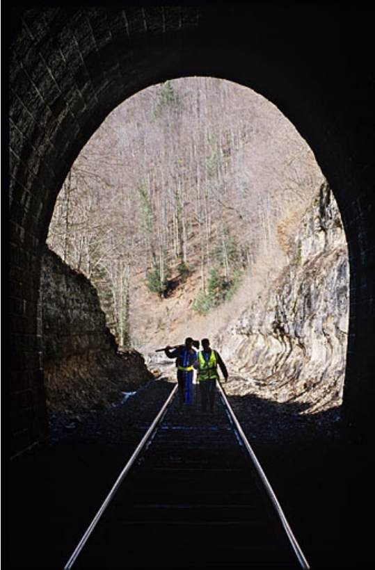
Tunnel des Bataillards : tête côté La Cluse (ouest), depuis l'intérieur.

39, Morbier, lieudit : la Doye de Bienne