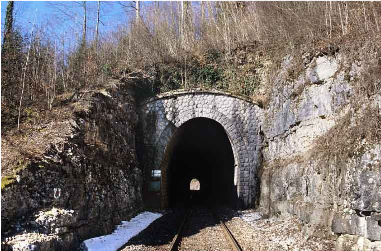
Tunnel des Bataillards : tête côté Andelot-en-Montagne (est).

39, Morbier, lieudit : la Doye de Bienne