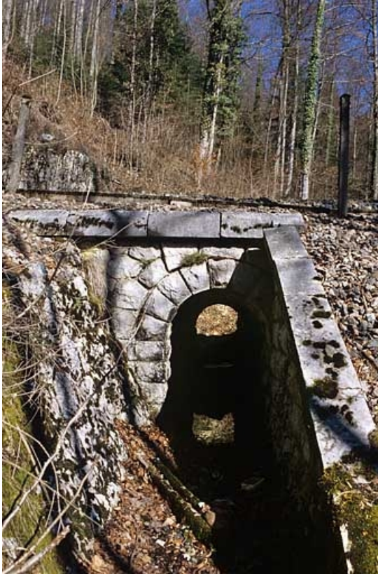
Vue d'ensemble, depuis l'aval (sud).