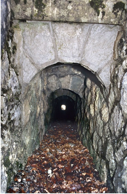
Voûte appareillée en rouleaux à ressauts, vue depuis l'amont (nord). 39, Morbier, lieudit : la Doye Gabet