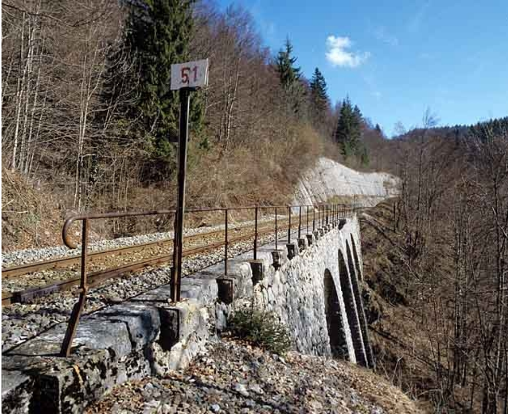
Vue d'ensemble en enfilade, depuis le sud-ouest.