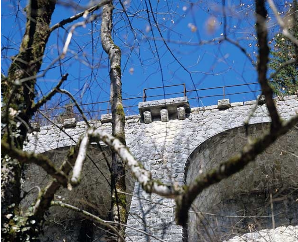
Pile centrale et refuge, vus en contre-plongée.