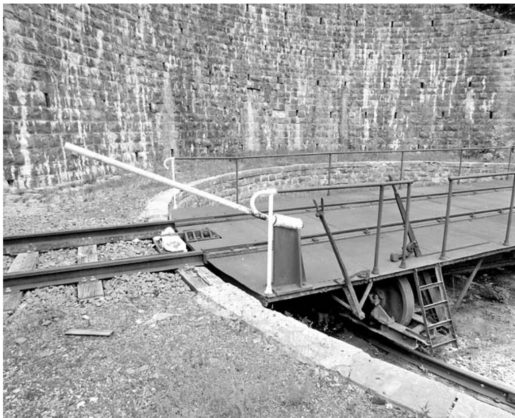
Barre permettant de faire pivoter le pont. 39, Morez, 15, 17 avenue Charles de Gaulle