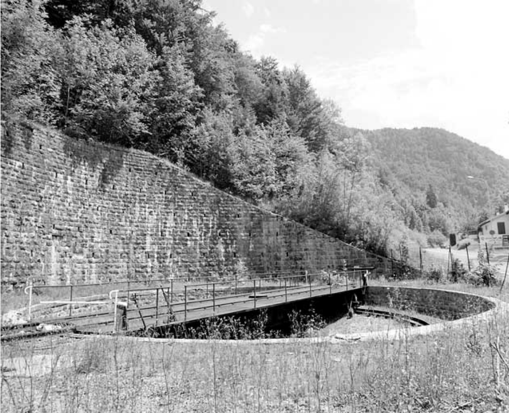
Tablier, fosse et chemin de roulement, depuis l'ouest.

39, Morez, 15, 17 avenue Charles de Gaulle