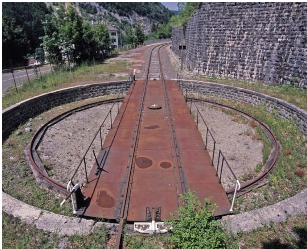
Tablier, fosse et chemin de roulement.

39, Morez, 15, 17 avenue Charles de Gaulle