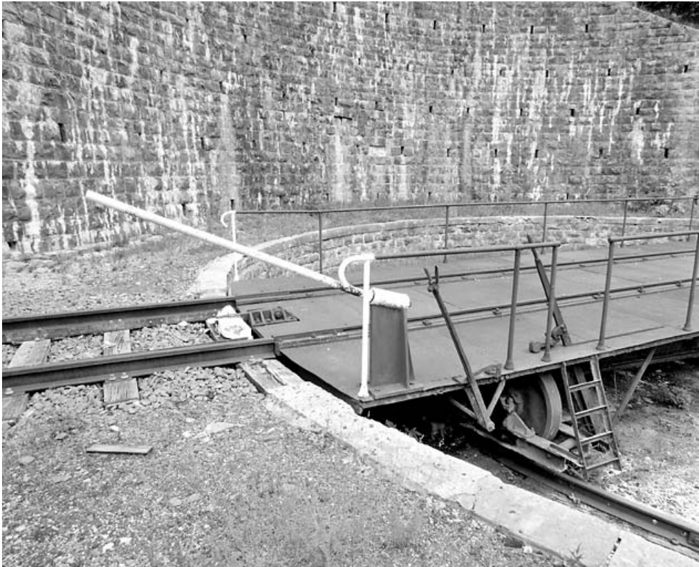
Barre permettant de faire pivoter le pont. 39, Morez, 15, 17 avenue Charles de Gaulle