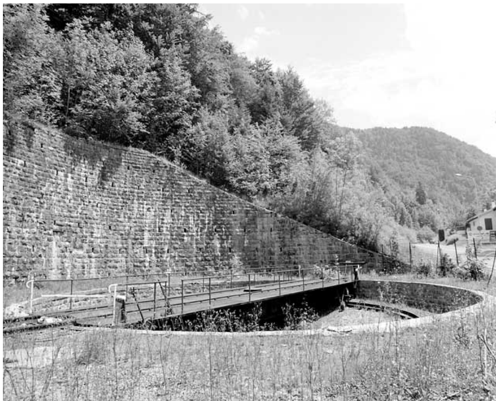
Tablier, fosse et chemin de roulement, depuis l'ouest.

39, Morez, 15, 17 avenue Charles de Gaulle