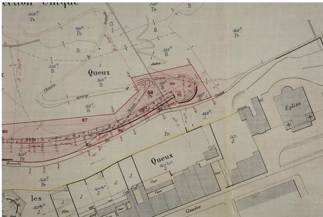
Plan parcellaire des terrains à acquérir dans la traversée de la commune de Morez sur une longueur de 1323,50 m [détail du pont tournant], 1894.

39, Morez, 15, 17 avenue Charles de Gaulle