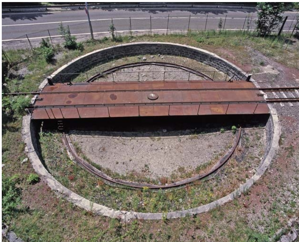
Vue d'ensemble plongeante, depuis l'est. 39, Morez, 15, 17 avenue Charles de Gaulle