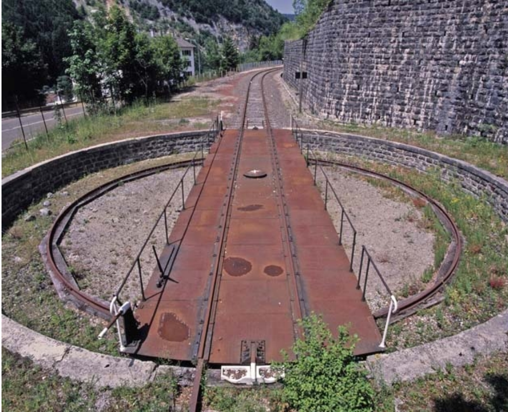
Tablier, fosse et chemin de roulement.

39, Morez, 15, 17 avenue Charles de Gaulle