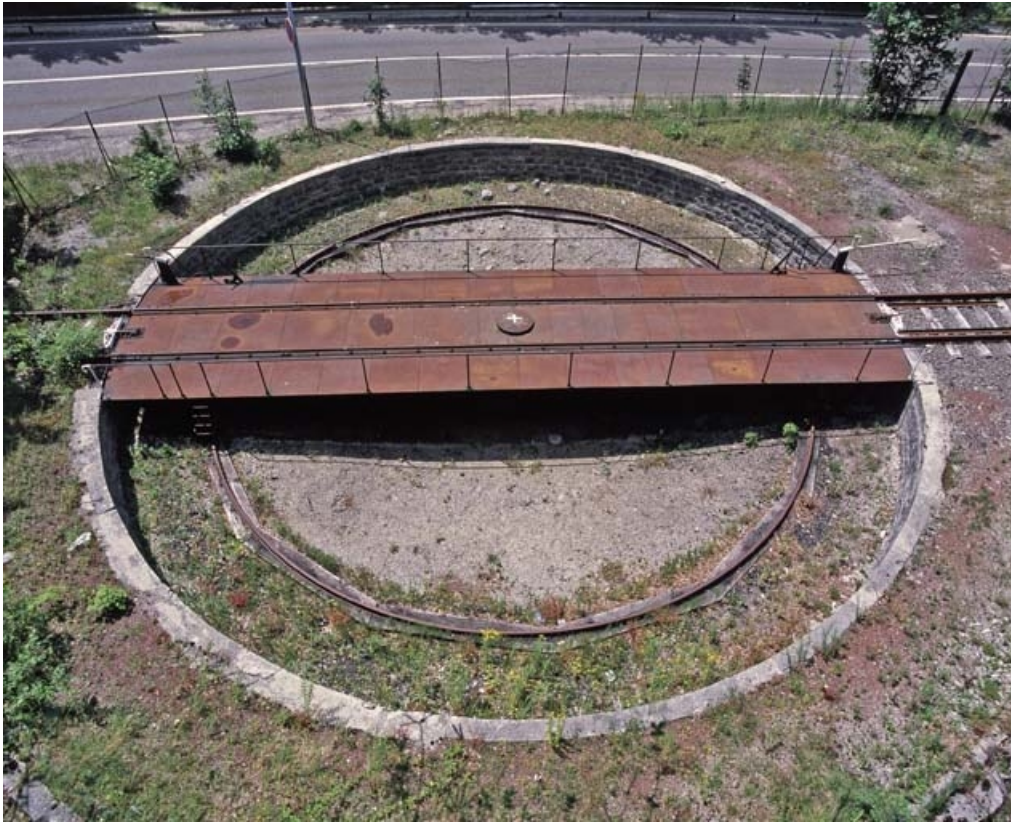
Vue d'ensemble plongeante, depuis l'est.

39, Morez, 15, 17 avenue Charles de Gaulle