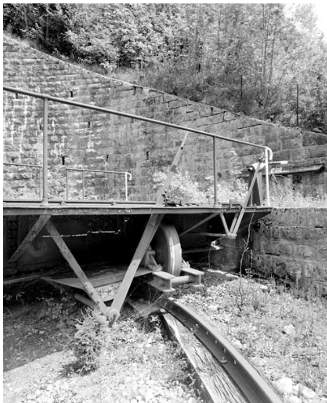
Système de roulement et leviers de blocage.

39, Morez, 15, 17 avenue Charles de Gaulle