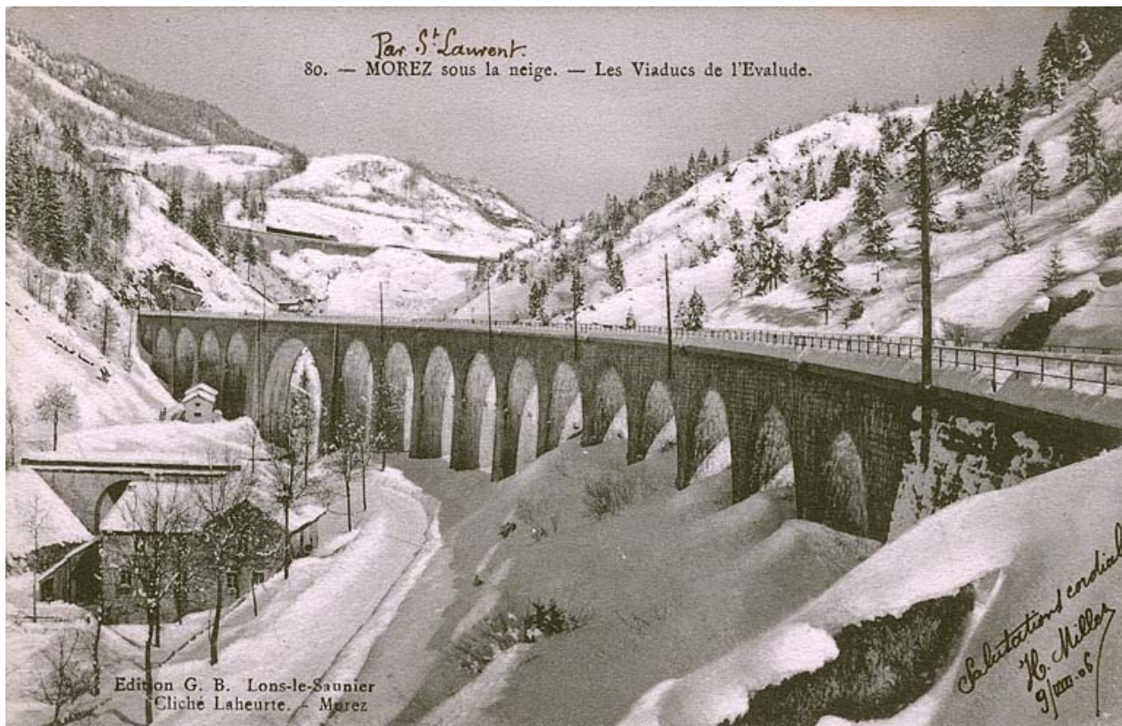
Morez sous la neige. - Les Viaducs de l'Evalude, entre 1900 et 1906.