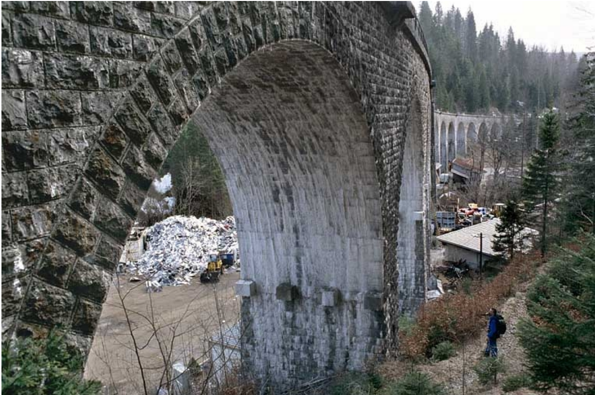
Une arche côté Andelot-en-Montagne, vue en enfilade.