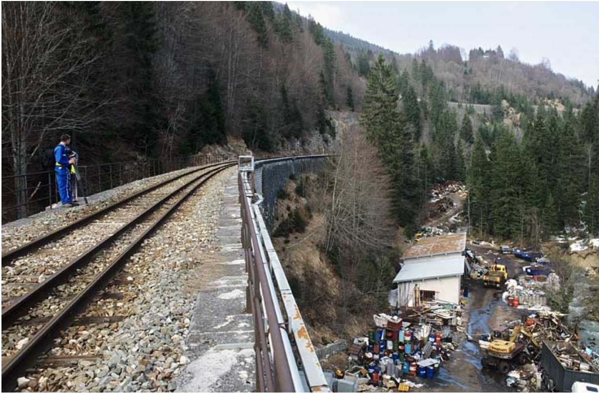
Extrémité côté Andelot-en-Montagne, vue depuis la voie au sud (côté La Cluse).