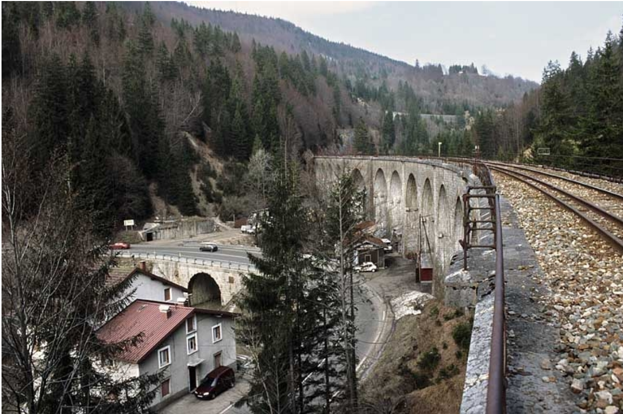
Elévation occidentale vue en enfilade, depuis le sud-ouest (côté La Cluse).