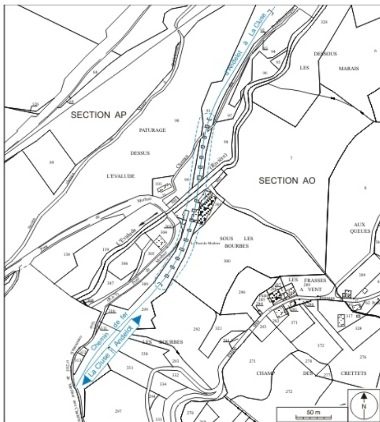
Plan-masse et de situation. Extrait du plan cadastral informatisé, 2006, sections AO et AP, échelle 1:3000. 39, Morbier, lieudit : sous les Bourbes