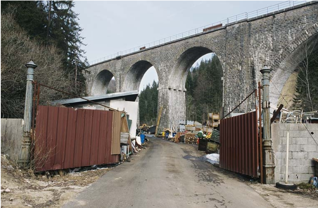
Elévation occidentale (extrémité côté Andelot-en-Montagne), depuis l'ouest.