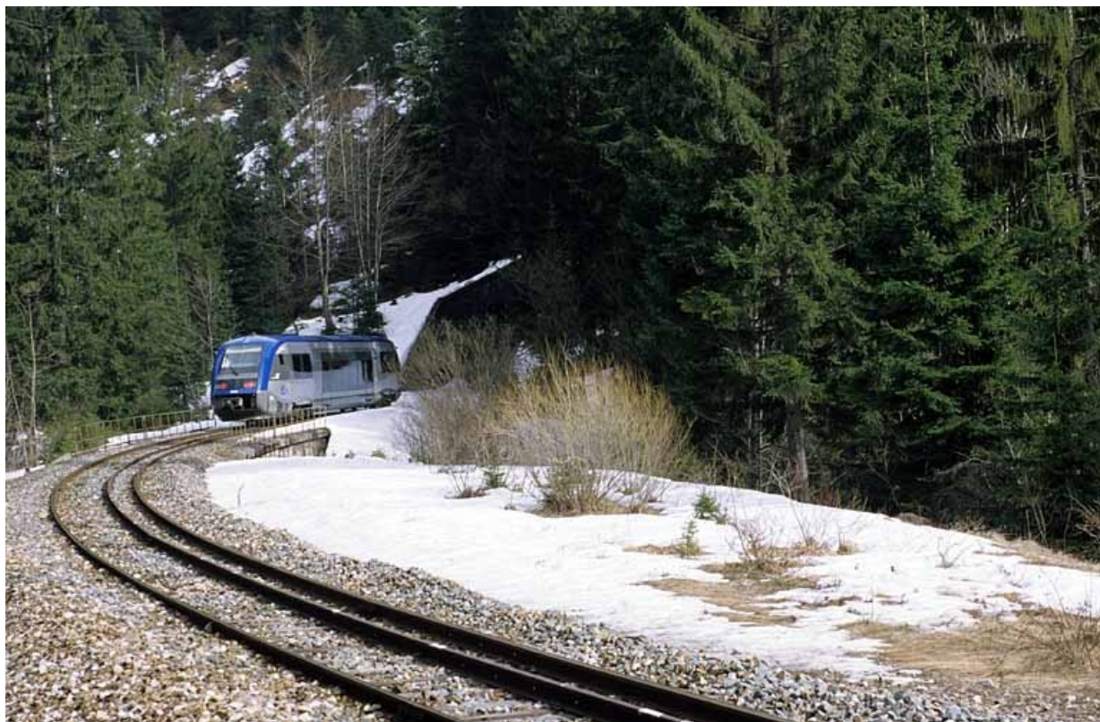
Vue d'ensemble de la voie vers la tête côté Andelot-en-Montagne, avec autorail X 73500.