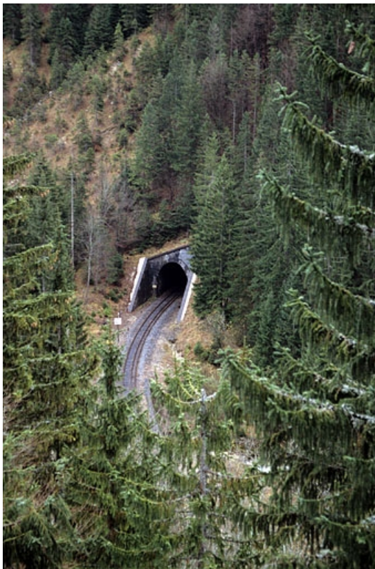
Vue d'ensemble plongeante sur la tête côté La Cluse.