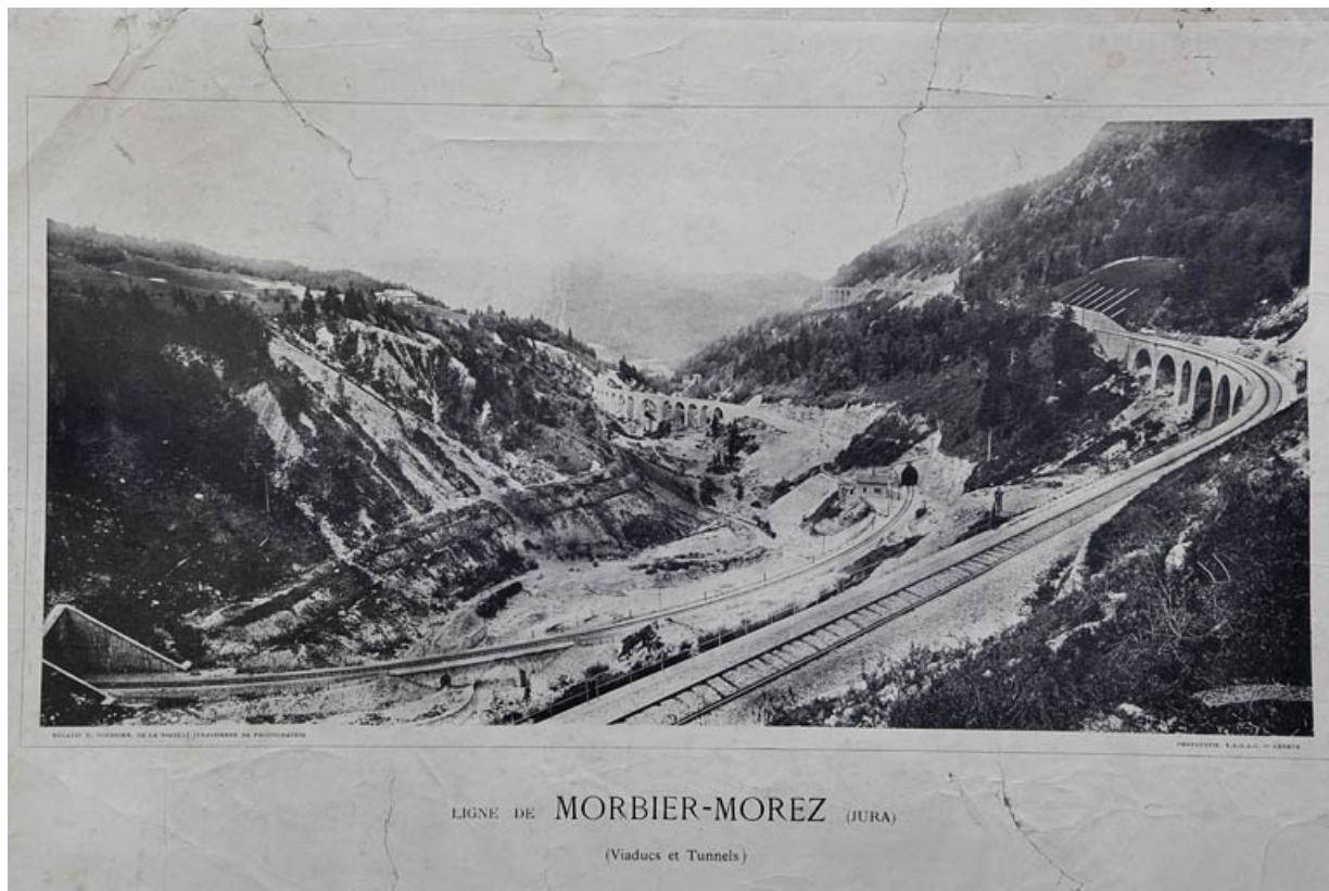
Ligne de Morbier - Morez (Jura). (Viaducs et Tunnels) [tête aval, côté La Cluse], 1er quart 20e siècle. 39, Morbier, lieudit : les Frasses