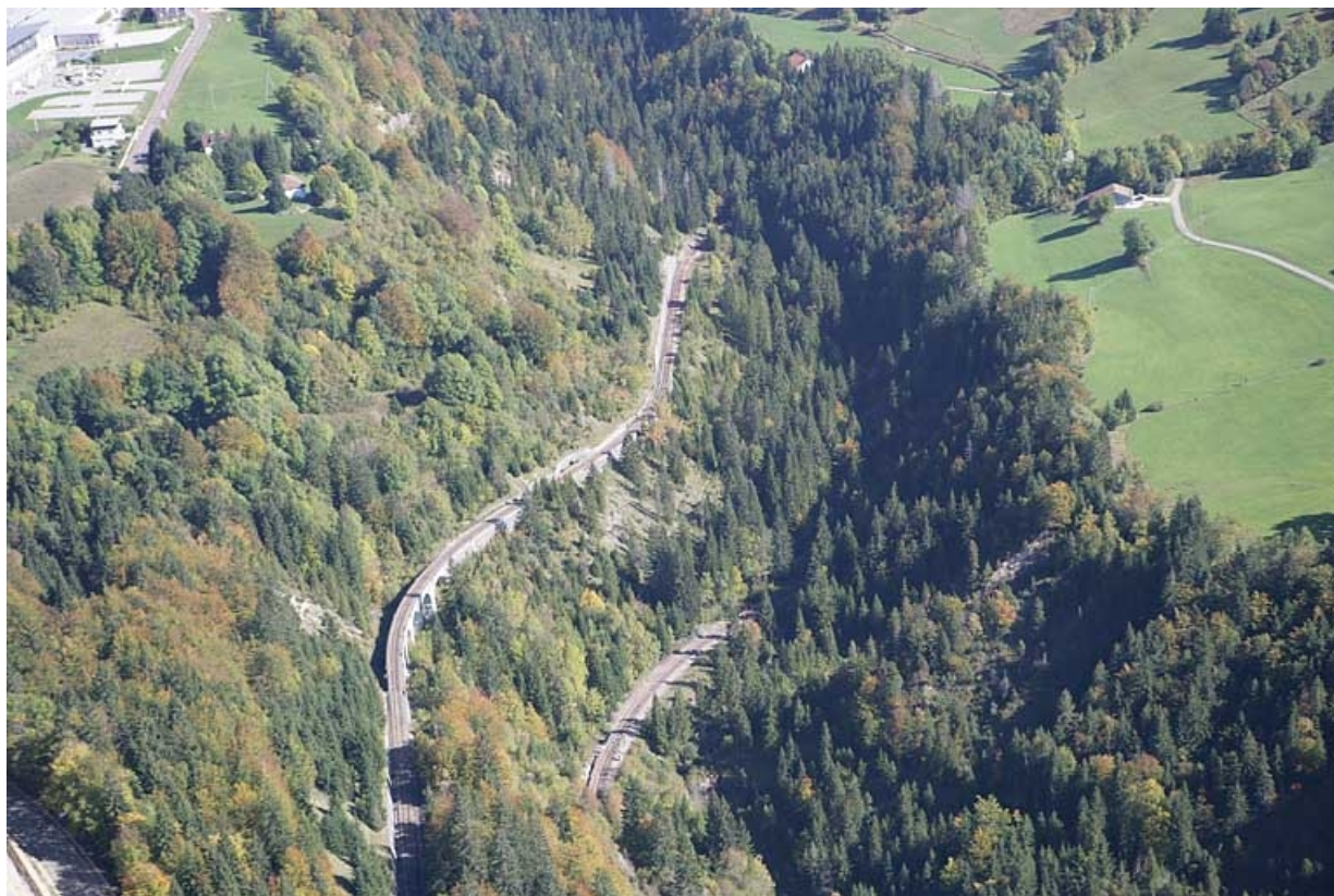
Vue aérienne de la vallée et des accès au tunnel, depuis le sud-ouest.