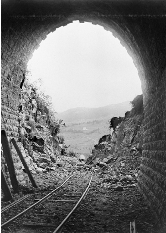
La sortie du tunnel de la Roche à la Dame, 1898.

39, Morbier, lieudit : le Bois des Crottes