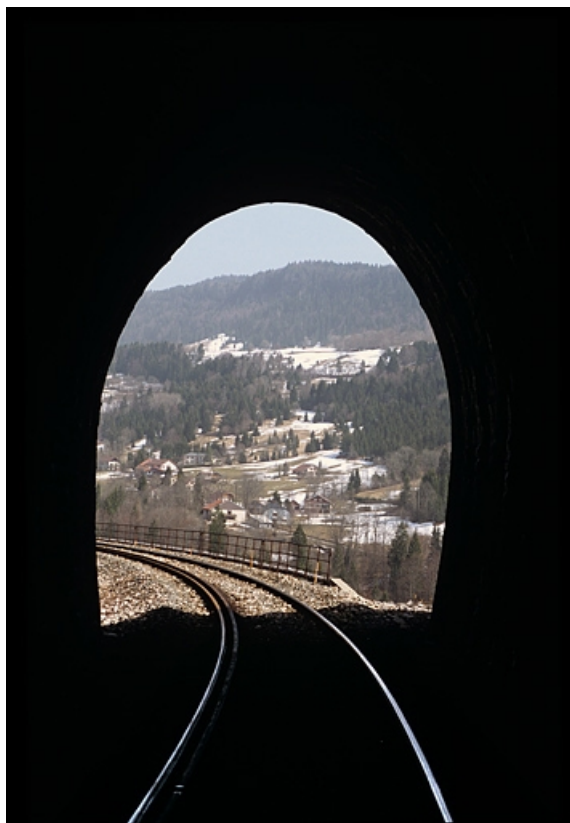
Tête côté La Cluse, depuis l'intérieur.

39, Morbier, lieudit : le Bois des Crottes