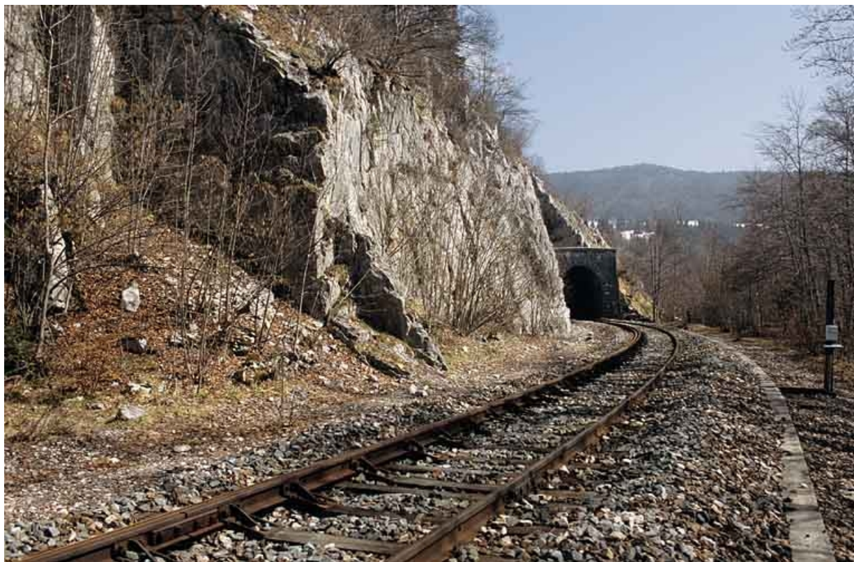
Vue d'ensemble, depuis le nord-ouest (côté Andelot-en-Montagne).

39, Morbier, lieudit : le Bois des Crottes