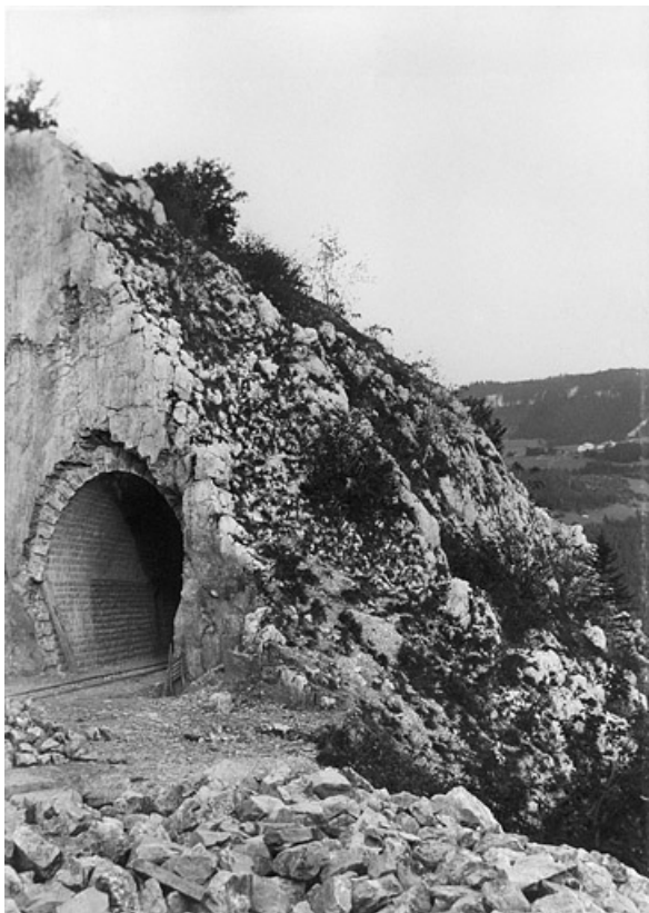
L'entrée du tunnel de la Roche à la Dame, 1898.

39, Morbier, lieudit : le Bois des Crottes