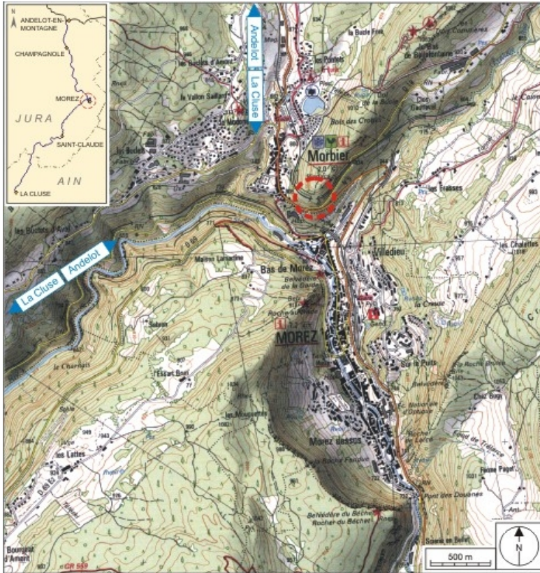
Carte et schéma de localisation. Carte topographique, IGN, 2000, dalles F087_050 et F088_050, échelle 1:25 000. Scan 25, licence n° 2008/CISE/2968.

39, Morbier, lieu-dit : le Bois des Crottes