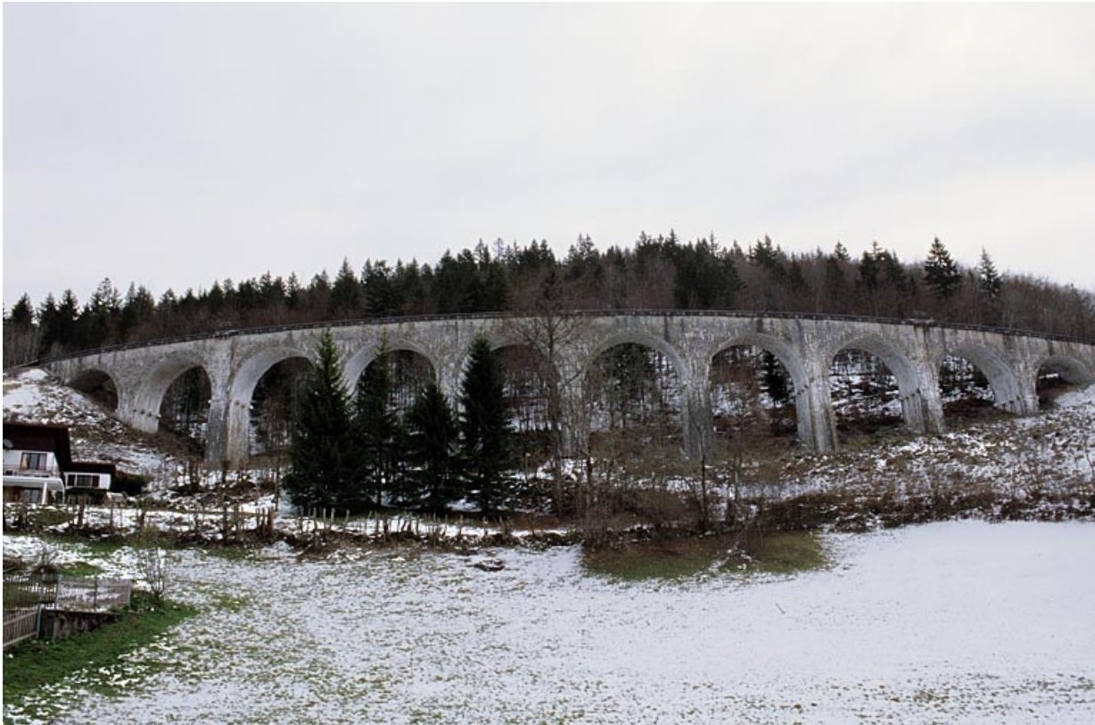
Vue d'ensemble depuis l'ouest, en hiver.

39, Morbier, lieudit : le Bois des Crottes