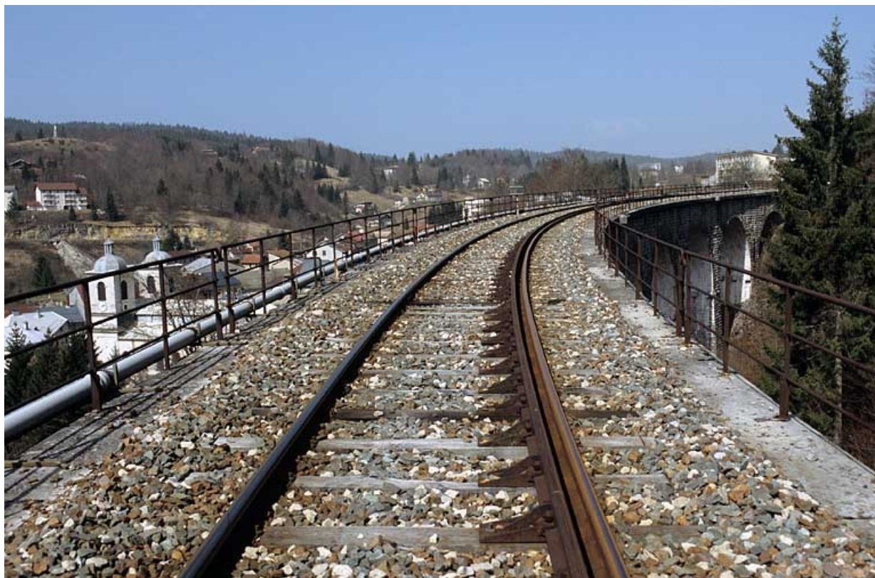
Vue d'ensemble du tablier et des garde-corps, depuis le côté La Cluse.

39, Morbier, lieudit : le Bois des Crottes