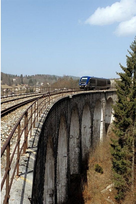
Elévation orientale vue en enfilade depuis le côté La Cluse, avec autorail X 73500. 39, Morbier, lieudit : le Bois des Crottes