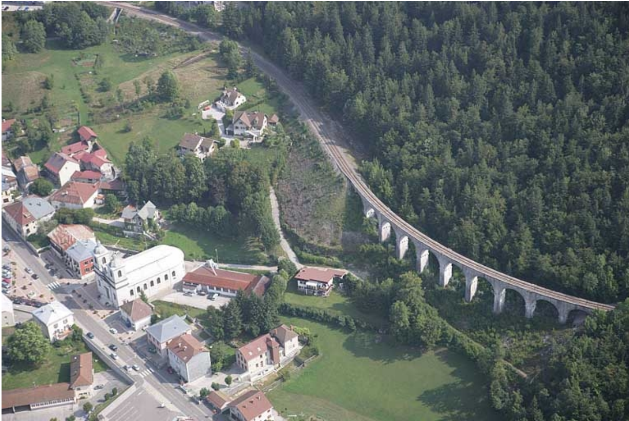
Vue aérienne, depuis le sud-ouest.

39, Morbier, lieudit : le Bois des Crottes