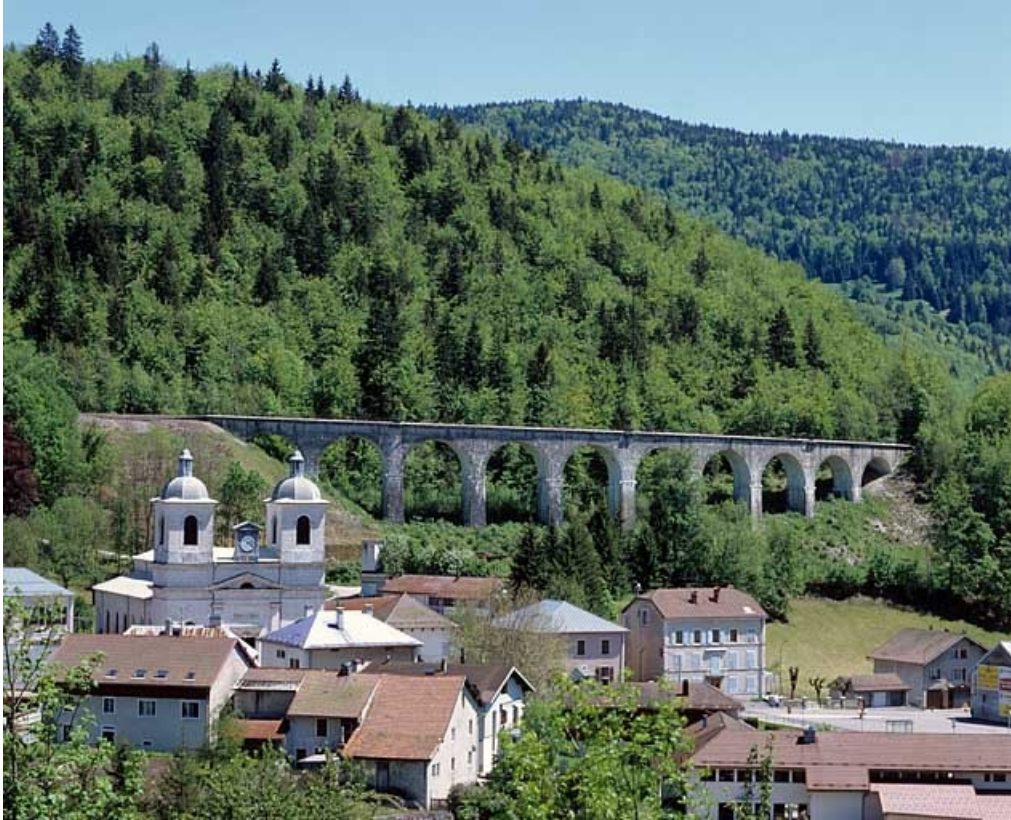
Vue d'ensemble, depuis l'ouest.

39, Morbier, lieudit : le Bois des Crottes