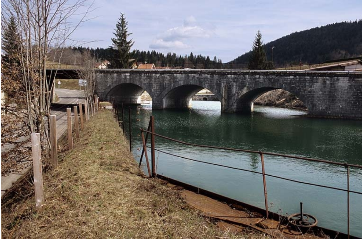
Vue d'ensemble depuis le bassin de retenue (sud-ouest), en aval.