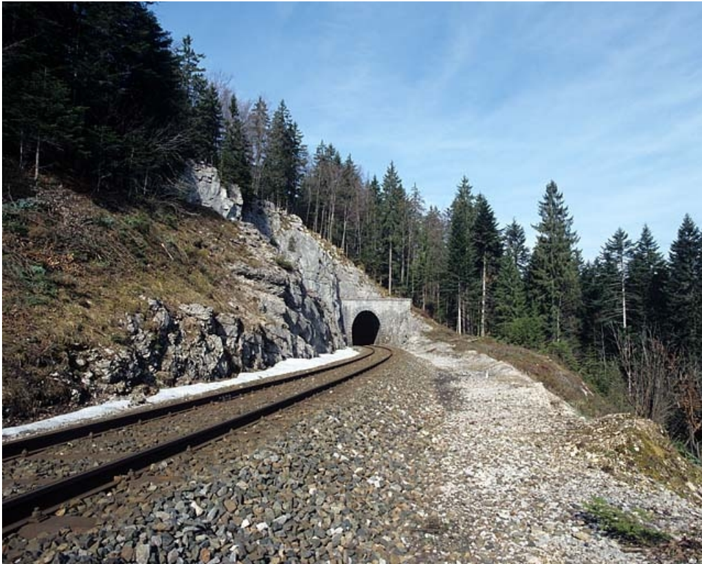
Vue d'ensemble de la tête côté La Cluse.

39, Saint-Laurent-en-Grandvaux, lieudit : la Forêt de la Joux devant