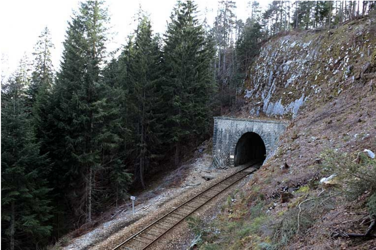
Vue plongeante sur la tête côté Andelot-en-Montagne.

39, Saint-Laurent-en-Grandvaux, lieudit : la Forêt de la Joux devant