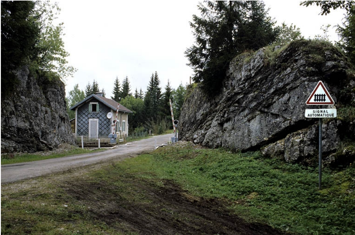
Vue d'ensemble, depuis le sud.

39, Saint-Laurent-en-Grandvaux, 12 route des Gyps, lieudit : sur les Frasses