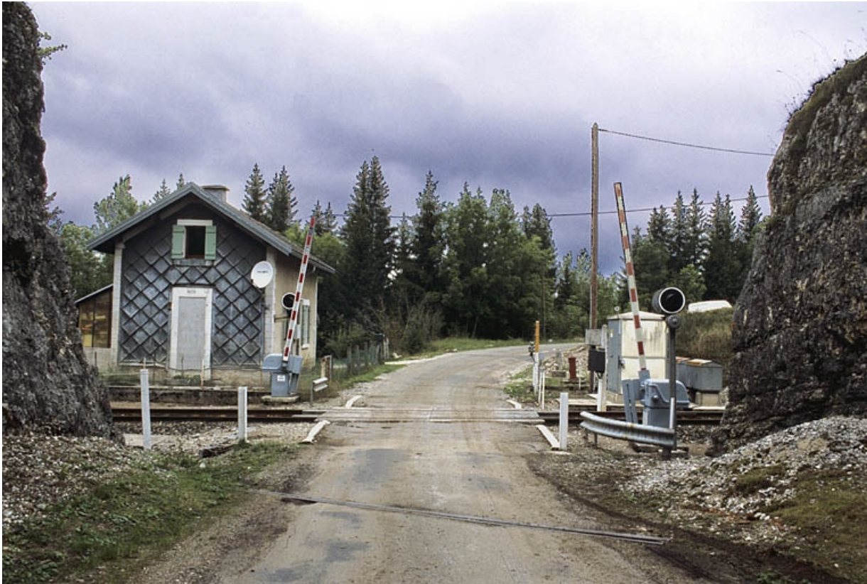
Façade sud (côté voie).

39, Saint-Laurent-en-Grandvaux, 12 route des Gyps, lieudit : sur les Frasses