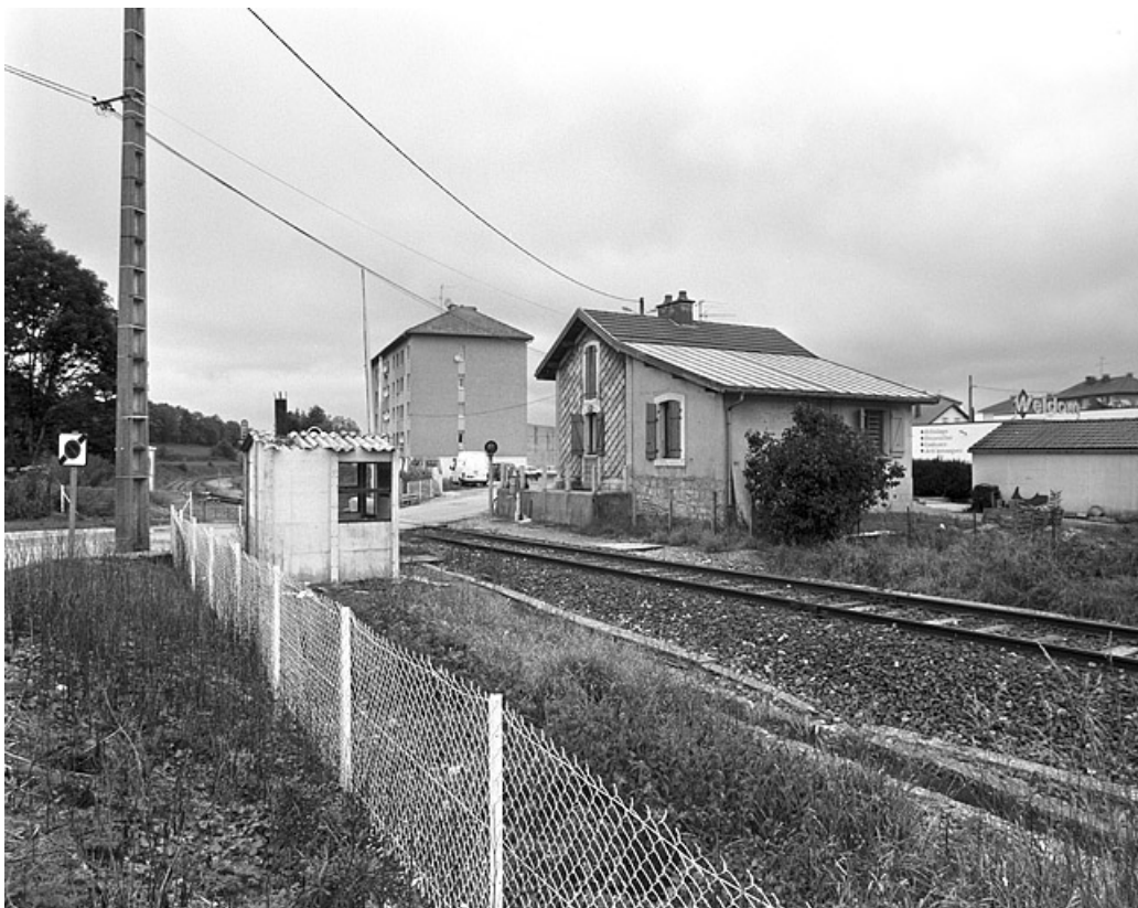
Vue d'ensemble, depuis le sud-est (côté La Cluse).

39, Saint-Laurent-en-Grandvaux, 9 rue des Rochats