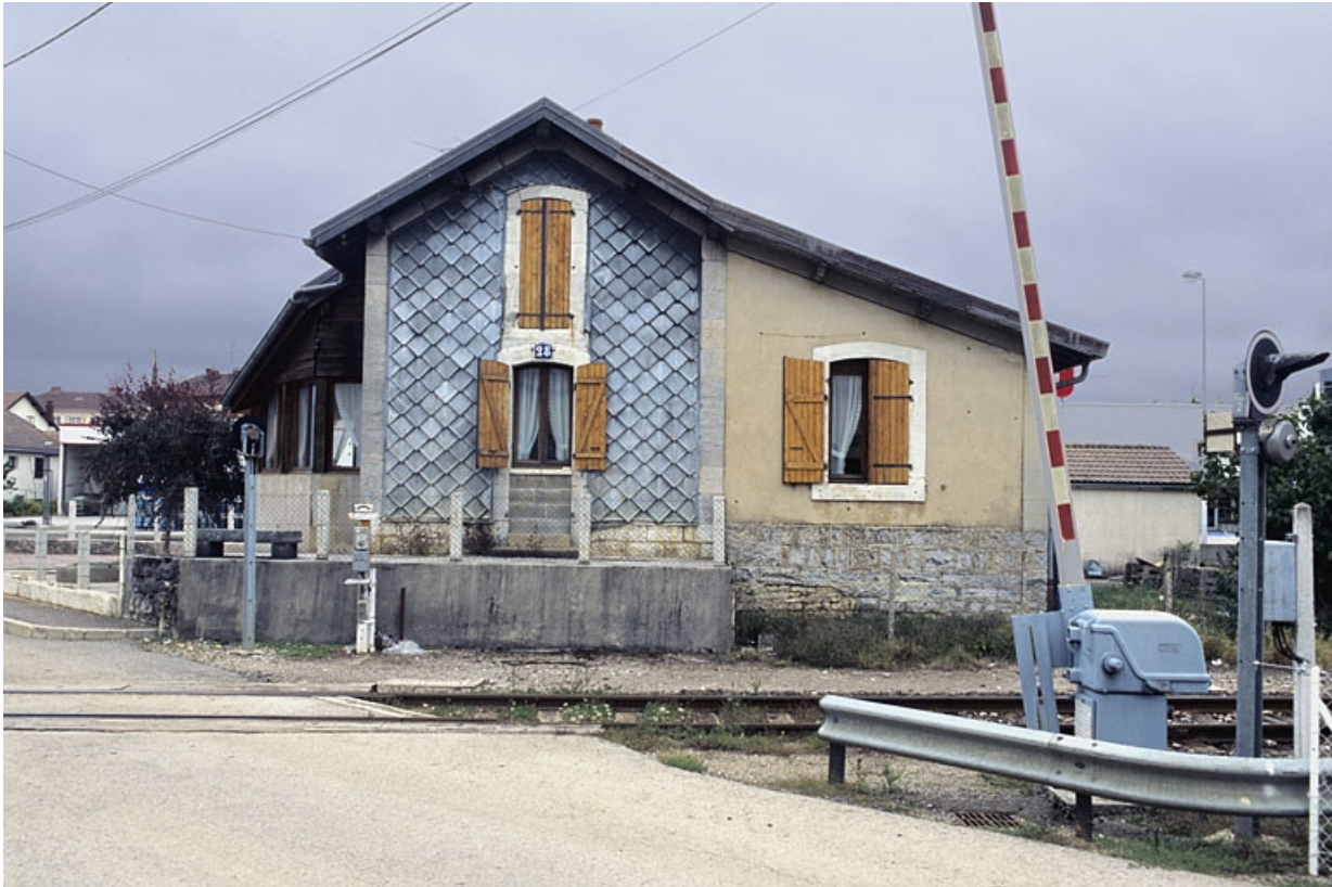
Façade sud (côté voie).

39, Saint-Laurent-en-Grandvaux, 9 rue des Rochats