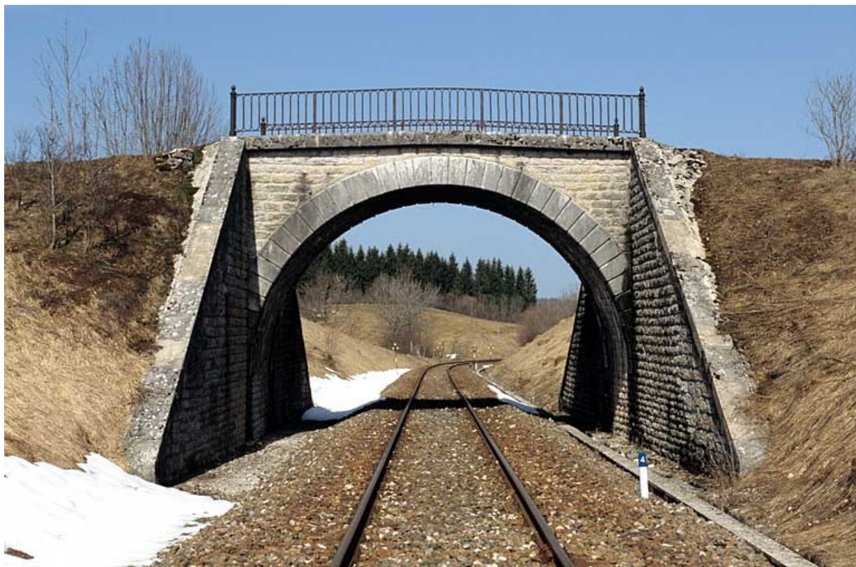
Vue d'ensemble depuis la voie (côté La Cluse).

39, Saint-Laurent-en-Grandvaux V.C. 9, lieudit : Champs de la Pesse