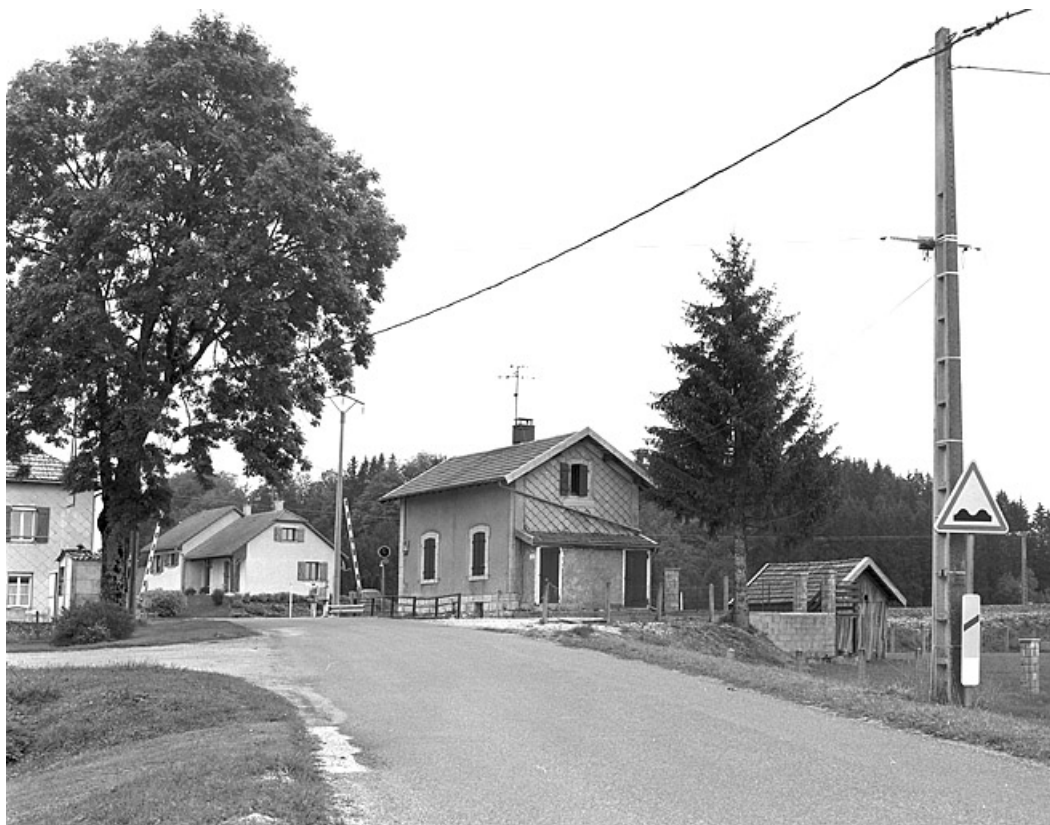
Vue d'ensemble, depuis l'ouest.

39, La Chaumusse, 19 route de Saint-Pierre, lieudit : les Grands Clos