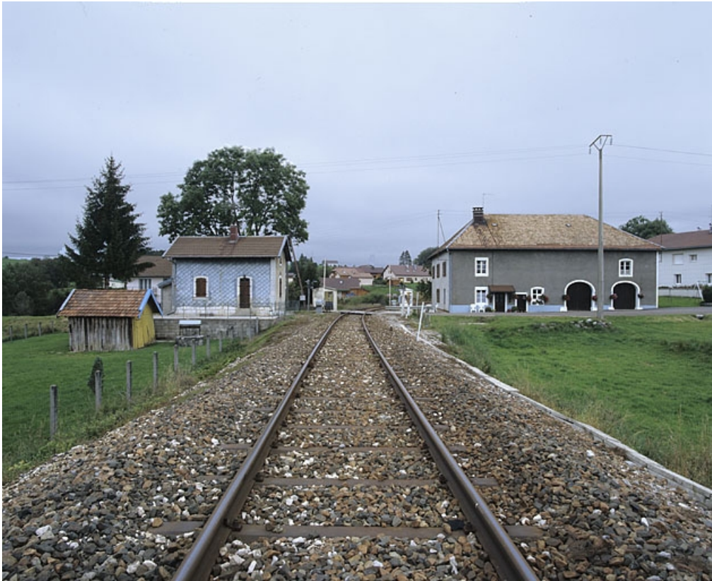
Vue d'ensemble depuis la voie, au sud.

39, La Chaumusse, 19 route de Saint-Pierre, lieudit : les Grands Clos