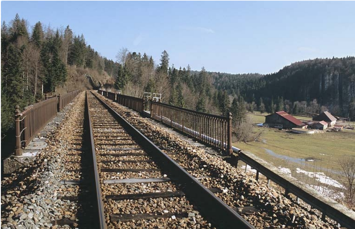
Voie sur le viaduc, depuis le côté La Cluse.