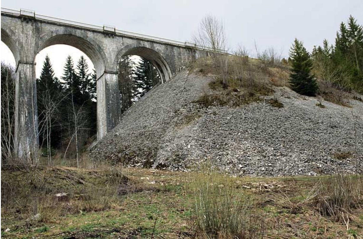
Extrémité et quart de cône côté Andelot-en-Montagne, depuis l'est.