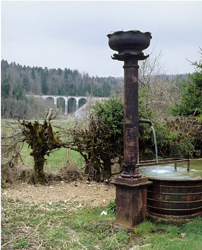
Vue d'ensemble depuis l'est, avec fontaine au premier plan.