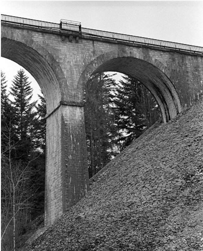
Première arche côté Andelot-en-Montagne, depuis l'est.