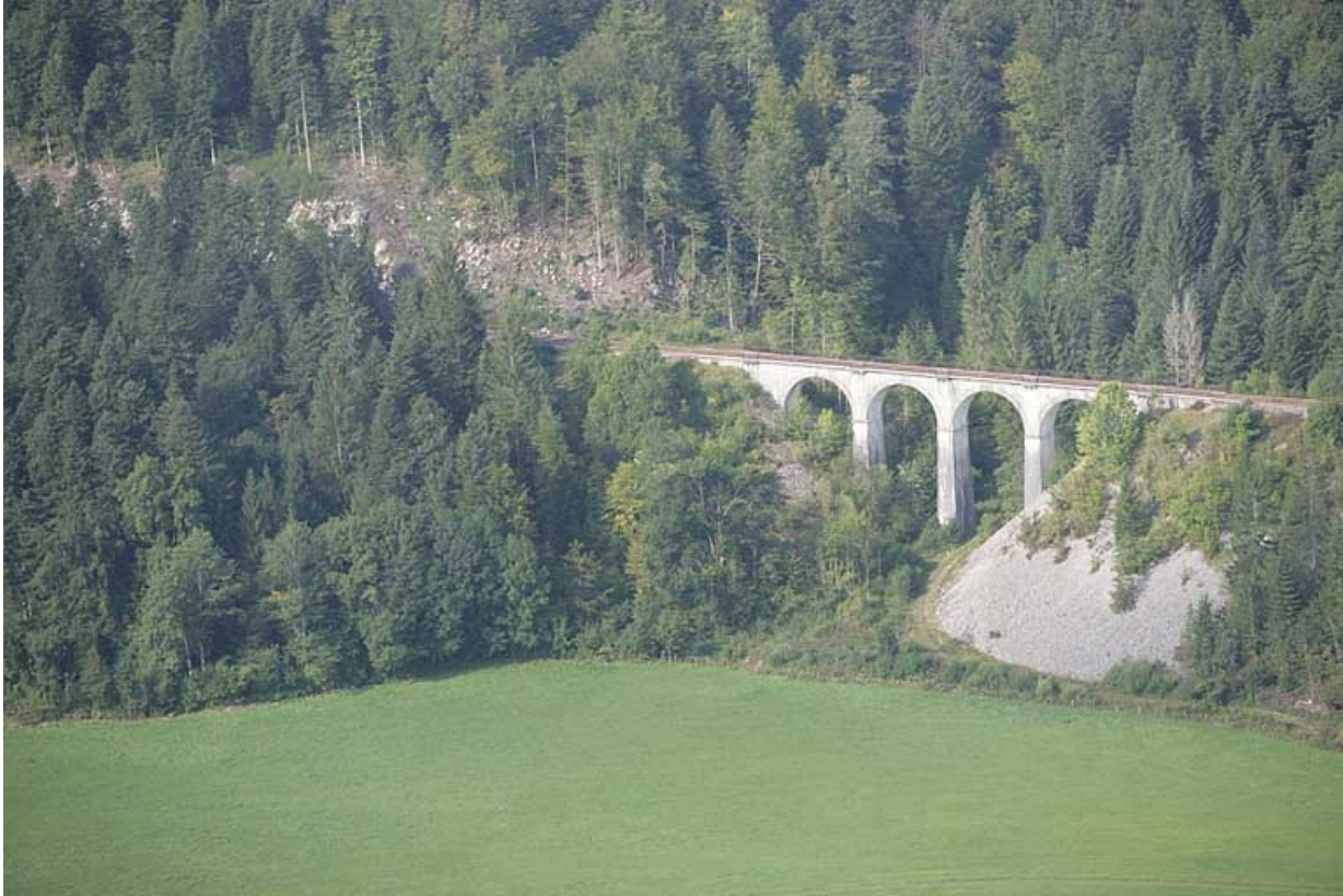
Vue aérienne, depuis le nord-est.