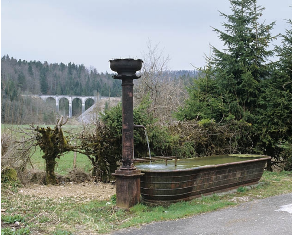
Vue d'ensemble depuis l'est, avec fontaine au premier plan (cadrage horizontal).