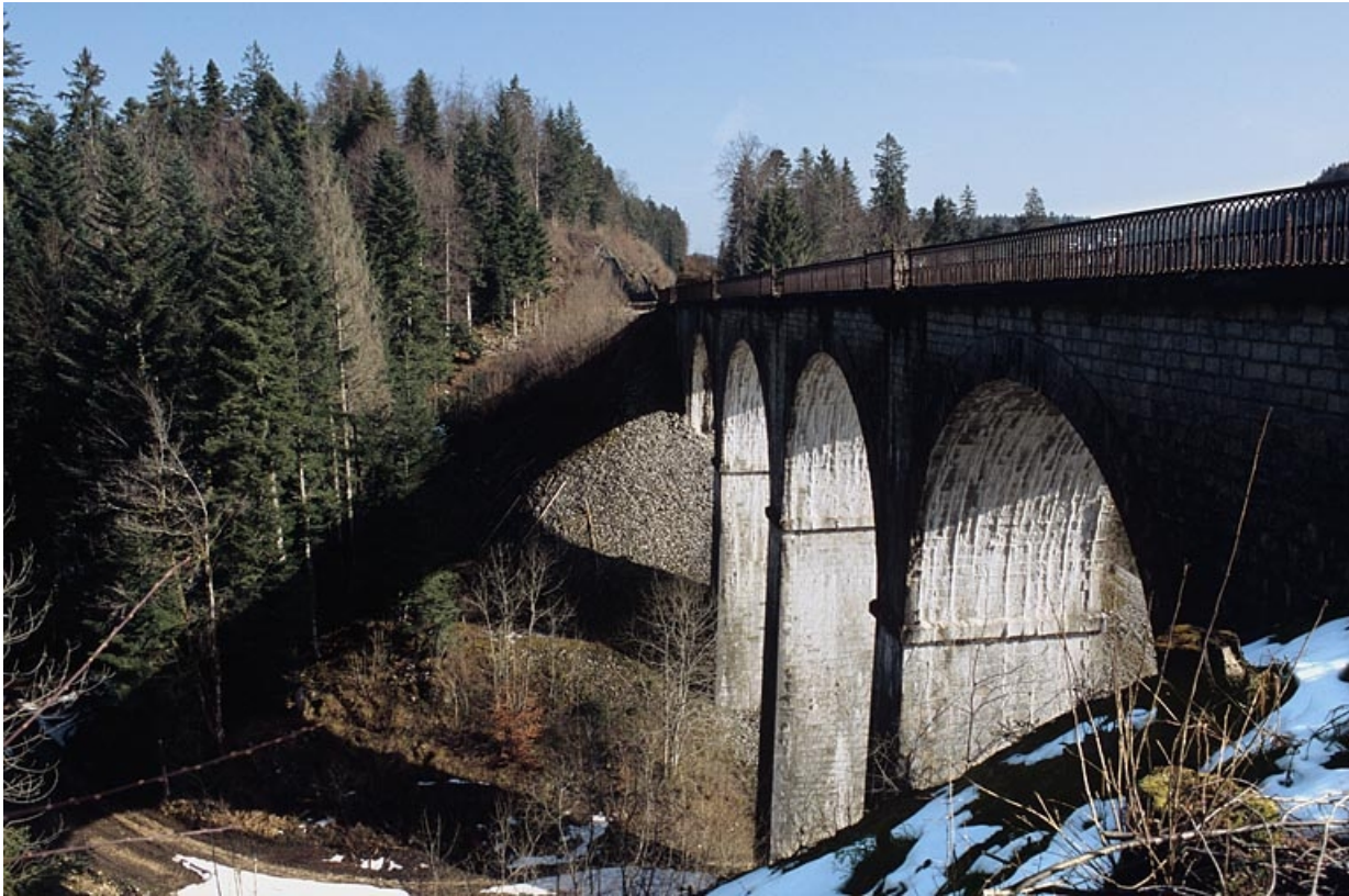
Elévation occidentale vue en enfilade, depuis le côté La Cluse.