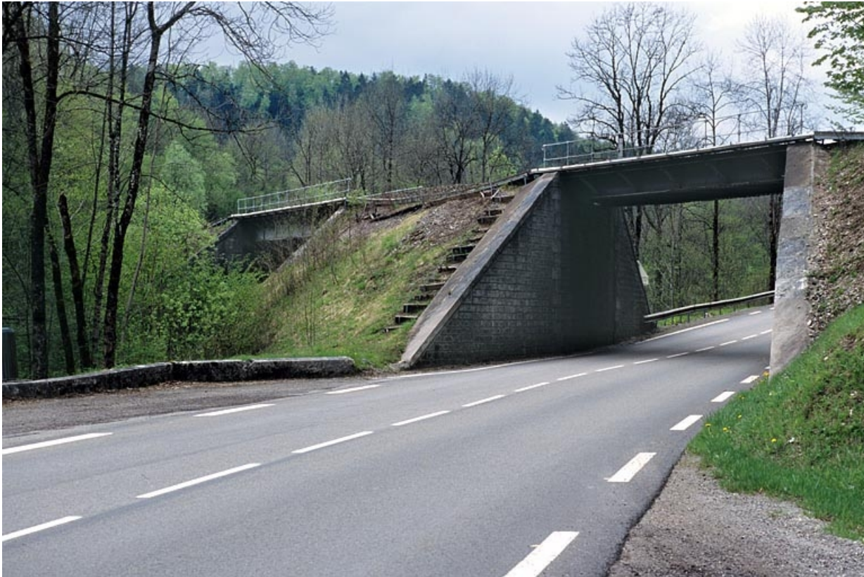
Pont sur la route nationale n° 5 : vue d'ensemble, depuis le côté Andelot-en-Montagne 39, Chaux-des-Crotenay R.N. 5, lieudit : les Belettes