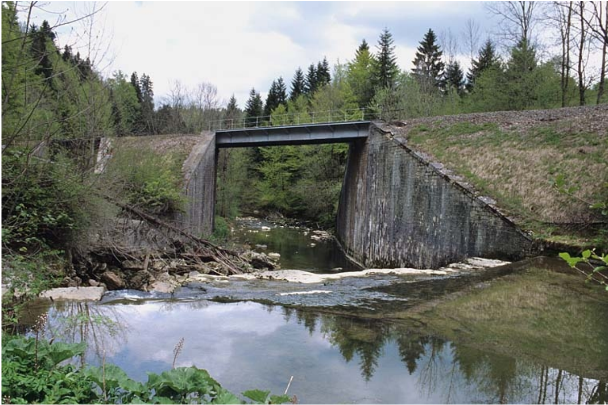
Pont sur la Lemme : vue d'ensemble, côté La Cluse.

39, Chaux-des-Crotenay R.N. 5, lieudit : les Belettes