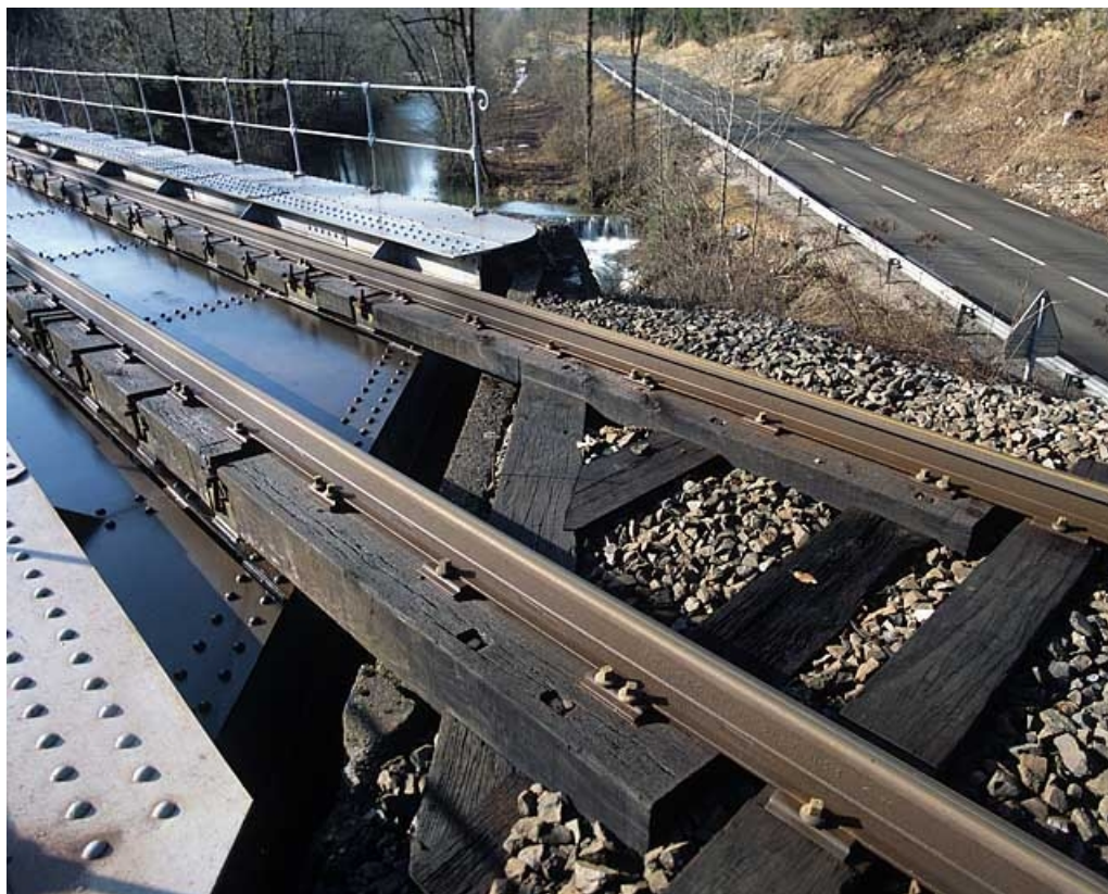
Pont sur la Lemme : jonction du tablier et de la culée droite, depuis la voie.

39, Chaux-des-Crotenay R.N. 5, lieudit : les Belettes