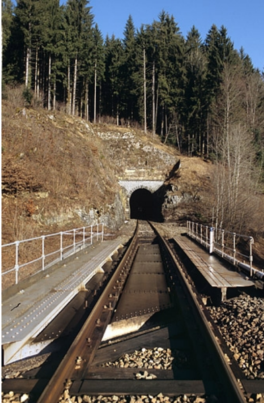
Pont sur la route nationale n° 5 : tablier, depuis la voie côté La Cluse.

39, Chaux-des-Crotenay R.N. 5, lieudit : les Belettes