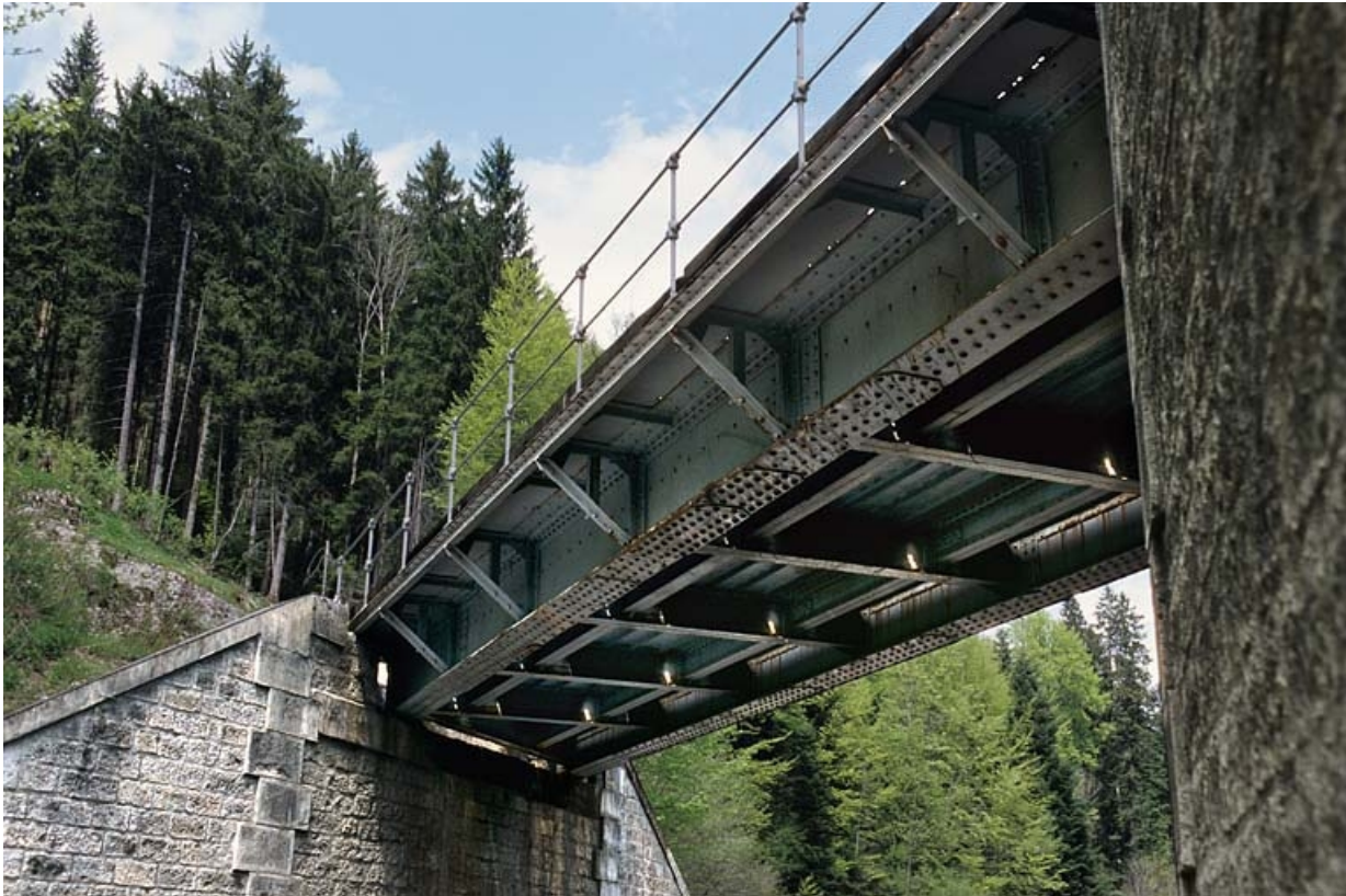
Pont sur la route nationale n° 5 : dessous du tablier.

39, Chaux-des-Crotenay R.N. 5, lieudit : les Belettes