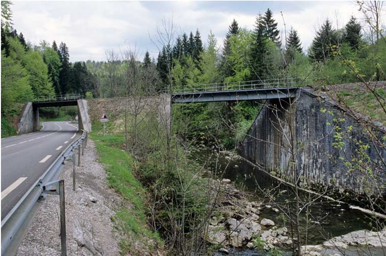
Vue d'ensemble, depuis le côté La Cluse.

39, Chaux-des-Crotenay R.N. 5, lieudit : les Belettes