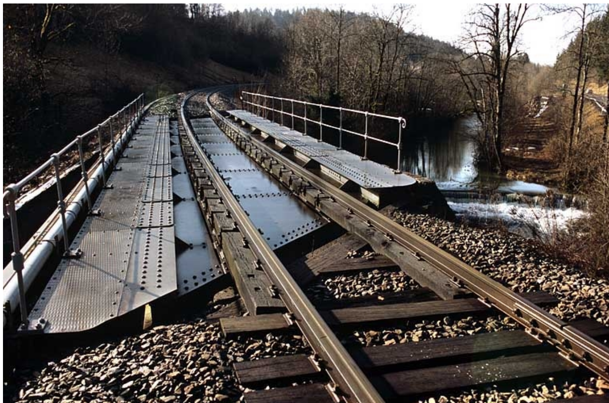
Pont sur la Lemme : tablier, depuis la voie côté Andelot-en-Montagne.

39, Chaux-des-Crotenay R.N. 5, lieudit : les Belettes