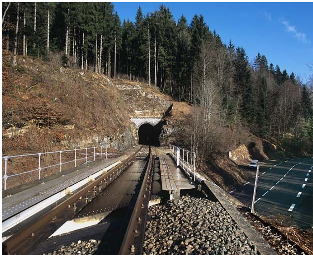
Tunnel : tête côté La Cluse, depuis la voie et le pont sur la R.N. 5.

39, Chaux-des-Crotenay, lieudit : les Belettes