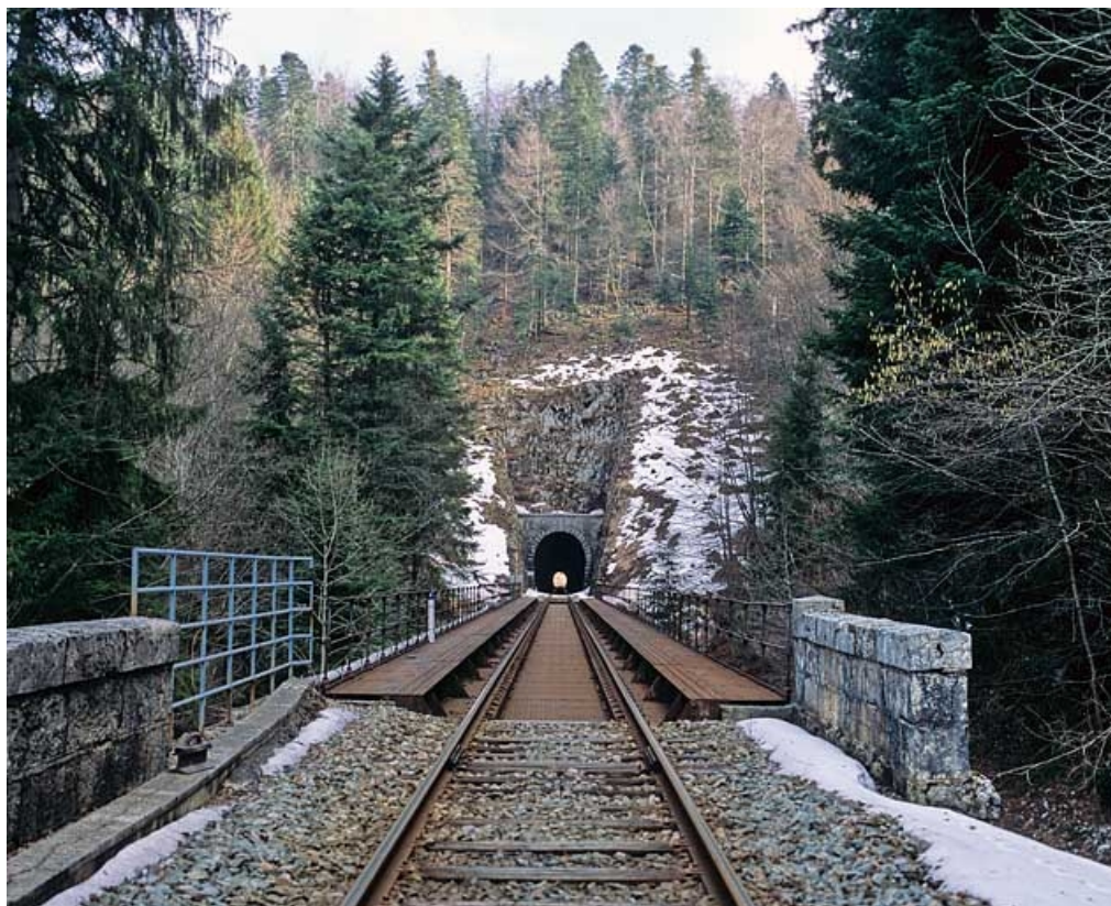
Vue d'ensemble depuis la voie, côté Andelot-en-Montagne.

39, Chaux-des-Crotenay, lieudit : les Belettes