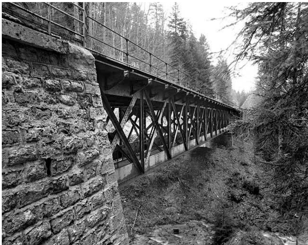
Viaduc : l'extrémité sud (vers La Cluse), côté vallée.

39, Chaux-des-Crotenay, lieudit : les Belettes