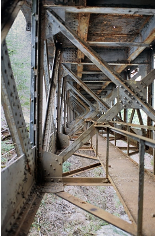
Viaduc : passerelle sous le tablier (vue désaxée à gauche).

39, Chaux-des-Crotenay, lieudit : les Belettes