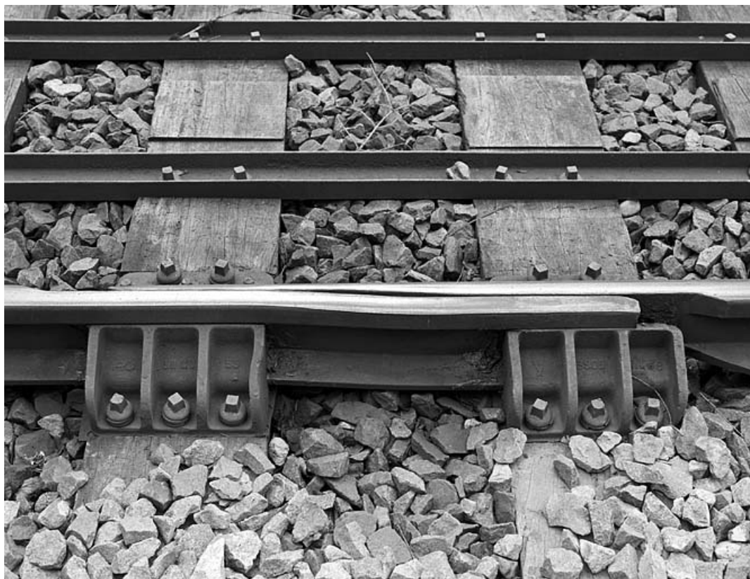
Viaduc : appareil de dilatation. Les extrémités des rails, amincies et guidées dans des coussinets, peuvent glisser l'une contre l'autre lorsque les travées métalliques se dilatent.

39, Chaux-des-Crotenay, lieudit : les Belettes