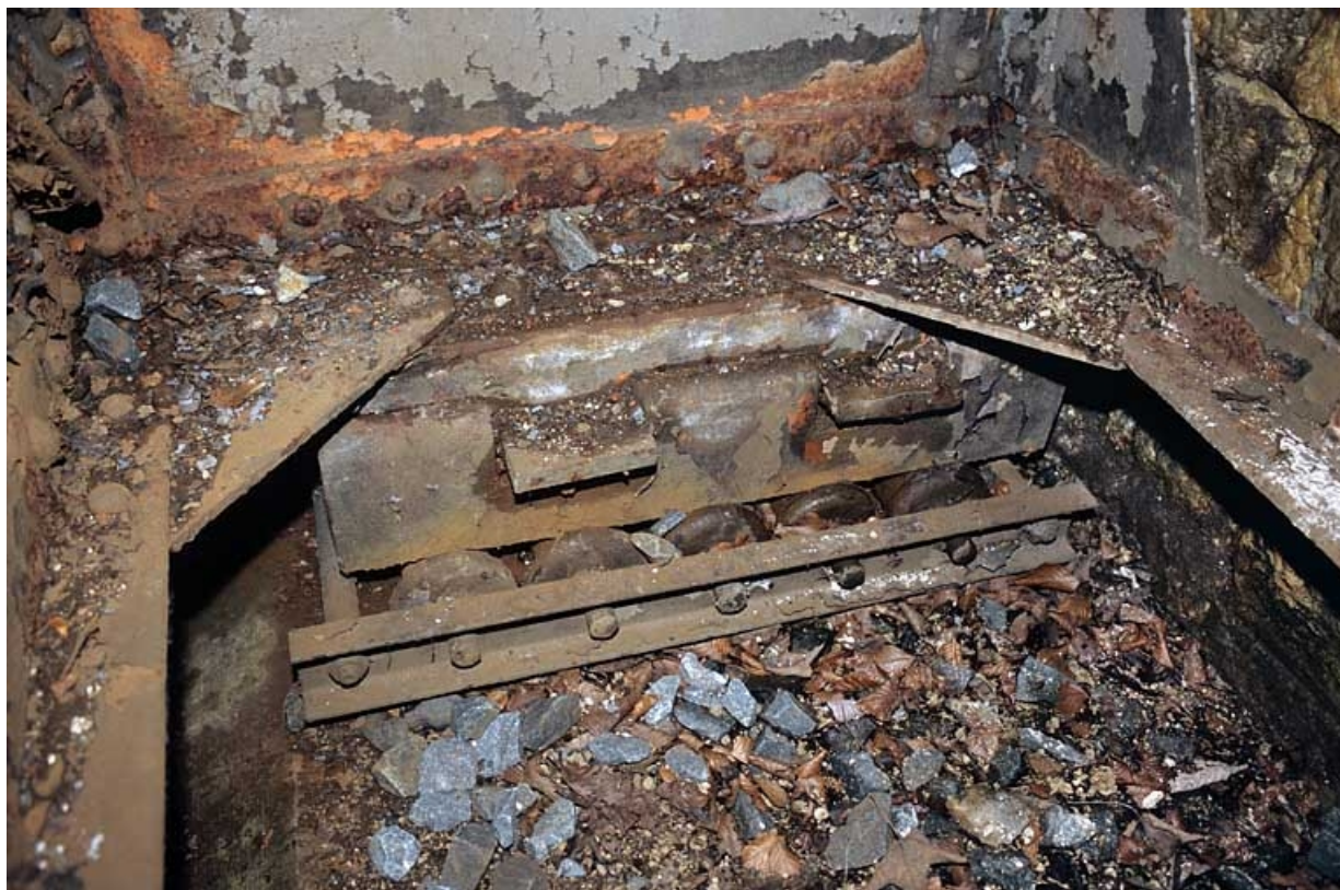
Viaduc : appareil d'appui mobile à 5 galets de roulement.

39, Chaux-des-Crotenay, lieudit : les Belettes