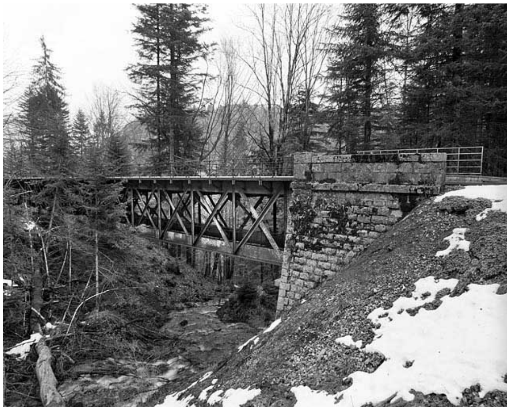
Viaduc : l'extrémité sud (vers La Cluse), côté rocher.

39, Chaux-des-Crotenay, lieudit : les Belettes