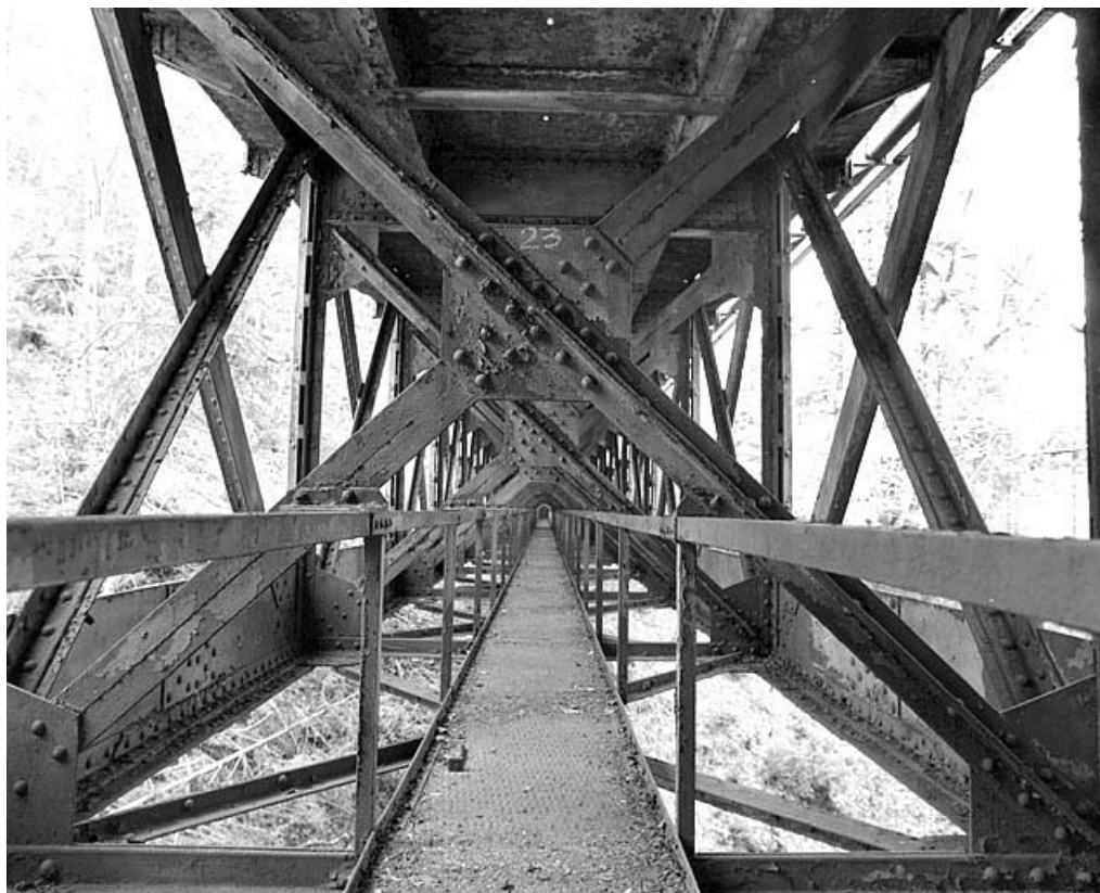
Viaduc : passerelle sous le tablier.

39, Chaux-des-Crotenay, lieudit : les Belettes