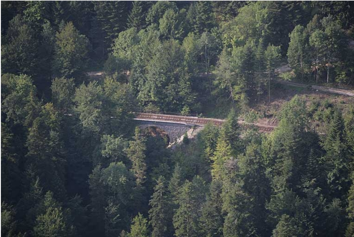
Vue aérienne du viaduc, depuis le nord.

39, Le Vaudioux Route forestière de Sous la Baume, lieudit : Malproche