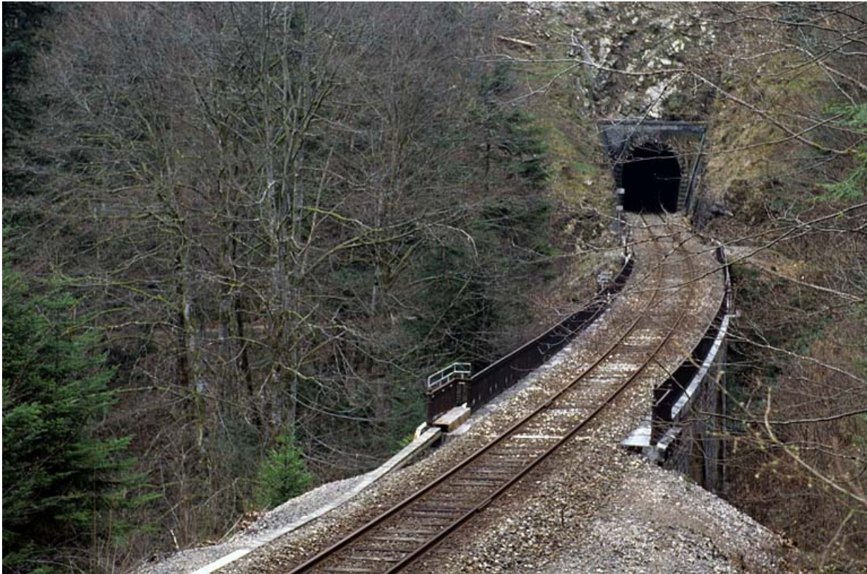
Viaduc : vue d'ensemble, depuis le nord-ouest (côté Andelot-en-Montagne).

39, Le Vaudioux Route forestière de Sous la Baume, lieudit : Malproche