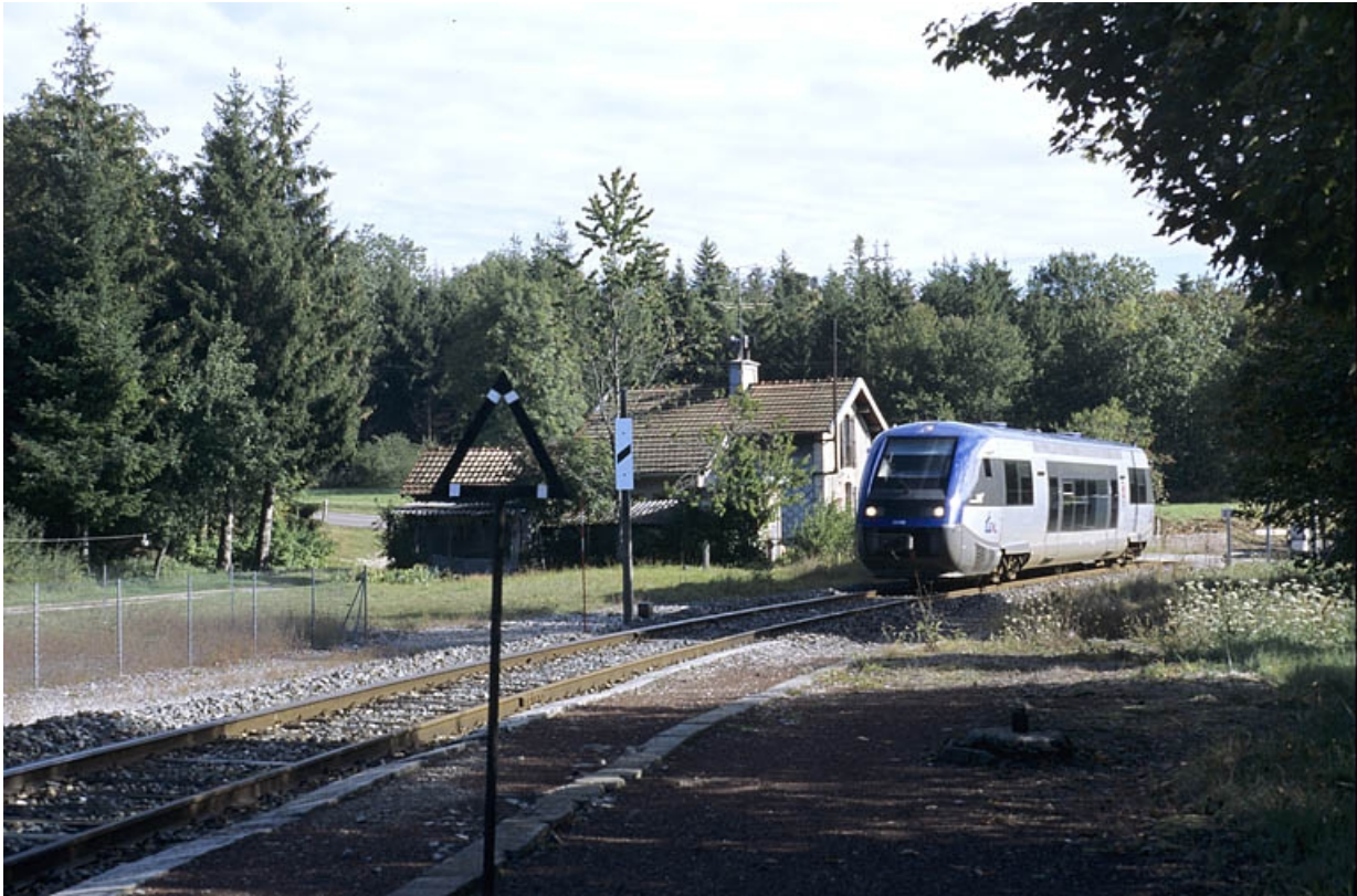
Arrivée en gare d'un autorail X 73500.

39, Le Vaudioux R.N. 5, lieudit : la Billaude du Haut