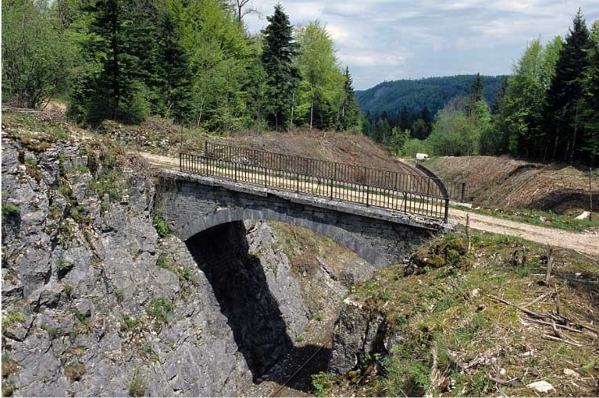
Vue plongeante, depuis le sud (côté La Cluse).