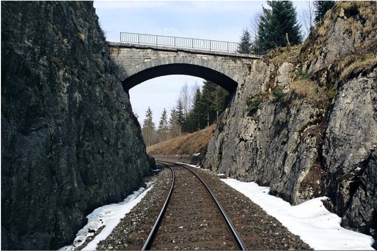
Vue d'ensemble, depuis la voie (côté Andelot-en-Montagne).