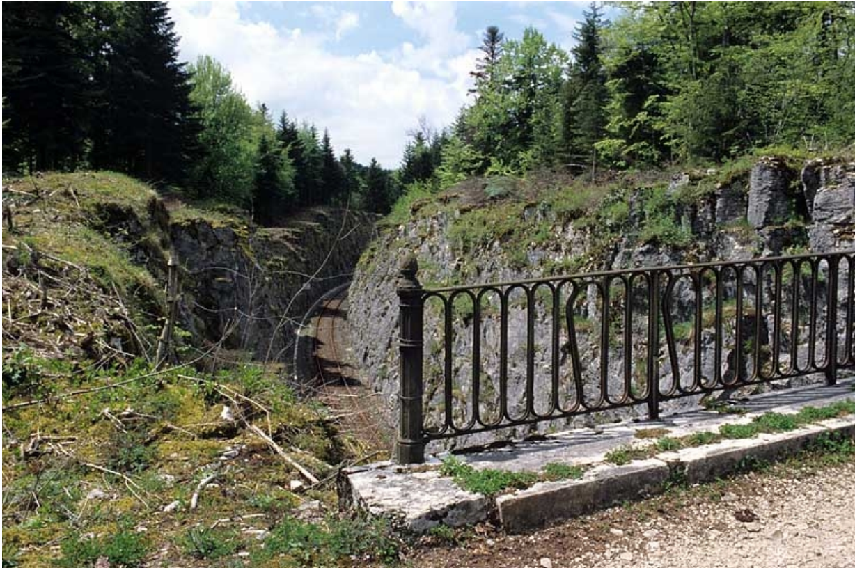
Tranchée côté Andelot-en-Montagne et détail du garde-corps.