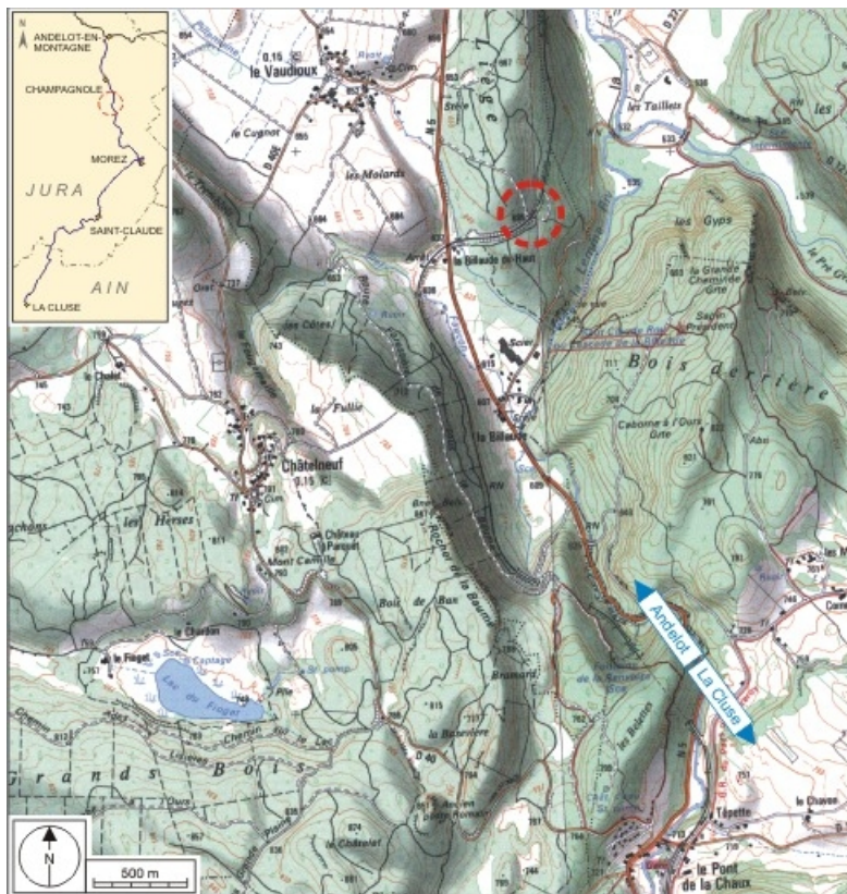
Carte et schéma de localisation. Carte topographique, IGN, 2000, dalle F087_048, échelle 1:25 000. Scan 25, licence n° 2008/CISE/2968.