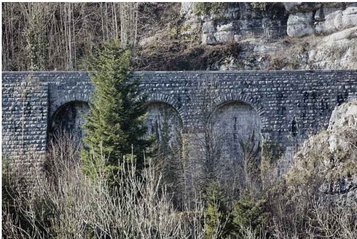
Premier mur à arcades : 3 arches du côté Andelot-en-Montagne.