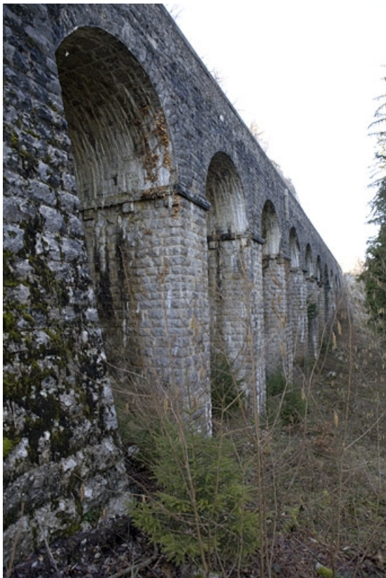
Deuxième mur à arcades : vue en enfilade, depuis le côté La Cluse. Mur débutant au PK 020.411. 39, Syam, lieudit : la Liège