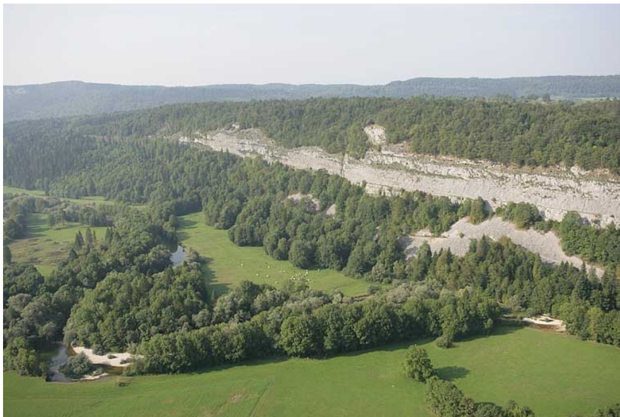
Vue aérienne de la voie et de la falaise, depuis le nord-est.