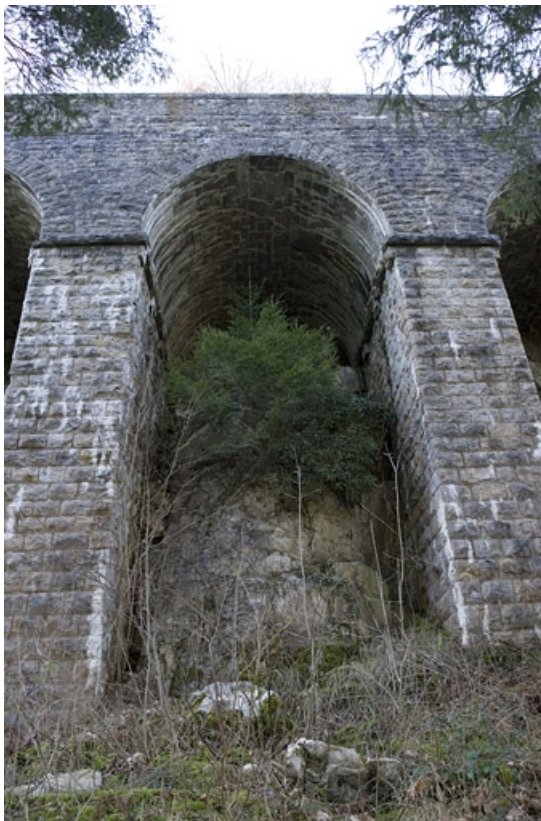
Deuxième mur à arcades : arche enjambant le rocher.