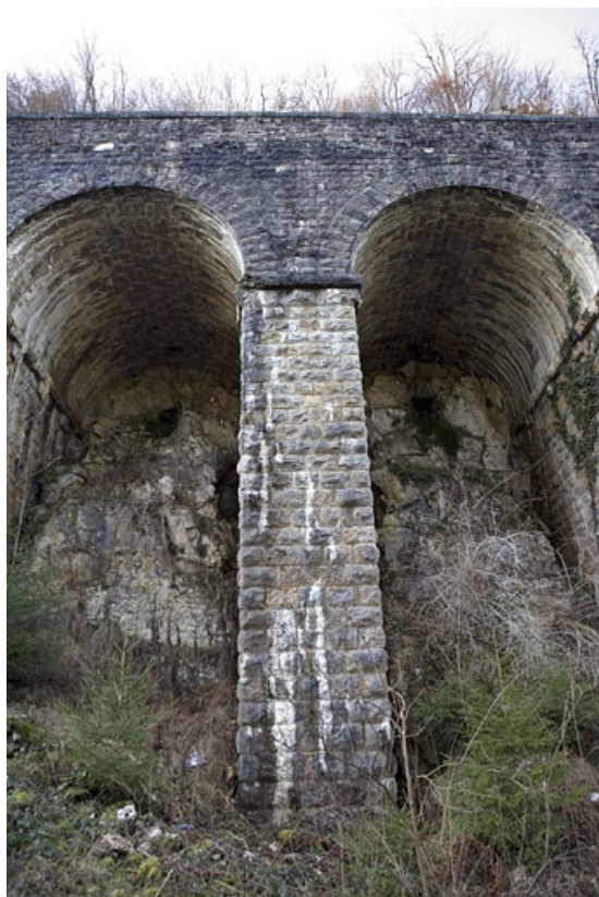
Deuxième mur à arcades : deux arches.