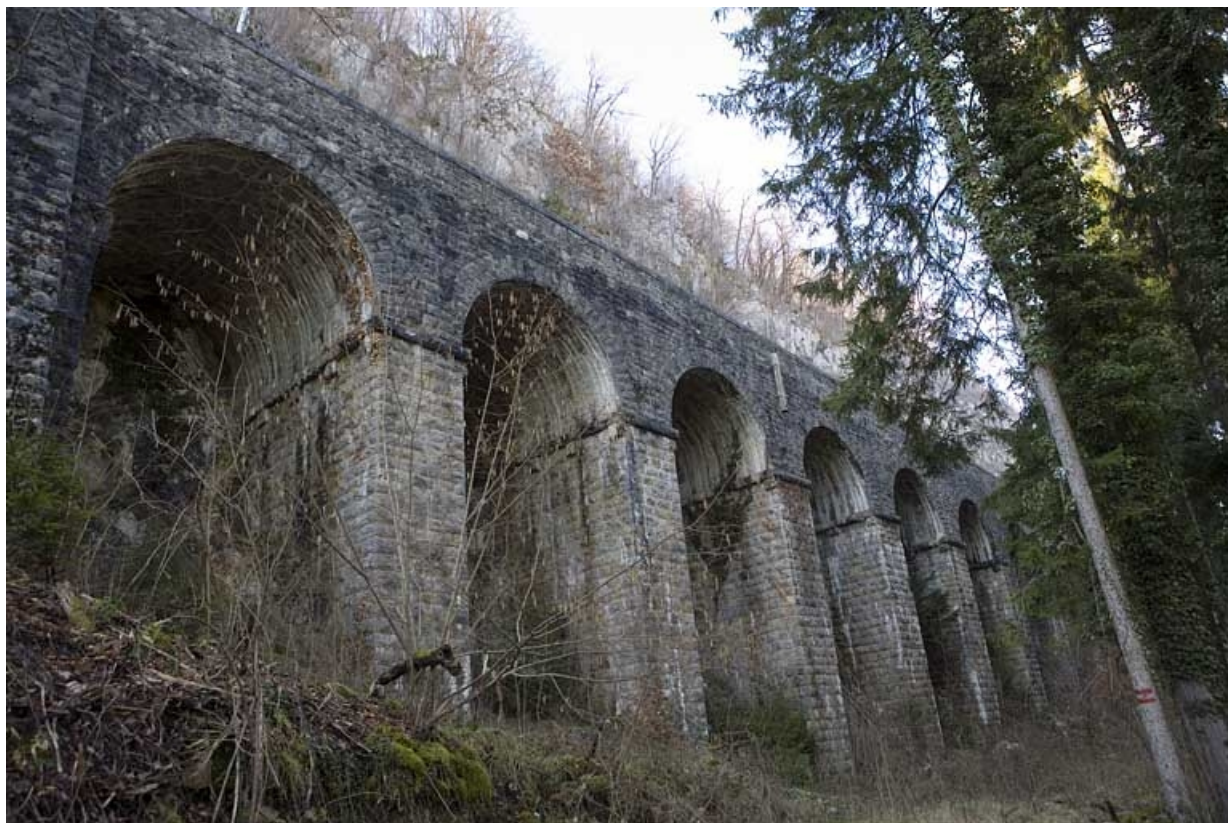
Deuxième mur à arcades : vue de trois quarts droite.