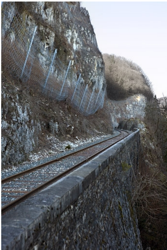
Mur de soutènement vers la vallée, depuis le côté La Cluse.