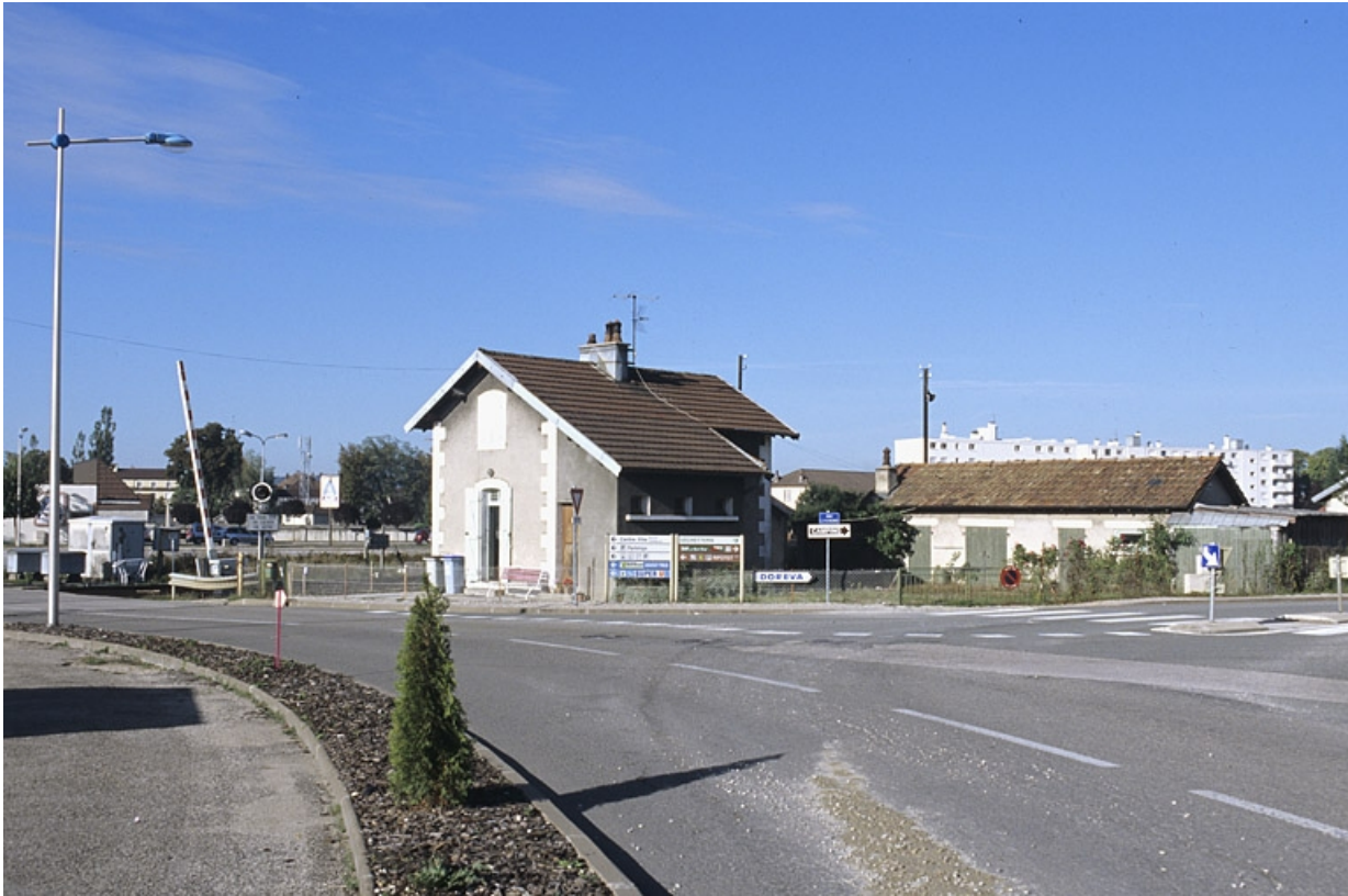
Vue d'ensemble, depuis l'est.

39, Champagnole rue Léon et Georges Bazinet