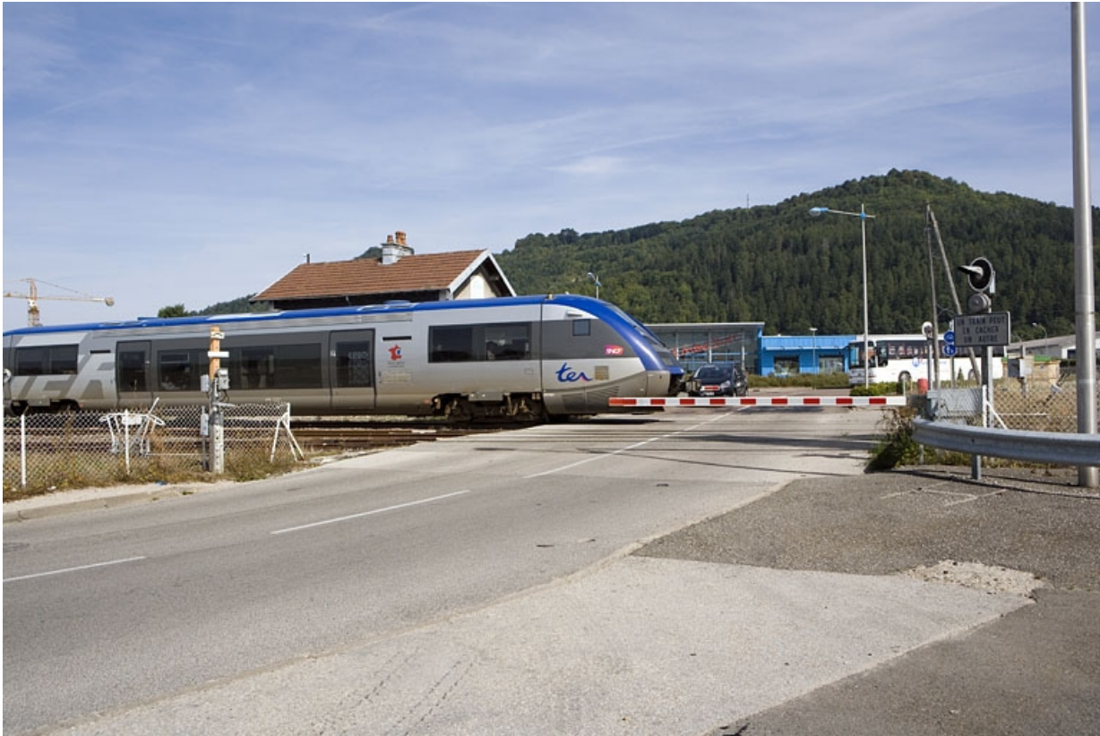
Autorail X 73500 franchissant le passage à niveau.

39, Champagne rue Léon et Georges Bazinet