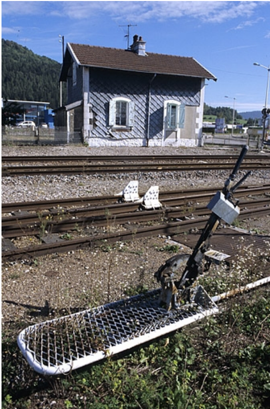
Au premier plan, levier de manoeuvre d'appareil de voie.

39, Champagnole rue Léon et Georges Bazinet