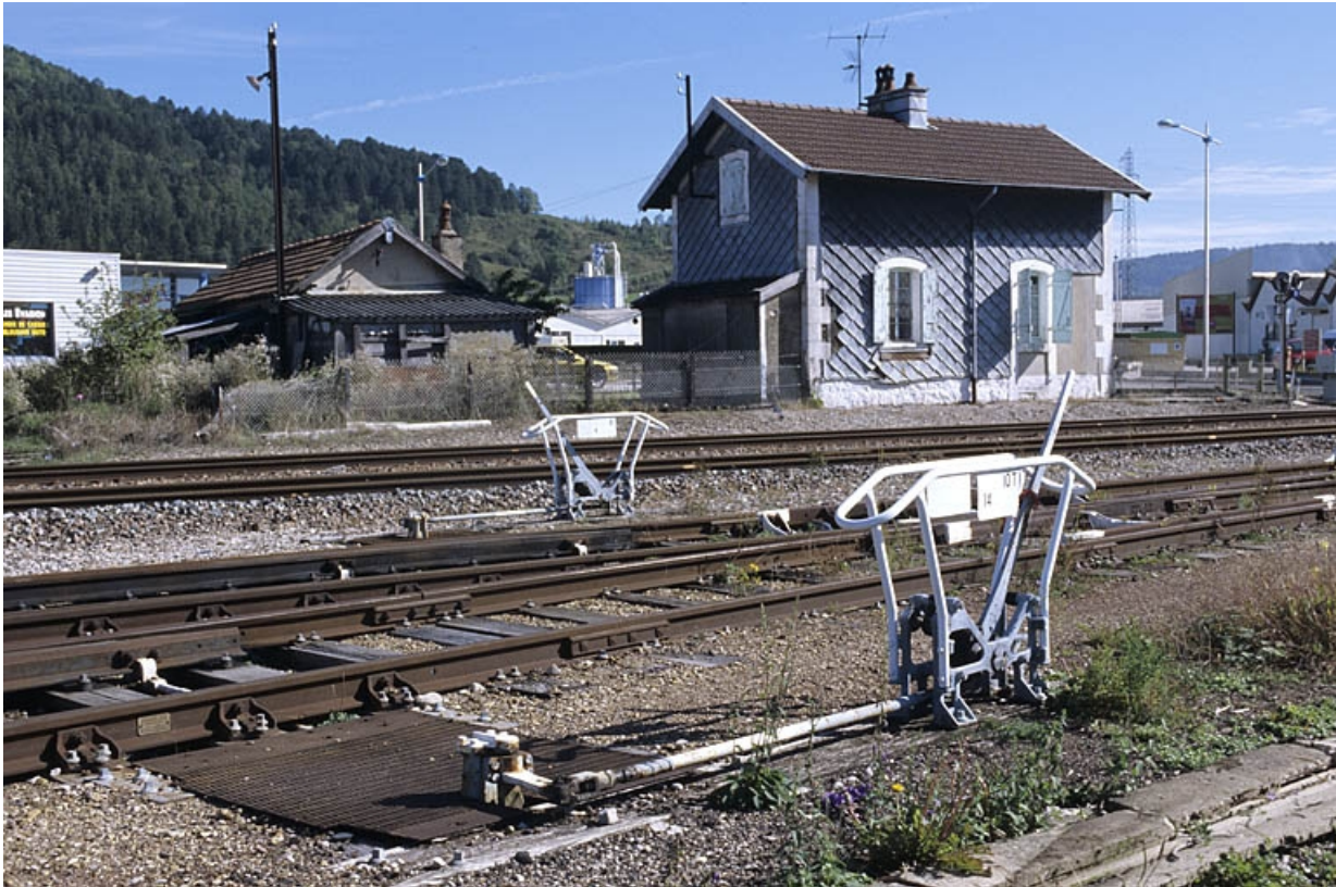
Vue d'ensemble, depuis l'ouest.

39, Champagnole rue Léon et Georges Bazinet