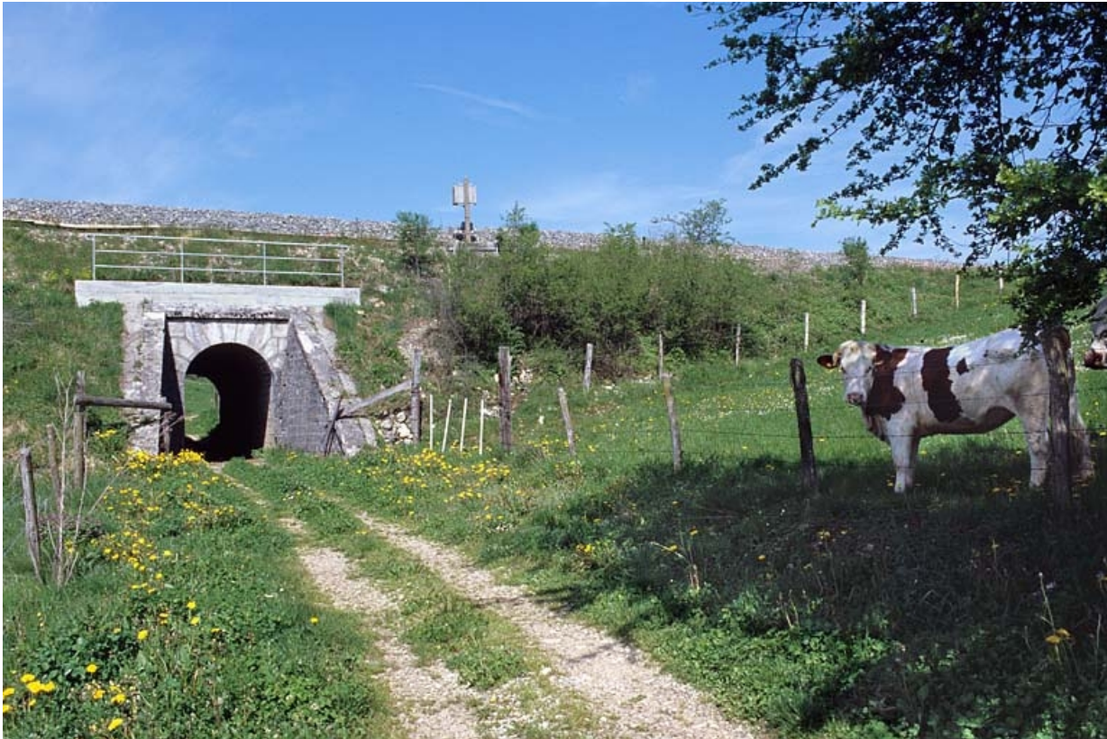
Vue d'ensemble de trois quarts, depuis l'est.