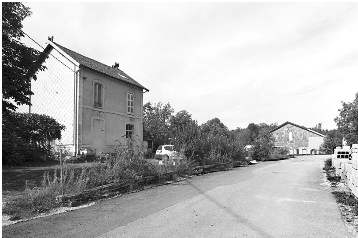
Vue d'ensemble, depuis le sud-est.

39, Vers-en-Montagne, 79, 80 chemin du Quai