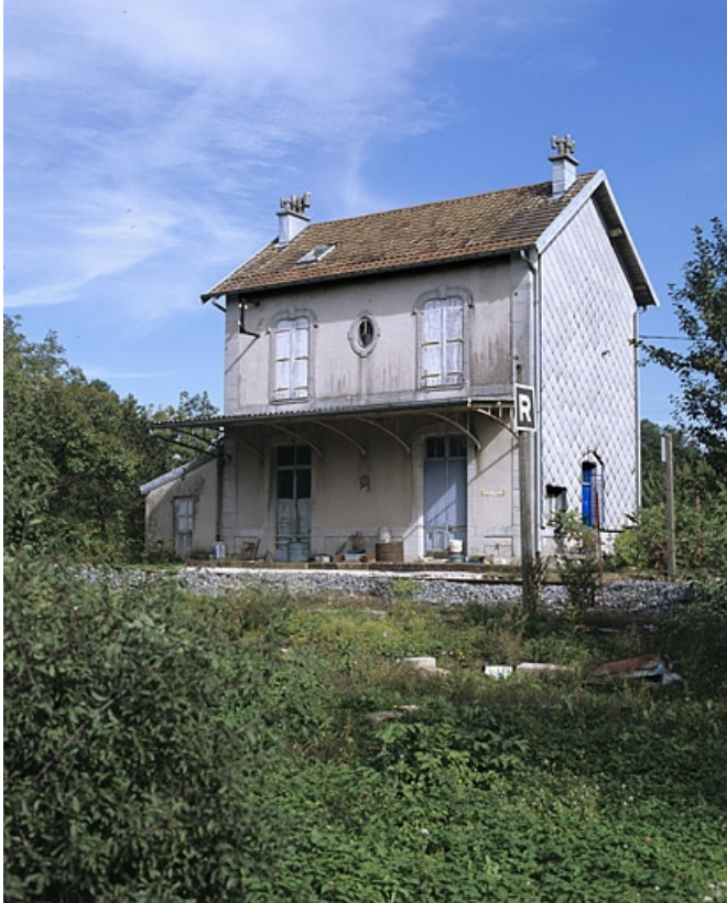
Façade postérieure, de trois quarts droite. 39, Vers-en-Montagne, 79, 80 chemin du Quai