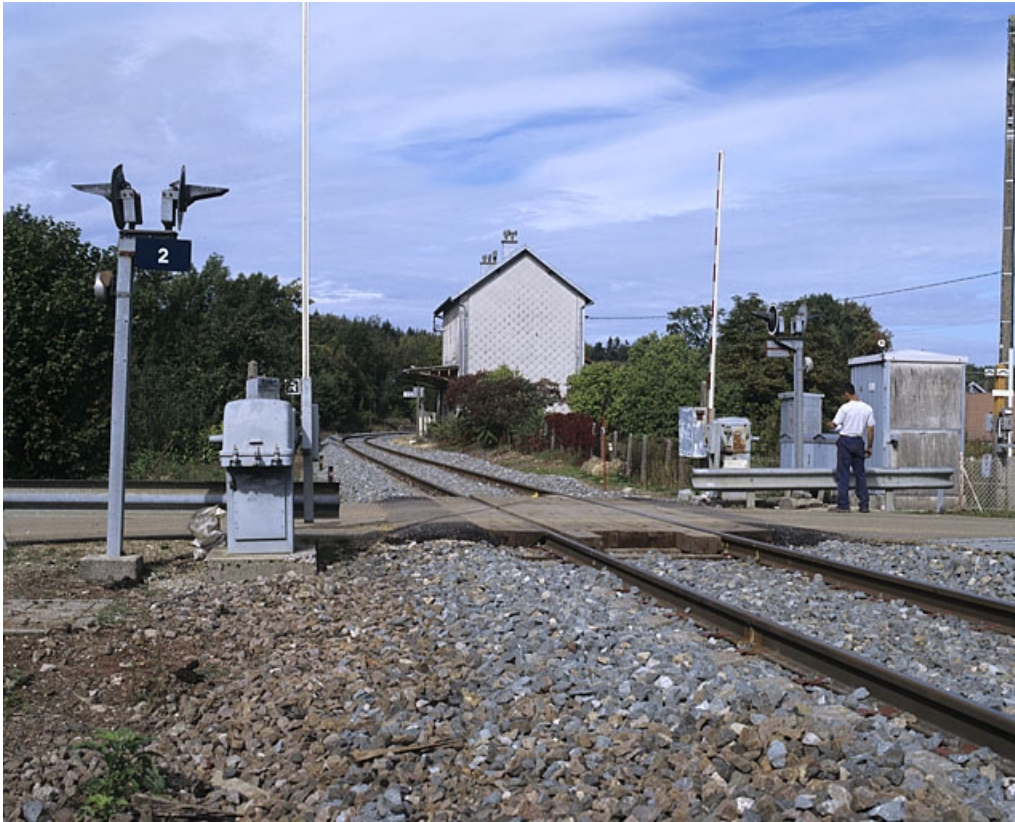
Vue d'ensemble depuis le passage à niveau n° 2, au sud.

39, Vers-en-Montagne, 79, 80 chemin du Quai